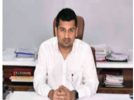
અપાવો છે, જ્યાં રહેવા, ભોજન

અપાવો છે, જ્યાં રહેવા, ભોજન અને પીવાના પાણી સહિતની જરૂરી સુવિધાઓ ઉપલબ્ધ કરાવવામાં આવી રહી છે. હવામાન વિભાગના ૨૬ એલર્ટને ધ્યાનમાં રાખીને એન.ડી.આર.એફ, ફાયર વિભાગ અને સમગ્ર સરકારી તંત્રને હાઈ એલર્ટ પર રાખવામાં આવ્યું છે.