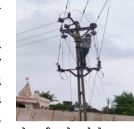
ખોરવાઈ ગયો હતો તેમજ ૨૪૦ વીજ પોલ પડી ગયા હતા અને ૧૩

હતા. જોકે વીજ કર્મચારીઓએ દિન-રાત કામગીરી કરી ૨૪ કલાકમાં ૫૮ જેટલા ગામડાઓમાં વીજ પુરવઠો પુનઃ શરૂ કરવામાં આવ્યો હતો. વીજ અધિકારી વનરાના જણાવ્યા મુજબ અમરેલી જિલ્લામાં ભારે વરસાદને કારણે જાફરાબાદ, રાજુલા, ખાંભા, ચલાલા, ધારી, લાઠીના ૮૮ જેટલા ગ્રામ્ય વિસ્તારોમાં વીજ પુરવઠો