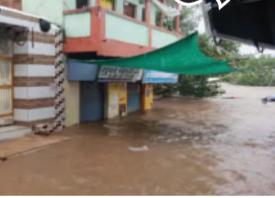
પ્રવાહ વધી જતા સ્થિતિ વધુ ગંભીર બની હતી. ગામને જોડતા બે પુલ

તેમજ વેપારીઓના માલસામાનને નુકસાન થયું હતું. ગઈકાલ બપોરથી શરૂ થયેલા વરસાદ બાદ સવારે નદીમાં પુર આવ્યો હતો અને બપોર પછી ફરી પાણીનો