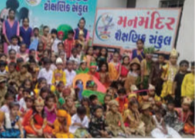
પણ રજૂ કરવામાં આવ્યા હતા. સ્પર્ધા દરમિયાન વિદ્યાર્થીઓના આત્મવિશ્વાસ, અભિનય અને સર્જનાત્મકતાને ઉપસ્થિતિએ બિરદાવી હતી.

પાઠોની વેશભૂષા ધારણ કરી સૌનું ધ્યાન આકર્ષ્યું હતું. ભગવાન રામ, લક્ષ્મણ, સીતાજી, પાર્વતીજી, ભગવાન શિવ, ગોવાળ, ભરવાડ, શિક્ષક, ખેડૂત અને પરી ઉપરાંત કેરી, આનનસ, સફરજન, સેવ વોટર, ટ્રાફિક લાઈટ, સિંહ, વાઘ, ડોરેમોન અને હાથી જેવા પાત્રો