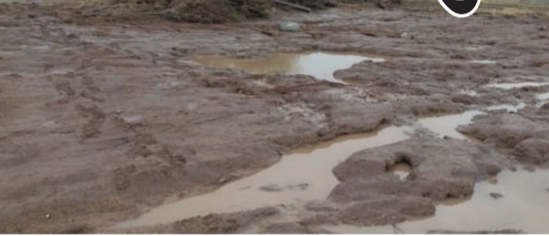
અમરેલી જિલ્લામાં પડેલા ભારે વરસાદના કારણે અમરેલી તાલુકાના ચાંદગઢ અને લાપાળીયા ગામના ખેતરોમાં ભારે ધોવાણ થયું છે. સતત વરસેલા વરસાદથી ખેતીલાયક જમીનને નુકસાન પહોંચ્યું છે. સાથે ખેડૂતો ખેતરે જવા માટે

અમરેલી જિલ્લામાં પડેલા ભારે વરસાદના કારણે અમરેલી તાલુકાના ચાંદગઢ અને લાપાળીયા ગામના ખેતરોમાં ભારે ધોવાણ થયું છે. સતત વરસેલા વરસાદથી ખેતીલાયક જમીનને નુકસાન પહોંચ્યું છે. સાથે ખેડૂતો ખેતરે જવા માટે ઉપયોગમાં લેતા ગાડા માર્ગ અવરજવર મુશ્કેલ બની પણ ધોવાઈ ગયા હોવાથી છે. માર્ગ તૂટી જતાં ખેતીના કામોમાં વિલંબ થવાની સ્થિતિ ઉભી થઈ છે. વરસાદના કારણે અનેક સ્થળોએ પાણી ભરાઈ જતાં ખેડૂતોને ખેતરો સુધી પહોંચવામાં ભારે હાલાકીનો સામનો કરવો પડી રહ્યો છે. સ્થાનિક ખેડૂતો દ્વારા માર્ગોનું વહેલી તકે સમારકામ કરવાની માંગ ઉઠી છે.