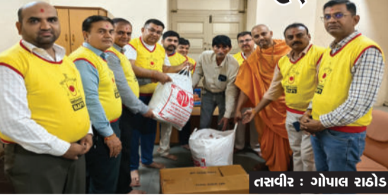
આવા હતા. પૂરથી અસરગ્રસ્ત લોકોને ખાવા પીવાની મુશ્કેલી ઉભી થતા ડેપ્યુટી કલેક્ટર દ્વારા બીએપીએસ સંસ્થાનો સંપર્ક કરાયો હતો. ત્યારબાદ મહુવા બીએપીએસ મંદિર દ્વારા

રાજુલા, તા.૦૯ રાજુલા ખાતે છેલ્લા ૩૬ કલાક દરમિયાન અંદાજિત ૧૨થી ૧૩ ઈંચ જેટલો ધોધમાર વરસાદ વરસતા શહેર તેમજ વડ, ભસાદર, ભરાઈ, રામપરા સહિતના અનેક ગામોમાં પાણી ભરાઈ ગયા હતા. નીચાણવાળા વિસ્તારોમાં પૂરની સ્થિતિ સર્જતા અનેક પરિવારોને સલામત સ્થળે ખસેડવામાં