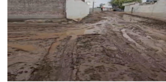
હસ્તક્ષેપ કરવાની માંગ કરી છે. વરસાદી પાણી ભરાવાથી કાદવ-કીચડના કારણે ખાસ કરીને વૃદ્ધો, મહિલાઓ અને શાળાએ જતા વિદ્યાર્થીઓને

ગ્રામજનોના જણાવ્યા મુજબ વર્ષોથી ગામમાં બ્લોક પેવિંગ તથા સિમેન્ટ રોડ બનાવવાની માંગ કરવામાં આવી રહી છે. સ્થાનિક ગ્રામ પંચાયતથી લઈને તાલુકા, જિલ્લા તેમજ સાંસદ સુધી અનેક વખત લેખિત અને મૌખિક રજૂઆતો કરવામાં આવી હોવા છતાં આજદિન સુધી કોઈ અસરકારક થઈ નથી. આ સમસ્યાથી કંટાળેલા ગ્રામજનોએ હવે મુખ્યમંત્રીને પત્ર લખીને તાત્કાલિક