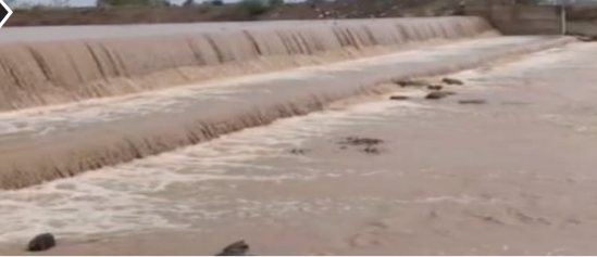
ઉત્પાદન પણ વધશે અને પાકની ગુણવત્તામાં સુધારો જોવા મળશે. પૂરતા પાણીના કારણે સુકારા જેવા રોગોથી પણ પાકને રાહત

નોંધપાત્ર વધારો થવાની શક્યતા વ્યક્ત કરવામાં આવી રહી છે. જેના કારણે આગામી ઉનાળામાં પીવાના પાણીની મુશ્કેલી ઘણી હદ સુધી ઓછી થશે તેવી આશા સેવાઈ રહી છે. ખેડૂતોને સિંચાઈ માટે પૂરતું પાણી ઉપલબ્ધ થતા ખેતીમાં પણ સારો લાભ મળશે. કપાસ, મગફળી જેવા ખરીફ પાક ઉપરાંત ઘઉં, ચણા અને જીરાં જેવા રવિ પાકનું