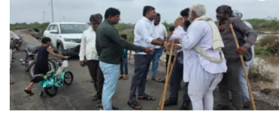
સાથે વાતચીત કરી તેમની મુશ્કેલીઓ સાંભળી હતી તેમજ સંબંધિત અધિકારીઓને રાહત

ઘોબા ગામમાં અતિવૃષ્ટિના કારણે પૂર જેવી સ્થિતિ સર્જતા જનજીવન પ્રભાવિત બન્યું છે. પરિસ્થિતિને ધ્યાનમાં રાખી તાલુકા પંચાયત અને જિલ્લા પંચાયતના સભ્યોએ અસરગ્રસ્ત વિસ્તારની મુલાકાત લીધી હતી અને સ્થળ પર જઈ સ્થિતિની માહિતી મેળવી હતી. ગ્રામજનો