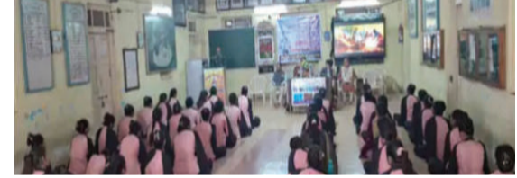
માહિતી આપી હતી. ત્યારબાદ પ્રોજેક્ટરના માધ્યમથી સાયબર કાર્મ અંગે પ્રેઝન્ટેશન રજૂ કરવામાં આવ્યું હતું. કાર્યક્રમમાં સાયબર ફ્રોડ, ડિજિટલ અરેસ્ટ, મોર્ફિંગ સહિતના વિવિધ સાયબર ગુનાઓ વિશે સમજણ આપવામાં આવી હતી. ઉપરાંત ઓનલાઈન ઠગાઈથી કેવી રીતે

અમરેલી, તા.૦૫ સાવરકુંડલા મહિલા અધ્યાપન મંદિર સંચાલિત પી. ટી.સી. કોલેજ ખાતે બેટી બચાઓ બેટી પઢાઓ યોજના અંતર્ગત સાયબર સેફ્ટી અવેરનેસ કાર્યક્રમ યોજાયો હતો. કાર્યક્રમનો મુખ્ય ઉદ્દેશ વિદ્યાર્થીનીઓમાં સાયબર સુરક્ષા અંગે જાગૃતિ લાવવાનો અને ડિજિટલ યુગમાં વધતા સાયબર ગુનાઓથી બચવા માટે જરૂરી માહિતી આપવાનો હતો. અમરેલી જિલ્લા મહિલા અને બાળ અધિકારીએ યોજનાની વિસ્તૃત