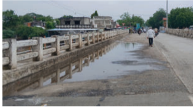
કે નાનું તળાવ બની ગયું હોય તેવા દ્રશ્યો સર્જાય છે. પાણીના નિકાલ માટે બનાવેલા સાઈડના પાઈપોમાં કચરો ભરાઈ જવાથી પાણી બહાર નીકળી શકતું નથી. પરિણામે પસાર થતા વાહનોના કારણે

દામનગરમાં અંદાજે આઠ વર્ષ પહેલા રૂ. દોઢ કરોડના ખર્ચે બનાવવામાં આવેલા નવા પુલ પર વરસાદ પડતા જ પાણી ભરાઈ જવાની સમસ્યા ફરી સામે આવી છે. પુલ પર વરસાદી પાણીનો એટલો ભરાવો થાય છે કે જાણે ચેક ડેમ