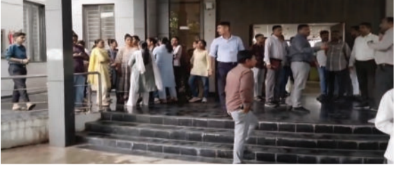
આવી હતી. તાત્કાલિક ડોગ સ્કોવોડ, એસઓજ અને સ્થાનિક પોલીસની ટીમોએ કલેક્ટર કચેરીમાં સઘન સર્ચ ઓપરેશન હાથ ધર્યું હતું. સમગ્ર કચેરી અને આસપાસના વિસ્તારમાં ઝીણવટભરી તપાસ કરવામાં આવી હતી. જોકે લાંબી તપાસ બાદ કોઈ શંકાસ્પદ વસ્તુ કે વિસ્ફોટક સામગ્રી મળી આવી નહોતી. જેના કારણે વહીવટી અને પોલીસ તંત્રએ રાહતનો શ્વાસ લીધો હતો. આ પહેલાં પણ કલેક્ટર કચેરીને બોમ્બથી ઉડાવી દેવાની ધમકી મળી ચૂકી હોવાથી ઘટનાને ગંભીરતાથી લેવામાં આવી છે. હવે આ નનામો પત્ર કોણે મોકલ્યો, તે કયાંથી પોસ્ટ કરવામાં આવ્યો અને તેની પાછળનો હેતુ શું હતો તે અંગે પોલીસે વિવિધ દિશામાં તપાસ શરૂ કરી છે.

પત્રની બાથ થતા ડોગ સ્કોવોડ, સીટી પોલીસ દ્વારા સર્ચ ઓપરેશન, કંઈ ન મળતા હાશકારો