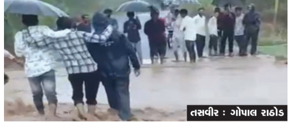
ઘૂસી જતાં લોકોને મુશ્કેલીનો સામનો કરવો પડ્યો હતો. ભારે વરસાદના કારણે શહેરમાં વીજ પુરવઠો પણ ખોરવાયો હતો. ગ્રામ્ય વિસ્તારોમાં પણ સારો વરસાદ વરસતા તળાવો

રાજુલા અને જાકરાબાદ તાલુકામાં શનિવારે મેઘમહેર જોવા મળી હતી. વહેલી સવારથી શરૂ થયેલો વરસાદ બપોરે કડાકા-ભડાકા સાથે ધોધમાર વરસ્યો હતો. રાજુલા શહેરમાં અંદાજે ૪ ઈંચ વરસાદ નોંધાતા અનેક નીચાણવાળા વિસ્તારોમાં પાણી ભરાઈ ગયા હતા. નિશાળવાળો વિસ્તાર, એસટી બસ સ્ટેન્ડ, હવેલી, ચોક, શ્રીજી નગર અને રેનબો વિસ્તારમાં પાણી