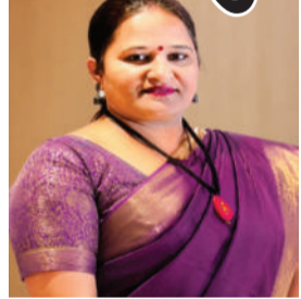
નેતૃત્વ અને શિક્ષણ પ્રત્યેની

પાલીતાણાની સેલ્ફ ફાઈનાન્સ કોલેજ સંચાલક મંડળના પ્રમુખ તરીકે વરણી કરવામાં આવી હતી. આત્મનિર્ભર કોલેજ સંચાલક મંડળના ઈતિહાસમાં પ્રથમ વખત મહિલા શિક્ષણવિદને આ જવાબદારી સોંપવામાં આવી છે. શિક્ષણ ક્ષેત્રે તેમના લાંબા અનુભવ, દૃઢ