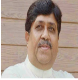
તરફ પ્રોત્સાહિત કરવાનો છે

અમરેલી જિલ્લામાં નવી પહેલ હાથ ધરવામાં આવી છે. પ્રથમ તબક્કામાં જિલ્લાના ૧૦૦ ખેડુતોને પ્રતિ ખેડૂત ૧૦૦ કેસર આંબાની કલમો વિનામૂલ્યે આપવામાં આવશે. આ રીતે કુલ ૧૦ હજાર કલમોનું વિતરણ કરાશે. આ યોજાનાનો મુખ્ય ઉદ્દેશ ખેડુતોને બાગાયતી ખેતી