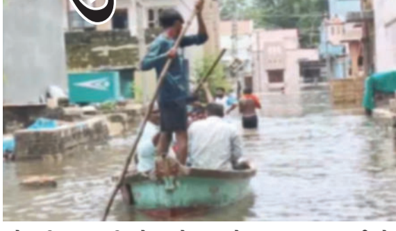
રહેવાની આગાહી છે અને બંદરો પર ઉ નંબરનું સિગ્નલ લગાવી માછીમારોને દરિયો ન ખેડવા સૂચના અપાઈ છે. અમદાવાદમાં અત્યાર સુધી સામાન્ય સરેરાશ કરતાં અંદાજે

શક્તિશાળી સિસ્ટમ એકસાથે સક્રિય હોવાથી વરસાદનું જોર વધશે. આજે દક્ષિણ ગુજરાત અને સૌરાષ્ટ્રના ૧૨ જિલ્લામાં રેડ એલર્ટ જાહેર કરાયું છે જ્યારે આઠ જિલ્લામાં ઓરેન્જ અને છ જિલ્લામાં યલો એલર્ટ આપવામાં આવ્યું છે. ગાજવીજ, વીજળી અને ૪૦થી ૫૦ કિમીની ઝડપે પવન ફૂંકાવાની શક્યતાને કારણે દરિયો અતિ તોફાની