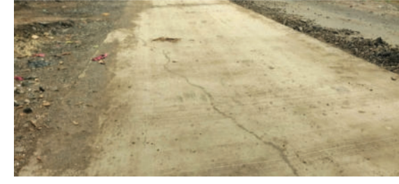
ગામના લોકોએ સ્થળ પર વિરોધ નોંધાવી જવાબદાર અધિકારીઓનું ધ્યાન દોર્યું હતું. ગ્રામજનોએ આરએમબીના અધિકારીઓ સમક્ષ સમગ્ર કામની તટસ્થ તપાસ કરાવી જવાબદારો સામે યોગ્ય કાર્યવાહી કરવાની તેમજ ગુણવત્તાયુક્ત રોડનું કામ કરાવવાની માંગ કરી છે.

અમરેલી, તા.૦૪ અમરેલી તાલુકાના શેડુભાર ગામમાં ચાલી રહેલા રોડના કામને લઈને ભ્રષ્ટાચારની આશંકા વ્યક્ત કરવામાં આવી છે. ગ્રામજનોના જણાવ્યા મુજબ કામ પૂર્ણ થાય તે પહેલાં જ રોડ પર તિરાડો અને ગાબડા પડવા લાગ્યા છે, જેના કારણે કામની ગુણવત્તા સામે સવાલો ઉભા થયા છે. પૂર્વ ઉપસરપંચ અને