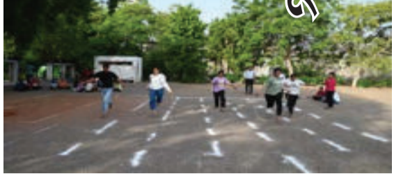
સંયુક્ત ઉપક્રમે ખેલકૂદ સ્પર્ધાનું આયોજન કરવામાં

અમરેલી, તા.૦૩ અમરેલી જીલ્લા લેઉવા પટેલ ચેરીટેબલ ટ્રસ્ટ સુરત સંચાલિત કે.પી. ધોળક્રીયા ઈનફોટેક મહિલા કોલેજ, બી.બી.એ. મહિલા કોલેજ તેમજ કાબરીયા આર્ટસ, વધાસિયા કોમર્સ અને ભગત સાયન્સ મહિલા કોલેજના