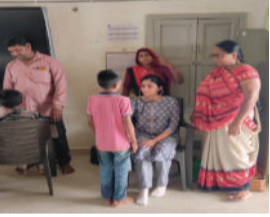
વડેરા અને વડેરા પ્રાથમિક શાળામાં ધોરણ ૫ અને ૧૦ માં અભ્યાસ કરતા વિદ્યાર્થીઓને ટીડી (ધનુર અને ડિસ્થેરિયા) ની રસી આપવામાં આવી હતી. આ રસીકરણ કાર્યક્રમને સફળ બનાવવા માટે અમરેલી આર.બી.એસ.કે. ટીમ અને વડેરા