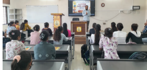
સંત કબીરદાસજીની જન્મ જયંતિ નિમિત્તે “કબીર જયંતિ મહોત્સવ”નું ભવ્ય આયોજન