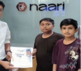
સંદેશો અને ચિત્રો ભેટ આપી ડોક્ટરોની નિઃસ્વાર્થ સેવાપ્રત્યે કૃતજ્ઞતા વ્યક્ત કરી હતી. આ પ્રસંગે વિદ્યાર્થીઓ અને ડોક્ટરો વચ્ચે પ્રેરણાદાયી સંવાદ પણ યોજાયો હતો. શાળાના બાબરીયા અને કિલનિકોમાં જોડાયા હતા. આચાર્ય રીનાબા ધાધલે જણાવ્યું હતું કે આવા કાર્યક્રમોથી બાળકોમાં

અમરેલી, તા.૦૩ ભારત રત્ન ડૉ. બી.સી. રોયની સ્મૃતિમાં ઉજવાતા રાષ્ટ્રીય ડોક્ટર્સ ડે નિમિત્તે ડૉ. કલામ ઈનોવેટિવ સ્કૂલ, અમરેલીના વિદ્યાર્થીઓએ શહેરના વિવિધ ડોક્ટરોની રૂબરૂ મુલાકાત લઈ “સ્વાસ્થ્ય સૈનિક સન્માન” અર્પણ કર્યું હતું. વિદ્યાર્થીઓએ પોતાના હાથે તૈયાર કરેલા સન્માનપત્રો, શુભેચ્છા