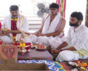
પરિવાર સાથે યજ્ઞમાં તરીકે જોડાયા હતા. બ્રાહ્મણો દ્વારા વેદોક્ત અને શાસ્ત્રોક્ત વિધી મુજબ સમગ્ર પાટોત્સવ સંપન્ન