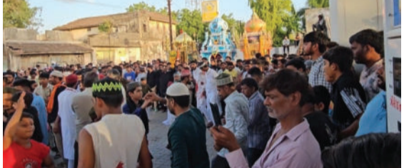
જુલૂસ જયારે વડિયાની મુખ્ય બજારમાંથી પસાર થયું, ત્યારે હિન્દુ ધર્મના લોકો પણ તેમાં શ્રદ્ધાપૂર્વક જોડાયા હતા. ગાંધી ચોક સ્થિત રામજી મંદિર પાસે સ્થાનિક હિન્દુ યુવાનોએ જુલૂસમાં સામેલ લોકો માટે આઈસ્ક્રીમનું વિતરણ કરીને હિન્દુ-મુસ્લિમ એકતાનું પ્રેરણાદાયી ઉદાહરણ પૂરું પાડ્યું હતું. સમગ્ર તહેવાર શાંતિપૂર્ણ રીતે સંપન્ન થાય તે માટે વડિયા પોલીસે ચુસ્ત બંદોબસ્ત જાળવ્યો હતો.

વડિયા, તા. ૨૭ વડિયામાં મુસ્લિમ સમાજ દ્વારા પવિત્ર મોહરમ પર્વની ઉત્સાહભેર ઉજવણી કરવામાં આવી હતી. હઝરત ઈમામ હુસેનની શહાદતની યાદમાં વિવિધ કમિટીઓ દ્વારા થર્મોકોલ અને અન્ય સામગ્રીમાંથી કલાત્મક તાજીયા તેમજ મકબરા તૈયાર કરાયા હતા, જે લોકોમાં ભારે આકર્ષણનું કેન્દ્ર બન્યા હતા. હજરત પીરની દરગાહથી શરૂ થયેલું તાજીયાનું ભવ્ય