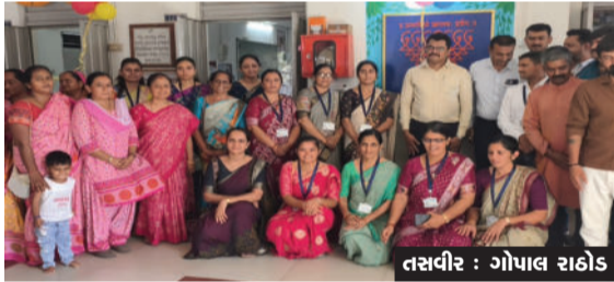
વિદ્યાર્થીઓનું સન્માન કરવામાં આવ્યું હતું. ઉપરાંત બાલવાટિકાના અંદાજે ૫૦ જેટલા બાળકો તથા ધોરણ-૧માં નવા પ્રવેશ મેળવનાર વિદ્યાર્થીઓનું સ્વાગત કરવામાં આવ્યું હતું. આંગણવાડીના બાળકો પણ કાર્યક્રમમાં ઉત્સાહપૂર્વક જોડાયા હતા. અધિકારીઓએ

રાજુલા તાલુકાના હિંડોરણા ગામની પ્રાથમિક શાળામાં શાળા પ્રવેશોત્સવની ઉજવણી કરવામાં આવી હતી. આ કાર્યક્રમમાં અનેક મહાનુભાવો, શ્રામજનો અને વાલીઓ ઉત્સાહભરે ઉપસ્થિત રહ્યા હતા. આ પ્રસંગે શૈક્ષણિક, સાંસ્કૃતિક તેમજ સહૈયગી પ્રવૃત્તિઓમાં ઉત્કૃષ્ટ પ્રદર્શન કરનાર હોશિયાર