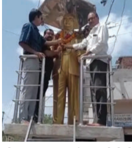
જોડાયા હતા. ઉપસ્થિત લોકોએ

અમરેલી, તા. ૨૭ ધારી શહેરમાં ધારી પત્રકાર સંઘ દ્વારા મિશન બ્રોડગેજ અભિયાન અંતર્ગત વિશેષ કાર્યક્રમનું આયોજન કરવામાં આવ્યું હતું. શહેરમાં આવેલા વિવિધ મહાનુભાવોની પ્રતિમાઓની સ્વચ્છતા કરીને કરવામાં આવી હતી. ત્યારબાદ