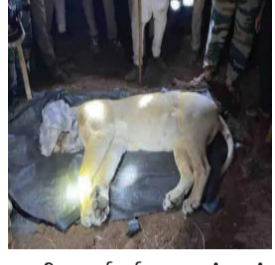
જરૂરી માર્ગદર્શન આપ્યું હતું. બાળકના મોતની રાતથી જ ખાંભા