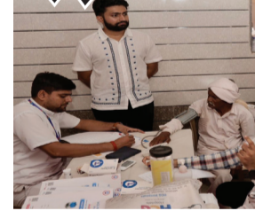
નિષ્ણાટ ટીમે આશરે ૧૫૦ દર્દીઓનું નિઃશુલ્ક સ્ક્રિનિંગ કરી સચોટ સારવાર અને માર્ગદર્શન