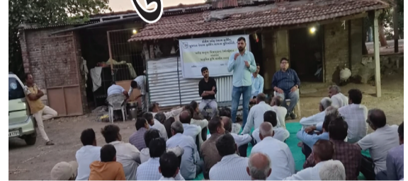
ઉત્સાહપૂર્વક ભાગ લીધો હતો. કાર્યક્રમ દરમિયાન કૃષિ નિષ્ણાતોએ મિશ્રપાક પદ્ધતિ અંગે પ્રાથમિક માર્ગદર્શન આપ્યું હતું. એક જ ખેતરમાં વિવિધ પાકોનું વૈજ્ઞાનિક

અમરેલી, તા. ૨૬ અમરેલી સ્થિત કોલેજ ઓફ નેચરલ ફાર્મિંગ દ્વારા મોટા મુંજીયાસર ગામે ખરીફ ઋતુના પાક નિદર્શન તથા જીવામૃત-બીજામૃતના લાઈવ ડેમો-સ્ટ્રેશન સાથે પ્રાકૃતિક કૃષિ તાલીમ શિબિરનું આયોજન કરવામાં આવ્યું હતું. શિબિરમાં ૫૦થી વધુ પ્રગતિશીલ ખેડૂતોએ