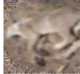
અધિકારીઓના જણાવ્યા મુજબ સિંહના મોતનું ચોક્કસ કારણ પોસ્ટમોર્ટમ રિપોર્ટ આવ્યા બાદ જ સ્પષ્ટ થશે.

અમરેલી જિલ્લાના દલખાણીયા રેન્જમાં એક સિંહનો મૃતદેહ શંકાસ્પદ હાલતમાં મળતા વન વિભાગમાં દોડધામ મચી ગઈ હતી. દલખાણીયા ગામ નજીક રેવન્યુ વિસ્તારમાંથી મૃતદેહ મળી આવતા વન વિભાગની ટીમે તેને કબજે લઈ પોસ્ટમોર્ટમ માટે એનિમલ કેર સેન્ટર ખાતે ખસેડ્યું હતો.