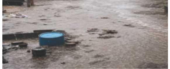
જેટલો વરસાદ ખાબકતો ગામના મુખ્ય માર્ગો પાણીમાં ગરકાવ થઈ ગયા હતા અને રસ્તાઓ નદી જેવા ભાસતા હતા. ઊંચડી ઉપરાંત

અમદાવાદ જિલ્લામાં લાંબા વિરામ બાદ મેઘરાજાએ ધમાકેદાર પુનઃ પધરામણી કરી છે. જિલ્લાના ધંધુકા તાલુકા અને તેની આસપાસના ગ્રામ્ય વિસ્તારોમાં અચાનક વાતાવરણમાં પલટો આવ્યો હતો અને ભારે પવન તથા જાગ્રવીજ સાથે ધોધમાર વરસાદ તૂટી પડ્યો હતો. ધંધુકાના ઊંચડી વિસ્તારમાં માત્ર થોડા જ સમયમાં અંદાજે ૧.૫ ઈંચ