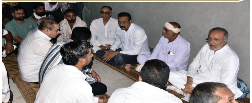
ખાંભા તાલુકાના ચતુરી ગામમાં વનપ્રાણીના આકસ્મિક હુમલામાં એક માસૂમ બાળકનું કરુણ મોત થતાં સમગ્ર વિસ્તારમાં શોકની લાગણી ફેલાઈ છે. સાંજના સમયે બાળક પોતાના દાદા સાથે હાથ પકડીને ગામની દૂધ ડેરી તરફ જઈ રહ્યો હતો ત્યારે અચાનક વનપ્રાણીએ હુમલો કર્યો હતો. ગંભીર ઈજાઓના કારણે બાળકનું ઘટનાસ્થળે જ મોત નીપજ્યું હતું. ઘટનાની જાણ થતાં ગ્રામજનોમાં ભયનો માહોલ સર્જાયો હતો. આ દુઃખદ ઘટનાને પગલે વન અને પર્યાવરણ મંત્રી અર્જુનભાઈ મોઠવાડિયા ચતુરી ગામે પહોંચ્યા હતા. તેમણે પીડિત પરિવારને મળીને સાંત્વના પાઠવી અને ઊંડી સંવેદના વ્યક્ત કરી હતી.