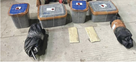
લાખ કિલોગ્રામથી વધુનો