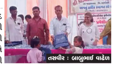
તાલુકાના કડીયાળી ગામે કન્યા કેળવણી મહોત્સવ અને પ્રવેશોત્સવની ઉજવણી કરવામાં આવી હતી.

અમરેલી, તા. ૨૬ જાફરાબાદ તાલુકાના કડીયાળી ગામે કન્યા કેળવણી મહોત્સવ અને પ્રવેશોત્સવની ઉજવણી કરવામાં આવી હતી. મુખ્ય અતિથિ રહ્યા હતા. દીપ કાર્યક્રમમાં ગાંધીનગરના વુમન વેલ્ફેર ડિરેક્ટર તથા ગુજરાત વુમન ઇકોનોમિક ડેવલપમેન્ટ કોર્પોરેશનના મેનેજિંગ ડિરેક્ટર IAS પુષ્પાબેન નીનામા પ્રારંભ થયો હતો. પ્રસંગે તાલુકાના અધિકારીઓ, ગ્રામ પંચાયતના આગેવાનો અને સામાજિક કાર્યકરો ઉપસ્થિત રહ્યા હતા.