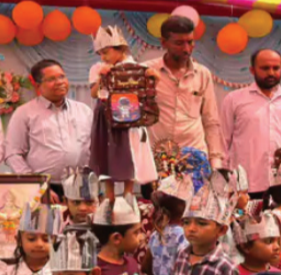
અર્પણ કરવામાં આવી. કાર્યક્રમ દરમિયાન દીકરીઓના શિક્ષણ, તેમના સર્વાંગી વિકાસ અને ગુણવત્તાસભર શિક્ષણના મહત્વ પર ભાર મૂકવામાં આવ્યો.

સાવરકુંડલા તાલુકાના દોલતી ગામે કન્યા કેળવણી મહોત્સવ અને શાળા પ્રવેશોત્સવની ઉજવણી કરવામાં આવી. આ કાર્યક્રમમાં આંગણવાડી, આરોપીને ઠપકો આપવા ગઈ ત્યારે આરોપીએ તેની છેડતી કરી, મૂઠમાર મારીને જેમ ફાવે તેમ ગાળો દીધી હતી. તેમજ મહિલા અને તેના દીકરાઓને જાનથી મારી નાખવાની ડરલ પોલીસ સ્ટેશનના પી.એસ. આઈ. એન. એસ. મુસાર આ અંગે વધુ તપાસ ચલાવી રહ્યા છે.