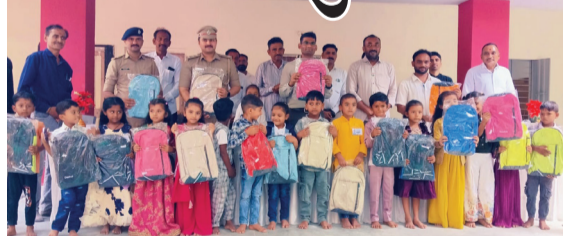
કીટ આપીને સ્વાગત કરવામાં આવેલ. આ પ્રસંગે પોલીસ વડાએ જણાવ્યું હતું કે, મહાનુભવો દ્વારા વૃક્ષારોપણ કરવામાં આવેલ હતું.