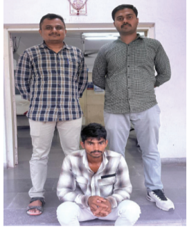
દ્વારા આ દરખાસ્ત મંજૂર