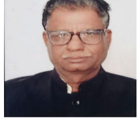
એક મહત્વપૂર્ણ ચુકાદો આપવામાં આવ્યો છે. અમરેલી જિલ્લાના બગસરા સ્થિત સરદાર પટેલ શરાફી સહકારી મંડળીમાંથી નવા

બગસરા, તા.૨૬ ચેક બાઉન્સના કેસોમાં અદાલતો દ્વારા કડક વલણ અપનાવવામાં આવી રહ્યું છે, જે અંતર્ગત બગસરા કોર્ટ દ્વારા નાણાકીય અનિયમિતતા બદલ