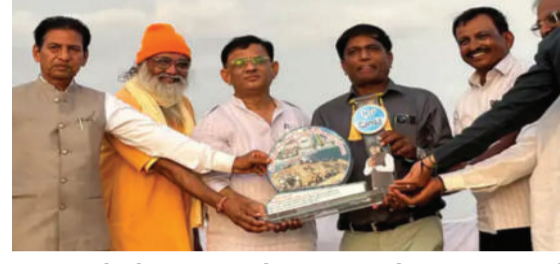
રહ્યા હતા. તેમણે જળસંચય અને ગ્રામ વિકાસ માટે કાર્યરત તમામ યોગદાનકર્તાઓને અભિનંદન

અમરેલી, તા. ૨૨ પૂજાપાદર ગામે સરકાર, દાતાઓ અને ગ્રામજનોના સહયોગથી નિર્માણાધીન તળાવના કાર્યમાં મહત્વપૂર્ણ યોગદાન આપનાર સહયોગીઓ, ઓપરેટરો અને કર્મચારીઓના સન્માન માટે વિશેષ કાર્યક્રમનું આયોજન કરવામાં આવ્યું હતું. આ પ્રસંગે ધારાસભ્ય મહેશ કસવાળા ઉપસ્થિત