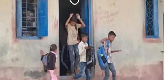
ઉલ્લંઘન બદલ ગીર સોમનાથ જિલ્લા પ્રાથમિક શિક્ષણાધિકારીએ અગાઉ રૂ. ૧૦,૦૦૦ અને ત્યારબાદ ૧૧ જૂન ૨૦૨૬ના રોજ રૂ. ૨૫,૦૦૦નો ભીજો દંડ ફટકાર્યો હતો. તંત્ર દ્વારા શૈક્ષણિક

ડીના, તા.૨૧ ડીના તાલુકાના નવાબંદર ગામે આવેલી ખાનગી નારાયણ પ્રાથમિક શાળા જરૂરી સુવિધાઓ અને ફાયર NOC વિના ધમધમતી રહી છે. ૮ મીટરથી વધુ ઊંચાઈ ધરાવતા આ G+2 બિલ્ડિંગમાં પીવાનું પાણી, મેદાન, સેનિટેશન જેવી પ્રાથમિક સુવિધાઓનો અભાવ છે અને ઓરડાની સાઈઝ પણ નિયમ કરતાં નાની છે. નિયમોના સરેઆમ