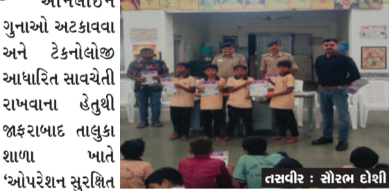
સાયબર શક્તિ' અંતર્ગત ભવ્ય જનજાગૃતિ કાર્યક્રમ યોજાયો હતો. જેમાં ઉપસ્થિત વિદ્યાર્થીઓ

જાફરાબાદ, તા.૨૧ ઓનલાઈન ગુનાઓ અટકાવવા અને ટેકનોલોજી આધારિત સાયબેટી વાતાવરણના નિર્માણ માટે મહિલાઓ અને બાળકોમાં જાગૃતિ લાવવાના વિશેષ પ્રયાસો હાથ ધરવામાં આવ્યા છે.