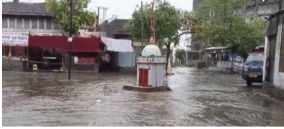
શહેરના મુખ્ય માર્ગો પાણી-પાણી થઈ ગયા હતા અને સમગ્ર પંથકના વાતાવરણમાં અચાનક

સાવરકુંડલા, તા. ૨૧ સાવરકુંડલા શહેર અને આસપાસના ગ્રામ્ય વિસ્તારોમાં સમી સાંજે અચાનક વાતાવરણમાં પલટો આવ્યો હતો. દિવસભરના અસહ્ય ઉકળાટ અને ગરમી બાદ ભારે પવનના સુસવાટા સાથે તોફાની વરસાદનું આગમન થયું હતું. પવન સાથે શરૂ થયેલા જોરદાર વરસાદી ઝાપટોને કારણે