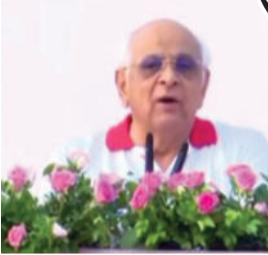
જીવનશૈલીનો ભાગ બનવો જોઈએ. રાજ્યભરમાં આશરે સવા કરોડથી વધુ લોકોએ

ગાંધીનગર, તા.૨૧ ગાંધીનગરના માણસા ખાતે મુખ્યમંત્રી ભૂપેન્દ્ર પટેલની પ્રેરક ઉપસ્થિતિમાં ૧૨મા વિશ્વ યોગ દિવસની રાજ્ય કક્ષાની ભવ્ય ઉજવણી કરવામાં આવી હતી. આ પ્રસંગે મુખ્યમંત્રીએ નાગરિકોને આહ્વાન કર્યું હતું કે, યોગ માત્ર એક દિવસ પૂરતો સીમિત ન રહેતાં આપણી રોજિંદી