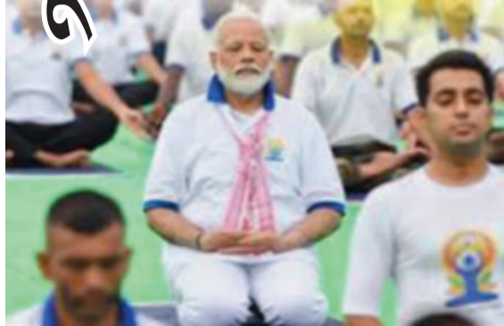
ઉંમરે ૩૦ વર્ષની સરખામણીએ વધુ ઊર્જાવાન બનીએ," એમ તેમણે ઉમેર્યું હતું. આંતરરાષ્ટ્રીય યોગ

તેમણે સ્વસ્થ વૃદ્ધત્વ પર ભાર મૂકતાં કહ્યું કે ઉંમર વધે તેમ માનવીની ક્ષમતા ઘટતી જોઈએ નહીં. "આમારું લક્ષ્ય એ હોવું જોઈએ કે ૪૦ વર્ષની ઉંમરે ૨૦ વર્ષની સરખામણીએ વધુ લવચીક અને ૫૦ વર્ષની