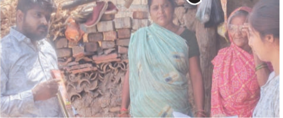
આયુષ્માન આરોગ્ય કેન્દ્ર ખાતે સઘન સર્વેલન્સ હાથ ધરાવ્યું હતું. કાર્યક્રમ દરમિયાન ગ્રામજનોને રક્તપિત્તના લક્ષણો, જેમ કે ચામડી પર સંવેદના વગરના ડાઘા અને હાથ-પગમાં સુનકાર વિશે માર્ગદર્શન અપાયું હતું.