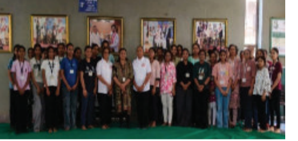
ઉપસ્થિતોને યોગના મહત્વ અને આરોગ્યલક્ષી લાભો અંગે માર્ગદર્શન આપી સૂર્યનમસ્કાર,