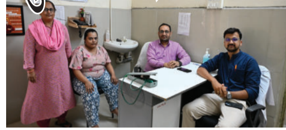
જગ્યાએ મોંઘી સારવાર છતાં સુધારો ન થતાં પરિવાર આ હોસ્પિટલમાં આવ્યો હતો. તપાસ બાદ દર્દીને

અમરેલી, તા. ૨૧ અમરેલીની શાંતાબા જનરલ હોસ્પિટલ ખાતે ભાવનગરની ૨૩ વર્ષીય યુવતીની ગંભીર માનસિક બીમારી 'સ્કિઝોફ્રેનિયા'ની સફળ અને નિ:શુલ્ક સારવાર કરવામાં આવી છે. આ દર્દી છેલ્લા ૬ વર્ષથી ઊંચ ન આવવી, ભણકારા સંભળવા, શંકા-વહેમ અને અસામાન્ય વર્તન જેવી તકલીફોથી પીડાતી હતી. અન્ય