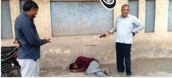
ભારે નશો કરીને ખુદ પોલીસ મથકની દીવાલનો સહારો લઈને ત્યાં જ સૂઈ ગયો હતો. આ આખી ઘટના સ્થાનિક લોકોમાં

બગસરા, તા.૨૧ શહેરમાં અસામાજિક તત્વો અને દારૂડિયાઓનો ત્રાસ અસહ્ય સપાટીએ પહોંચ્યો છે. સ્થાનિક પોલીસની નિષ્ક્રિયતાના કારણે નશાખોરો બેફામ બન્યા છે, જેનો જીવતો જાગતો પુરાવો તાજેતરમાં બગસરા પોલીસ સ્ટેશનની દીવાલ પાસે જ જોવા મળ્યો હતો. કાયદાનો જરાય ડર રાખ્યા વિના એક દારૂડિયો