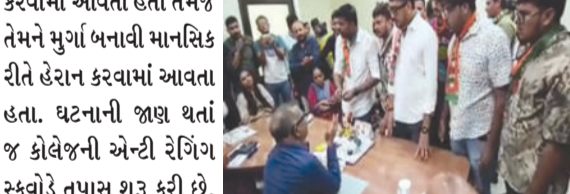
કરવામાં આવતી હતી તેમજ તેમને મુર્ગા બનાવી માનસિક રીતે હેરાન કરવામાં આવતા હતા. ઘટનાની જાણ થતાં જ કોલેજની એન્ટી રેગિંગ સ્કવોડે તપાસ શરૂ કરી છે. ફરિયાદી તથા આરોપી વિદ્યાર્થીઓના નિવેદનો લેવામાં આવ્યા છે અને સમગ્ર ઘટનાની વિગતવાર તપાસ હાથ ધરવામાં આવી રહી છે. એન્ટી રેગિંગ કમિટી દ્વારા તપાસ પૂર્ણ થયા

ભાવનગર, તા. ૧૮ અમદાવાદની બી.જે. મેડિકલ કોલેજ બાદ હવે ભાવનગરની સરકારી મેડિકલ કોલેજમાં પણ રેગિંગનો મામલો સામે આવ્યો છે. ઓર્થોપેડિક વિભાગના પ્રથમ વર્ષના ૧૩ વિદ્યાર્થીઓએ ૬ સિનિયર વિદ્યાર્થીઓ સામે રેગિંગની ફરિયાદ નોંધાવી છે. ફરિયાદ અનુસાર સિનિયર વિદ્યાર્થીઓ દ્વારા જુનિયર વિદ્યાર્થીઓ પાસે પૈસાની માંગણી