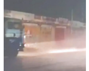
૬૩ તાલુકાઓમાં મેઘમહેર થઈ છે. જેમાં મહીસાગર જિલ્લાના બાલાસિનોરમાં સૌથી વધુ ૧૪૭ મિલિમીટર (૫.૭૯ ઈંચ)

મહીસાગર, તા. ૧૮ ગુજરાતમાં સત્તાવાર ચોમાસાની હજી રાહ જોવાઈ રહી છે, પરંતુ તે પૂર્વે જ રાજ્યમાં પ્રિ-મોન્સૂન એકિટિવિટી જોરશોરથી શરૂ થઈ ગઈ છે. છેલ્લા ૨૪ કલાકમાં ઉત્તર અને મધ્ય ગુજરાતના વિવિધ જિલ્લાઓમાં ભારેથી મધ્યમ વરસાદ નોંધાયો છે. સ્ટેટ ઈમરજન્સી ઓપરેશન સેન્ટરના આંકડા મુજબ, રાજ્યના