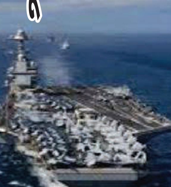
અમેરિકન નૌકાદળના સૌથી મોટા અને અદ્યતન યુદ્ધ જહાજ USS ગેરાર્ડ આર. ફોર્ડ તાજેતરમાં ૩૨૬ દિવસનું ઐતિહાસિક મિશન પૂર્ણ કર્યું છે.

અમેરિકાના નૌકાદળના સૌથી મોટા અને અદ્યતન યુદ્ધ જહાજ USS ગેરાર્ડ આર. ફોર્ડ તાજેતરમાં ૩૨૬ દિવસનું ઐતિહાસિક મિશન પૂર્ણ કર્યું છે, પરંતુ તેની સાથે એક શરમજનક હકીકત પણ સામે આવી છે કે આ $૧૩ બિલિયનનું સુપરકેરિયર અમેરિકન નૌકાદળના સૌથી અદ્યતન F-35C સ્ટીલ્થ ફાઈટર જેટને ઉડાડવા માટે સંપૂર્ણપણે અસમર્થ છે. આ સમસ્યા એટલી ગંભીર છે કે જો આ જહાજ પર F-35C ઉડાડવામાં આવે તો તે જહાજના ડેકને ગંભીર નુકસાન પહોંચાડી શકે છે, જે આધુનિક યુદ્ધ જહાજોની ડિઝાઈન અને આયોજનમાં ગંભીર ખામીઓ તરફ ઈશારો કરે છે. આ સમસ્યાનું સૌથી મોટું કારણ F-35C ના એજિન દ્વારા ઉત્પન્ન થતી અત્યંત ગરમી છે. F-35Cનું એજિન લગભગ ૩૬૦૦ ડિગ્રી ફેરનહીટ જેટલું તાપમાન ઉત્પન્ન કરે છે, જે હાલમાં ફોર્ડ પર ઉડાડવામાં આવતા F/A-18 સુપર હોર્નેટ કરતાં ઘણું વધારે છે. જહાજના ડેક પર લગાવવામાં આવેલા જેટ બ્લાસ્ટ ડિફેલ્ટર અને આસપાસની સપાટીઓ આટલી ઊંચી ગરમીનો સતત સામનો કરવા માટે ડિઝાઈન કરવામાં આવી નથી, જેના કારણે અમેરિકન નૌકાદળને ભય છે કે વર્તમાન સ્થિતિમાં F-35C ઉડાડવાથી જહાજના ડેકને કાયમી નુકસાન થઈ શકે છે. આ માત્ર ડેકની સમસ્યા નથી, પરંતુ F-35C એક સ્ટીલ્થ એરક્રાફ્ટ હોવાને કારણે તેના જાળવણી માટે વિશિષ્ટ સુવિધાઓની પણ જરૂર છે. આમાં તેના સ્ટીલ્થ કોઈંગને સુધારવા માટે વિશિષ્ટ વર્કશોપ, સંવેદનશીલ ઈલેક્ટ્રોનિક સિસ્ટમ્સ માટે સુરક્ષિત રૂમ અને ODIN નામનું ડિજિટલ ડાયગ્નોસ્ટિક નેટવર્ક સામેલ છે. કમનસીબે, આમાંની ઘણી સિસ્ટમો હજુ ફોર્ડ પર સંપૂર્ણ રીતે કાર્યરત નથી, જે આ જહાજને F-35C માટે અયોગ્ય બનાવે છે. આ સમસ્યાનું મૂળ ૨૦૦૫ની આસપાસનું છે, જ્યારે ફોર્ડની ડિઝાઈનને અંતિમ સ્વરૂપ આપવામાં આવ્યું હતું. તે સમયે, F-35C માટેનાં અંતિમ