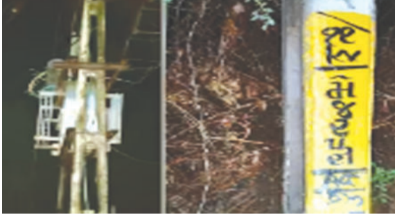
અચાનક તેમના પર ચાલુ વીજ પડ્યો હતો. લાઈનનો જીવંત વાયર તૂટી વીજ કરંટ એટલો જોરદાર

પાલનપુર, તા. ૧૮ ગુજરાતમાં શરૂ થયેલી પ્રિ-મોન્સૂન એકિટિવિટી વચ્ચે બનાસકાંઠાના વડગામ તાલુકાના સકલાણા ગામમાં એક અત્યંત કરૂણ ઘટના સામે આવી છે. બુધવારે રાત્રે વરસાદી માહોલ દરમિયાન એક પિતા અને પુત્ર પોતાના ટુ-વ્હીલર પર સવાર થઈને ખેતરે જઈ રહ્યા હતા. તે જ સમયે