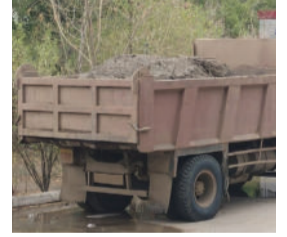
ઝડપી પાડ્યા હતા. અંદાજિત કિંમત રૂ. ૩.૪૦ લાખ, સાથે આશરે ૩૦ ટન રેતીનો જથ્થો જપ્ત કરવામાં આવ્યો હતો. બીજી તરફ, શેત્રુંજી નદીમાં લાંબા સમયથી ચાલતી રેતી ચોરી અંગે જવાબદાર ખાણ-ખનીજ વિભાગ અને અન્ય સંબંધિત તંત્રની કામગીરી સામે પણ લોકોમાં અનેક પ્રશ્નો ઉઠી રહ્યા છે.

વખત રજૂઆતો કરીને રેતી ચોરી બંધ કરાવવાની માંગ કરવામાં આવી હતી, છતાં કોઈ અસરકારક પરિણામ મળ્યું ન હોવાનું જણાવાય છે. આ દરમિયાન લીલીયાના મામલતદારે વહેલી સવારે પૂજાપાઠર નજીક મામાદેવ મંદિર ચોકની વિસ્તારમાં દરોડો પાડી રેતી ભરેલા બે ડમ્પર