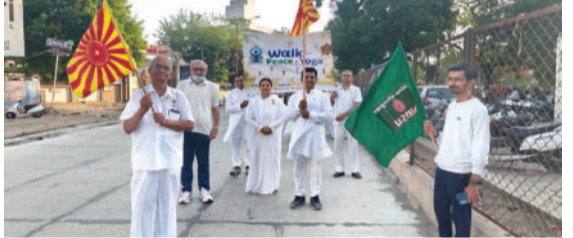
ઝંડી બતાવી પ્રસ્થાન કરાવ્યું હતું. તેમણે યોગને જીવનની અમૂલ્ય સંપત્તિ ગણાવી તેના વ્યાપક પ્રસાર માટે પ્રેરણા આપી હતી. આ રેલી