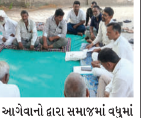
આગેવાનો દ્વારા સમાજમાં વધુમાં વધુ લોકોની ભાગીદારી વધારવા ચર્ચા કરાય હતી અને સૌએ મહોત્સવને ઐતિહાસિક બનાવવા પ્રતિબદ્ધતા વ્યક્ત કર્યું હતું.

બાબરા, તા. ૧૮ બાબરા ખાતે ૧૬ જુલાઈ ૨૦૨૬ના રોજ ઉજવાતી વેલનાથ બાપુની જન્મજયંતિ ભવ્ય બનાવવા માટે યુવાળીયા ઠાકોર સમાજ તથા વેલનાથ પ્રગતિ મંડળની બેઠક યોજાય હતી. કાર્યક્રમમાં ધાર્મિક અને સામાજિક કાર્યક્રમોની રૂપરેખા ઘડવામાં આવી.