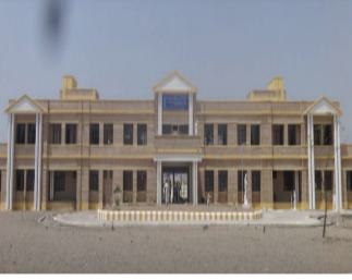
ઈચ્છુક વિદ્યાર્થીઓ વેબસાઈટ ખોલી જરૂરી દસ્તાવેજો સાથે જવાહર નવોદય વિદ્યાલય અમરેલીના કાર્યાલયમાં જમા કરાવવા અનુરોધ કરાયો છે.

અમરેલીના બાબાપુર નજીક આવેલા જવાહર નવોદય વિદ્યાલયમાં ધો. ૧૧ની ખાલી બેઠકો પર પ્રવેશ માટે ઈચ્છુક અને પાત્ર વિદ્યાર્થીઓ પાસેથી અરજીઓ મંગાવવામાં આવે છે. વેશ ધો. ૧૦ની બોર્ડ પરીક્ષાના પરિણામની મેરિટના આધારે આપવામાં આવશે.