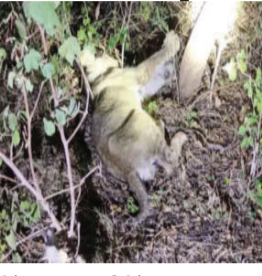
સિંહબાળનું ફેન્સિંગના તારમાં ફસાઈ જવાથી કરુણ મોત નીપજ્યું હતું. માહિતી મુજબ, સિંહબાળ

અમરેલી જિલ્લામાં સિંહો સહિતના વન્યપ્રાણીઓની સંખ્યામાં સતત વધારો થતાં તેઓ હવે જંગલ વિસ્તાર છોડીને માનવ વસવાટ અને ખેતીવાડી વિસ્તારો તરફ આવવા લાગ્યા છે. આવી સ્થિતિમાં સાવરકુંડલા તાલુકાના મેરિયાણા ગામ નજીક આવેલી એક વાડીમાં આશરે છ માસના