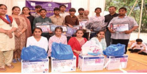
વધુમાં વધુ પ્રમાણમાં મેળવે એ હતો. આ અનુસંધાને સંસ્થાના શિક્ષકો દ્વારા વેકેશનમાં દિવ્યાંગ

અમરેલી, તા. ૧૭ અમરેલી મૂકબધિર સેવા ટ્રસ્ટ સંચાલિત બહેરાં મૂંગા શાળાના ટ્રસ્ટીઓ અને વ્યવસ્થાપક સમિતિના સભ્યોની એક બેઠક તારીખ ૧૧/૦૬/૨૦૨૬ના રોજ મળી હતી. આ બેઠકનો મુખ્ય હેતુ નવા વર્ષના વિવિધ આયોજનો અને સમગ્ર અમરેલી જિલ્લાના દિવ્યાંગો સંસ્થાની સેવાકીય પ્રવૃત્તિનો લાભ