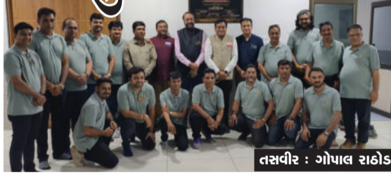
લીધો હોવાનું જાણવા મળ્યું હતું. હોસ્પિટલની આરોગ્ય સેવાઓને વધુ મજબૂત બનાવવા માટે અમરેલી ગીર રોટરી ક્લબ દ્વારા રૂ. ૬૭.૭૮ લાખના અન્યાધુનિક તબીબી સાધનો ભેટરૂપે આપવામાં આવ્યા હતા. આ પ્રસંગે

રાજુલા, તા. ૧૭ રાજુલા શહેરમાં પૂજ્ય મોરારી બાપુના આશીર્વાદથી શરૂ થયેલું નિ:શુલક મહાત્મા ગાંધી આરોગ્ય મંદિર ટૂંકા સમયમાં જ સમગ્ર વિસ્તારના દર્દીઓ માટે આશીર્વાદરૂપ સાબિત થયું છે. માત્ર એક મહિનાના ગાળામાં અંદાજે ૧૪ હજારથી વધુ દર્દીઓએ અહીં સારવારનો લાભ