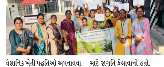
વૈજ્ઞાનિક ખેતી પદ્ધતિઓ અપનાવવા માટે જાગૃતિ ફેલાવવાનો હતો.