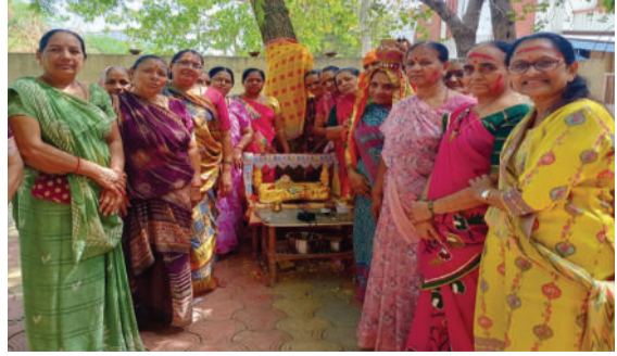
ભગવાનના આશીર્વાદથી પવિત્ર માસ સુખરૂપે અને નિર્વિઘ્ને પૂર્ણ થયો હતો. તમામ બહેનોએ હળીમળીને ભક્તિ અને આનંદનો અનોખો માહોલ સર્જ્યો હતો.

અમરેલી, તા. ૧૭ લીલીયામાં કુલ બાર સ્થળોએ કાંઠાગોરમાની સ્થાપના કરવામાં આવી હતી. તેમાં રાજેશ્વર મહાદેવ મંદિરે સૌથી વધુ સંખ્યામાં બહેનોએ શ્રદ્ધાભાવ સાથે ભાગ લીધો હતો. સમગ્ર પુરુષોત્તમ માસ દરમિયાન ધાર્મિક કાર્યક્રમો, ભજન-કીર્તન અને પૂજા-અર્ચનાનું આયોજન કરવામાં આવ્યું હતું. પુરુષોત્તમ