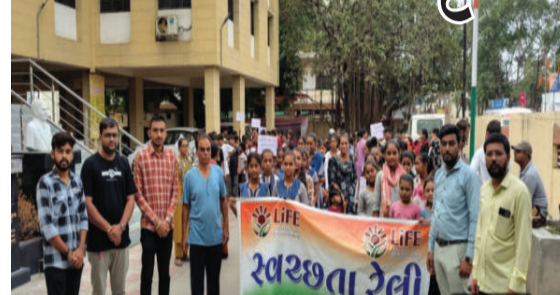
અધિકારીઓ અને કમચારીઓ મોટી સંખ્યામાં ઉત્સાહભરે જોડાયા હતા. રેલી દરમિયાન વિદ્યાર્થીઓએ સ્વચ્છતા, પ્લાસ્ટિકનો ઉપયોગ ઘટાડવા, પર્યાવરણ સંરક્ષણ અને કચરાના યોગ્ય નિકાલ અંગેના સૂતોચ્ચારો સાથે શહેરના મુખ્ય માર્ગો પર ભ્રમણ કર્યું હતું.

અધિકારીઓ અને કમચારીઓ મોટી સંખ્યામાં ઉત્સાહભરે જોડાયા હતા. રેલી દરમિયાન વિદ્યાર્થીઓએ સ્વચ્છતા, પ્લાસ્ટિકનો ઉપયોગ ઘટાડવા, પર્યાવરણ સંરક્ષણ અને કચરાના યોગ્ય નિકાલ અંગેના સૂતોચ્ચારો સાથે શહેરના મુખ્ય માર્ગો પર ભ્રમણ કર્યું હતું. આ કાર્યક્રમ દ્વારા નાગરિકોને સિંગલ યુઝ પ્લાસ્ટિકનો ત્યાગ કરવા, જાહેર સ્થળોએ કચરો ન ફેંકવા અને હરિત શહેરના નિર્માણમાં સહભાગી બનવા અપીલ કરવામાં આવી હતી.