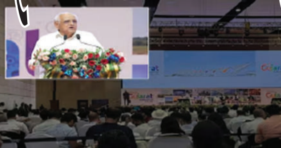
જમીન, વીજળી અને પાણીની સુવિધા ધરાવતું 'ક્લગ-એન્ડ-પ્લે' ઈન્ફ્રાસ્ટ્રક્ચર ઉપલબ્ધ કરાવાશે.

વુમન હોસ્ટેલ અને લેબર હોસ્ટેલના બાંધકામ માટે રૂ. ૪૦ કરોડ સુધીના ખર્ચના ૪૦% થી ૮૦% સુધીની આર્થિક સહાય સરકાર પૂરી પાડશે. નવા સાહસિકોને પ્રોત્સાહિત કરવા માટે સામાન્ય સ્ટાર્ટઅપ્સને એક વર્ષ સુધી દર મહિને રૂ. ૨૫,૦૦૦ અને મહિલા સંચાલિત સ્ટાર્ટઅપ્સને રૂ. ૩૦,૦૦૦ નું ભથ્થું અપાશે. હાઈ ઈમ્પેક્ટ સ્ટાર્ટઅપ્સ માટે રૂ. ૩૦ થી ૪૦ લાખની સહાય તથા હાઈટેક, ફિનટેક અને ગ્રીન સ્ટાર્ટઅપ્સને વધારાના રૂ. ૧૦ લાખ પ્રોત્સાહન પેટે અપાશે. સાથે જ ટર્મ લોન પર ૧% વ્યાજ સબસીડી અપાશે. જીઆઈડીસી (GIDC) વસાહતોનું પુનર્જીવન કરવા અને ઉદ્યોગોના માર્ગદર્શન માટે 'ઉદ્યોગ સહાય કેન્દ્રો' શરૂ કરી ભવિષ્યલક્ષી કુશળ માનવબળ તૈયાર કરવા મજબૂત સ્કિલિંગ ઈકોસિસ્ટમ વિકસાવવામાં આવશે.