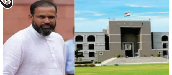
પર તમારો અનધિકૃત કબજો છે.' જમીન ખાલી કરવાના સિંગલ જજના ચુકાદા સામે યુસુફ પઠાણે ડિવિઝન બેન્ચ સમક્ષ અપીલ કરી છે. તેમના વકીલે

વડોદરા, તા. ૧૫ વડોદરાના તાંદલજા વિસ્તારમાં આવેલી આશરે ૮૭૯ ચોરસ મીટર જમીનની ફાળવણીના વિવાદમાં ગુજરાત હાઈકોર્ટે પૂર્વ ભારતીય ક્રિકેટર અને ટીએમસી સાંસદ યુસુફ પઠાણને વધુ ૪ અઠવાડિયાની રાહત આપી છે. જોકે, કોર્ટે કડક ટિપ્પણી કરતાં જણાવ્યું કે, જેટલું મોડું કરશે એટલો દંડ વધુ થશે, કારણ કે વર્ષ ૨૦૧૪થી જમીન