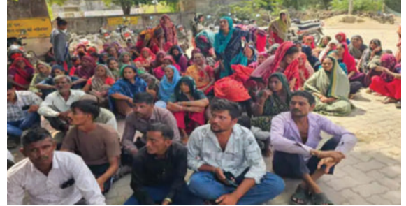
વિદ્યાર્થીઓની સંખ્યા ૧૦૮ થી ઘટીને ૮૨ થઈ ગઈ છે. હંમેશાં સમરસ રહેતા આ ગામમાં શાળાના પ્રશ્ને ભારે ઉત્તેજના છે. વાલીઓએ ચીમકી આપી છે કે જો

ઉના, તા. ૧૫ ગીરગઢડા તાલુકાના પાંડેરી ગામની પ્રાથમિક શાળાના તમામ ૮૨ વિદ્યાર્થીઓએ શિક્ષણકાર્યનો બહિષ્કાર કર્યો છે. શાળાના આચાર્યની કથિત મનમાની, નબળી કામગીરી અને કથળતા શિક્ષણ સ્તરને કારણે વાલીઓમાં ભારે અસંતોષ છે. ગ્રામજનોનો આક્ષેપ છે કે આચાર્યની ઉદાસીનતાને કારણે