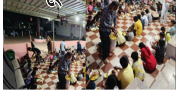
દુખાવો, ઉલ્ટી અને ઝાડા જેવી તકલીફો શરૂ થઈ હતી. એકસાથે મોટી સંખ્યામાં બાળકો

ભુજ, તા. ૧૫ કચ્છ જિલ્લાના ભુજ નજીક આવેલા માધાપરના ઐશ્વર્યા નગર વિસ્તારમાં સ્થિત એક મંદિરમાં ધાર્મિક પ્રસંગ નિમિત્તે આયોજિત બટુક ભોજનમાં ફૂડ પોઈઝનિંગની ગંભીર ઘટના સામે આવી છે. ભોજન દરમિયાન પીરસવામાં આવેલી છાશ પીધાના થોડા જ સમયમાં ૪૫થી વધુ બાળકોને પેટમાં