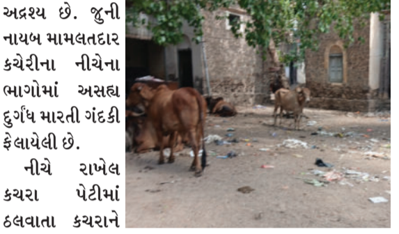
અદ્રશ્ય છે. જુની નાયબ મામલતદાર કચેરીના નીચેના ભાગોમાં અસહ્ય દુર્ગંધ મારતી ગંદકી ફેલાયેલી છે. નીચે રાખેલ કચરા પેટીમાં ઠલવાતા કચરાને ગાય માતા ખાતી જોવા મળે છે. આ ઈમારતની આસપાસ

દામનગર શહેરની મધ્યમાં આવેલ જુનું પોલીસ સ્ટેશન, નાયબ મામલતદાર કચેરી અને ગ્રામ પંચાયત કચેરીની જગ્યા છેલ્લા કેટલાક સમયથી ઉકરડા કેન્દ્ર બની ગઈ છે. આ જુના પોલીસ સ્ટેશનની અંદરના ભાગોમાં કચરાના થર જોવા મળે છે, બારી-બારણા, લોખંડ