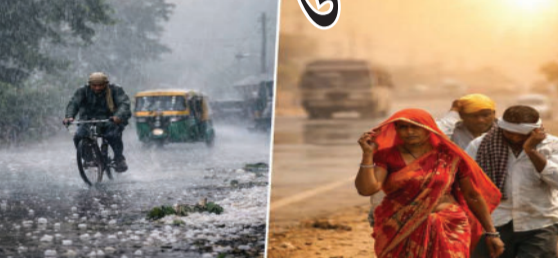
આગળ વધવા માટે પરિસ્થિતિ સાનુકૂળ છે. આ રાજ્યોમાં વરસાદી ગતિવિધિઓ વધવાથી લોકોને કાળજીળ ગરમીમાંથી

નવી દિલ્હી, તા. ૧૫ દેશના અનેક રાજ્યો તીવ્ર ગરમી અને બફારાનો સામનો કરી રહ્યા છે, ત્યારે ભારતીય હવામાન વિભાગ (IMD) એ રાહતના સમાચાર આપ્યા છે. દક્ષિણ-પશ્ચિમ ચોમાસું સતત આગળ વધી રહ્યું છે અને તેની ઉત્તરીય સીમા સોલાપુર, હૈદરાબાદ, ધનબાદ અને મુઝફ્ફરપુર સુધી પહોંચી ગઈ છે. આગામી ૪ થી ૫ દિવસમાં ચોમાસું મહારાષ્ટ્ર, બિહાર, ઝારખંડ, કર્ણાટક, તેલંગાણા અને ઓડિશાના વધુ ભાગોમાં