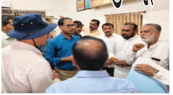
આ અભિયાનને સ્થાનિક સમર્થન મળ્યું છે. તાજેતરમાં, સંસ્થાઓ, વેપારી મંડળો અને રાજકીય આગેવાનોનું વ્યાપક આયોજન કરવામાં આવ્યું છે.

અમરેલીથી વિસાવદર વચ્ચે આઝાદી કાળની મીટર ગેજ લાઈનને બ્રોડગેજમાં રૂપાંતરિત કરવા ધારી પત્રકાર સંઘ દ્વારા 'મિશન બ્રોડગેજ' નામની બિનરાજકીય મુદ્દીમ ચલાવવામાં આવી રહી છે.