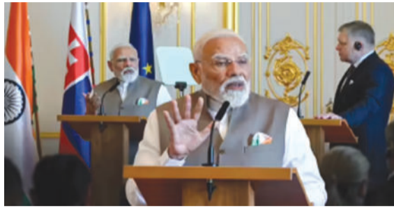
પ્રભાવશાળી દેશ સંયુક્ત રાષ્ટ્ર સુરક્ષા પરિષદમાં 'કાયમી સભ્ય' તરીકે સ્થાન મેળવવા માટે સંપૂર્ણ લાયક છે.' રોબર્ટ ફિકોએ પ્રધાનમંત્રી

વ્યાપક સુધારાની જરૂરિયાત પર મજબૂત ભાર મૂક્યો હતો. તેમણે જાહેરમાં સ્વીકાર્યું કે આ સંસ્થાઓને આજની વૈશ્વિક વાસ્તવિકતાઓ સાથે સુસંગત બનાવવી અનિવાર્ય છે. ફિકોએ સ્પષ્ટ શબ્દોમાં જણાવ્યું કે, 'હું સત્તાવાર રીતે જાહેરમાં એ જાહેર કરવા માંગુ છું કે સ્લોવાકિયા પ્રજાસત્તાકની સરકાર સંયુક્ત રાષ્ટ્રના માળખાકીય સુધારાઓને સંપૂર્ણ સમર્થન આપે છે. અમારું દ્રઢપણે માનવું છે કે ભારત જેવો