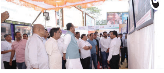
એમ.સી. તેમજ સાવરકુંડલા ખાતે આશરે ૨૫ હેક્ટરમાં વિકસાવવામાં આવેલા અમૃત સરોવરની મુલાકાત લઈ

સ્થળ તરીકે વિકસાવવાના પ્રયાસોને બિરદાવ્યા હતા. તેમણે જણાવ્યું હતું કે, સાવરકુંડલાનું અમૃત સરોવર પ્રથમ તબક્કામાં રૂ. ૫ કરોડના ખર્ચે તૈયાર કરાયું છે, જ્યારે બીજા તબક્કામાં રૂ. ૯ કરોડના ખર્ચે વધુ વિકાસના કાર્યો પ્રગતિ હેઠળ છે. આ પ્રકલ્પ જળસંચય, પર્યાવરણ અને સ્થાનિક પ્રવાસન માટે મહત્વનો સાબિત થશે. આ પૂર્વે અમરેલી ખાતે રાજ્ય સરકારની વિવિધ વિકાસલક્ષી સિધ્ધિઓને ઉજાગર કરતું પ્રદર્શન પુલ્કું મુકવામાં આવ્યું હતું, જેમાં શિક્ષણ, માર્ગ અને મકાન, વીજળીકરણ, નંદધર તેમજ સિંચાઈ ક્ષેત્રે થયેલી પ્રગતિને તસવીરોના માધ્યમથી રજૂ કરાઈ હતી. આ પ્રગતિપથ યાત્રાએ સરકારના વિકાસ કાર્યોને જનમાનસ સુધી પહોંચાડવામાં મહત્વની ભૂમિકા ભજવી છે.