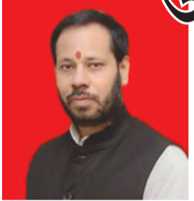
અને તેમની કથિત નારાજગી દૂર કરવાના એક સભાન પ્રયાસ તરીકે જોવામાં આવી રહી છે. ઉત્તર પ્રદેશમાં આશરે ૧૨ થી ૧૫ ટકા હિસ્સો ધરાવતો બ્રાહ્મણ સમુદાય હંમેશાથી

લખનૌ, તા. ૧૫ ઉત્તર પ્રદેશના રાજકારણમાં બ્રાહ્મણ સમુદાયને પોતાની તરફ આકર્ષવા માટે ભાજપે નવી વ્યુહરચના શરૂ કરી છે. નાયબ મુખ્યમંત્રી બ્રજેશ પાઠક પછી, તાજેતરમાં જ સમાજવાદી પાર્ટી છોડી ભાજપમાં જોડાયેલા અને કેબિનેટ મંત્રી બનેલા મનોજ પાંડે દ્વારા આયોજિત 'બટુક પૂજા'એ રાજ્યમાં ભારે રાજકીય ચર્ચા જગાવી છે. આ પૂજા વિધિને ભાજપ સાથે બ્રાહ્મણ સમુદાયના જોડાણને ફરી મજબૂત કરવાના