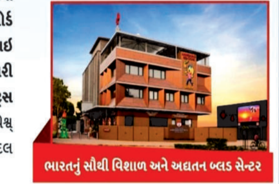
ભારતનું સૌથી વિશાળ અને અદ્યતન બ્લડ સેન્ટર