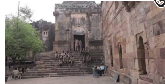
કરવાની અને મસ્જિદના ભોંયરાનું નિરીક્ષણ કરવાની માંગ કરી છે. રેલીને પગલે ભરૂચમાં કાયદો અને વ્યવસ્થા જાળવવા માટે પોલીસે યુસ્ત બંદોબસ્ત ગોઠવ્યો હતો.

ભરૂચ, તા. ૧૫ ભરૂચની જામા મસ્જિદ વિવાદ અંગે આજે સંત સમાજે હોસ્ટેલ ગ્રાઉન્ડથી કલેક્ટર કચેરી સુધી વિશાળ રેલી કાઢીને આવેદનપત્ર પાઠવ્યું છે. જેન સંતોનો દાવો છે કે આ ઐતિહાસિક સ્થળ ભૂતકાળનું ભવ્ય જૈન તીર્થ 'સમડી વિહાર' છે. તેમણે આ ધરોહરની નિયમો મુજબ જાળવણી