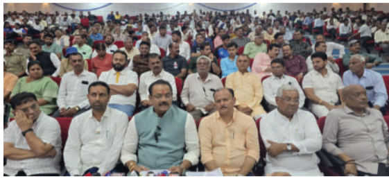
સકારાત્મક પરિવર્તનનું પ્રતિબિંબ છે. "સબકા સાથ, સબકા વિકાસ"ના મંત્ર સાથે કેન્દ્ર સરકારની ઉજવણી

અમરેલી, તા. ૧૪ પ્રધાનમંત્રી નરેન્દ્રભાઈ મોદીના નેતૃત્વ હેઠળ કેન્દ્ર સરકારના સફળ ૧૨ વર્ષ પૂર્ણ થવાના અવસરે અમરેલીમાં વિકસિત ભારત સંકલ્પ સંમેલન યોજાયું હતું. જેમાં એક પત્રકાર પરિષદનું આયોજન કરવામાં આવ્યું હતું. અમરેલી જિલ્લાના પ્રભારી મંત્રી જીવભાઈ વાઘાણીના અધ્યક્ષ