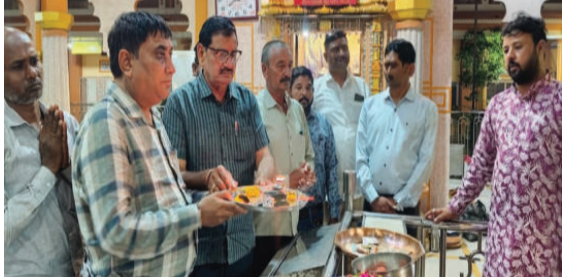
પ્રધાનમંત્રીનું સ્વાસ્થ્ય ઉત્તમ રહે અને તેઓ દીર્ઘાયુ બને તે માટે ભક્તિભાવપૂર્વક પ્રાર્થના કરી હતી. સમગ્ર ભક્તિમય માહોલ અને રાષ્ટ્રભાવનાના દિવ્ય નારાઓથી ગુંજી ઉઠ્યું હતું.

લાઠી, તા. ૧૪ વિશ્વના સૌથી લોકપ્રિય નેતા અને ભારતના વડાપ્રધાન નરેન્દ્રભાઈ મોદીના અવિરત સેવાકાર્યોના ૧૨ વર્ષ પૂર્ણ થવાના અવસરે સુપ્રસિધ્ધ તીર્થધામ ભુરખીયાધામ ખાતે એક ભવ્ય મહાઆરતીનું વિશેષ આયોજન કરવામાં આવ્યું હતું. આ મંગલ પ્રસંગે ઉપસ્થિત સૌ ભક્તો અને અગ્રણીઓએ દેશના યશસ્વી