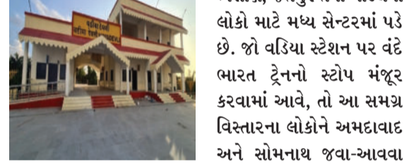
સ્ટેશનો આવેલા છે. ખાસ કરીને વડિયા એક મહત્વનું તાલુકા મથક છે અને તે કુંકાવાવ, ભેસાણ, જેતપુર તથા ગોંડલના લોકો માટે મધ્ય સેન્ટરમાં પડે છે. જો વડિયા સ્ટેશન પર વંદે ભારત ટ્રેનનો સ્ટોપ મંજૂર કરવામાં આવે, તો આ સમગ્ર વિસ્તારના લોકોને અમદાવાદ અને સોમનાથ જવા-આવવા માટે લાંબા અંતરની ઝડપી રેલવે સેવાનો મોટો લાભ મળી શકે તેમ છે.

વડિયા, તા. ૧૪ અમરેલી જિલ્લામાંથી પસાર થતા જેતલસર-ઢસા બ્રોડગેજ ટ્રેક પર નવી ટ્રેનો શરૂ કરવા લાંબા સમયથી વચનો અપાયા હતા. તાજેતરમાં સોશિયલ મીડિયા પર વાયરલ થયેલા રેલવે વિભાગના એક સાચા પત્ર અનુસાર, સાબરમતી-વેરાવળ વંદે ભારત ટ્રેન હવે ધોળકા, બોટાદ, ઢસા અને જૂનાગઢ થઈને દોડશે. આ નિર્ણયથી વિસ્તારને નવી ટ્રેન તો મળી, પરંતુ પત્ર મુજબ અમરેલી જિલ્લાના એકપણ સ્ટેશન પર આ ટ્રેનનો સ્ટોપ આપવામાં આવ્યો નથી, જેથી સ્થાનિક લોકોમાં ભારે નારાજગી જોવા મળી રહી છે. આ રૂટ પર લાઠી, ચિતલ અને કુંકાવાવ જેવા મોટા