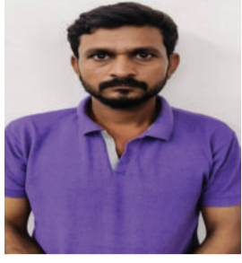
ટોળકી વચ્ચે 'એકાઉન્ટ/કેશ હેન્ડલર' તરીકેની મુખ્ય ભૂમિકા ભજવતો હોવાનું તપાસમાં બહાર આવ્યું હતું. તેણે ફરિયાદીને સબસિડીવાળી રૂપિયા ૨૫

અમરેલી, તા. ૧૪ વડોદરાના ડભોઈ ખાતેથી દબોચી મોટી રકમની લોનની લાલચ આપી નાગરિકોને રાજસ્થાનના જયપુર ખાતે બોલાવી, હોટલમાં ગોંધી રાખી તેમજ ડરાવી-ધમકાવી તેમના બેંક ખાતાનો સાયબર ફ્રોડમાં ઉપયોગ કરતી આંતરરાજ્ય ગેંગના વધુ એક મુખ્ય સાગરિતને પકડી પાડવામાં અમરેલી સાયબર ક્રાઈમ પોલીસ સ્ટેશનને મોટી સફળતા મળી હતી. પોલીસે ટેકનિકલ સોર્સના આધારે તપાસ કરીને આ કેસના આરોપીને