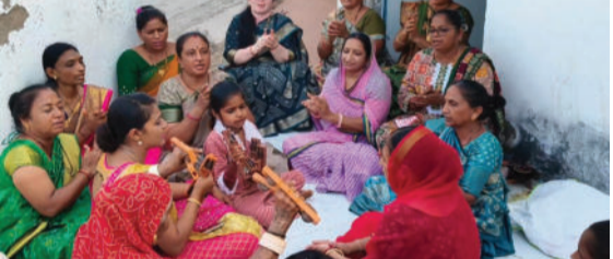
આ ધાર્મિક મહોત્સવ અંતર્ગત મંડળની બહેનોએ ભગવાન પુરુષોત્તમને પંચાવન નહિ પણ છપ્પન ભોગનો ભવ્ય અન્નકૂટ મનોરથ ધર્યો હતો. સોસાયટીની મહિલાઓ પોતાના ઘરેથી પ્રેમપૂર્વક વિવિધ વાનગીઓ બનાવીને લાવી હતી, જે ગૌરમા અને

જાફરાબાદના ત્રિકોણ બાગ નજીક આવેલી શિક્ષક સોસાયટીમાં જય અંબે મહિલા મંડળ દ્વારા પુરુષોત્તમ માસની ભવ્ય ઉજવણી કરવામાં આવી હતી.