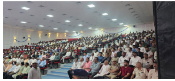
છેવાડાના માનવી સુધી પહોંચ્યો છે. તેમણે ઉમેર્યું કે ગુજરાતને ગિક્ટ સિટી, ધોલેરા એસ.આઈ.