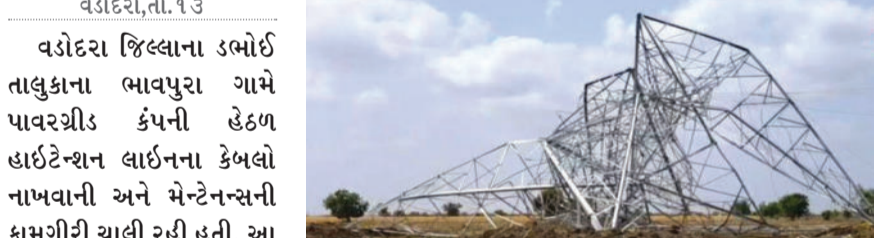
આવેલા શ્રમિકો પેકી ત્રણનાં કરુણ મોત નીપજ્યાં છે. ઘટનામાં અન્ય ચાર શ્રમિકો ઈજાગ્રસ્ત થતાં તેમને તાત્કાલિક સારવાર અર્થે ખસેડવામાં આવ્યા હતા, જેમાંના એક શ્રમિકનું વડોદરાની સયાજી હોસ્પિટલમાં સારવાર દરમિયાન મોત થયું હતું. આ દુર્ઘટનાને પગલે ડાહ્યા પોલીસે ઘટનાસ્થળે પહોંચીને તમામ મૃતદેહોને પોસ્ટમોર્ટમ માટે

વડોદરા જિલ્લાના ડાહ્યા તાલુકાના ભાવપુરા ગામે પાવરગ્રીડ કંપની હેઠળ ઇાઈટેન્શન લાઈનના કેબલો નાખવાની અને મેન્ટેનન્સની કામગીરી ચાલી રહી હતી. આ સમયે વીજપોલ પર ચઢીને કામ કરી રહેલા શ્રમિકો અચાનક થાંભલો ધરાશાયી થતાં નીચે પટકાયા હતા. આ ગંભીર અકસ્માતમાં પશ્ચિમ બંગાળના ગોડાગ ગામથી રોજરોટી માટે