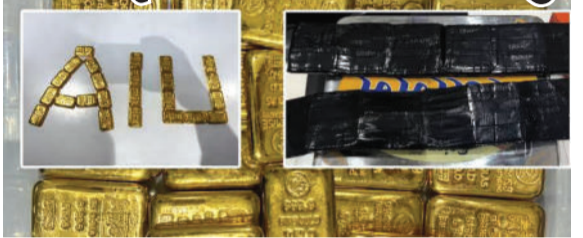
શૌચાલયની સઘન તપાસ કરી હતી. આ તપાસ દરમિયાન શૌચાલયના સ્પીકર બોક્સની અંદર કાળા રંગની પ્લાસ્ટિક ટેપથી વીંટાળેલા બે

અમદાવાદ આંતરરાષ્ટ્રીય એરપોર્ટ પર કસ્ટમ વિભાગે ગત બાતમીના આધારે એક મોટી કાર્યવાહી હાથ ધરીને સોનાની તસ્કરીના મોટા રેકેટનો પર્દાફાશ કર્યો છે. દુબઈથી અમદાવાદ આવેલી ઈન્ડિગો ફ્લાઈટ નંબર ૬૬૧-૧૪૭૮ લેન્ડ થયા બાદ, અધિકારીઓએ એરક્રાફ્ટ એન્જિનિયરની મદદથી વિમાનના આગળના ભાગમાં આવેલા