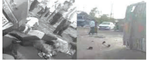
અટલો જોરદાર હતો કે ઈકો કારનો ક્રૂચો બોલી ગયો હતો, ટ્રક રોડ પર પલટી મારી ગયો હતો અને ટેન્કરની કેબિનનો પણ બુકડો વળી ગયો હતો. આ હૃદયદ્રાવક ઘટનાને પગલે હાઈવે પર લાંબો ટ્રાફિક જામ સર્જાયો હતો.

રાજકોટ-અમદાવાદ હાઈવે પર બેટી રામપર ગામ નજીક ભારત પેટ્રોલિયમના ટેન્કર, ટ્રક અને ઈકો કાર વચ્ચે ગમખવાર ત્રિપલ અકસ્માત સર્જાયો હતો. આ ભયાનક અકસ્માતમાં ચાર લોકોના ઘટનાસ્થળે જ કરૂણ મોત નિપજ્યા હતા, જ્યારે અન્ય ચાર લોકો ગંભીર રીતે ઈજાગ્રસ્ત થયા હતા. અકસ્માત