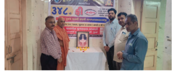
ડોક્ટરો દ્વારા ૮૭ જેટલા મોતિયાના દર્દીઓની ઝીણવટભરી તપાસ કરવામાં આવી હતી. તેમાંથી