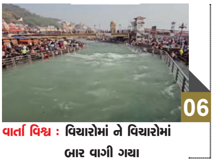
06 વાર્તા વિશ્વ : વિચારોમાં ને વિચારોમાં બાર વાગી ગયા