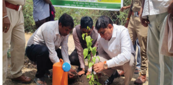
સંખ્યામાં નગરજનો ઉત્સાહભરે જોડાયા હતા.કાર્યક્રમ દરમિયાન વિવિધ પ્રકારના વૃક્ષોના રોપાઓનું વાવેતર કરવામાં આવ્યું હતું. ધારાસભ્ય જનકભાઈ તળાવીયાએ પ્રદૂષણ અને ગ્લોબલ વોર્મિંગ જેવી ગંભીર સમસ્યાઓ સામે લડવા માટે વૃક્ષોના મહત્વ પર ભાર મૂક્યો હતો.

વિશ્વ પર્યાવરણ દિવસની ઉજવણીના ભાગરૂપે લાઠી શહેરમાં ધારાસભ્ય જનકભાઈ તળાવીયાની ઉપસ્થિતિમાં વૃક્ષારોપણ કાર્યક્રમનું આયોજન કરવામાં આવ્યું હતું. પર્યાવરણના સંરક્ષણ અને હરિયાળી વધારવાના ઉદ્દેશ સાથે યોજાયેલા આ કાર્યક્રમમાં શહેર ભાજપ સંગઠન, લાઠી નગરપાલિકાના ચૂંટાયેલા પ્રતિનિધિઓ, સ્થાનિક આગેવાનો, કાર્યકરો અને મોટી