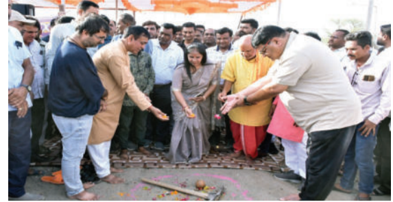
ઉપલબ્ધ થશે. આ ઉપરાંત, રૂપિયા ૪.૭૨ કરોડના ખર્ચે અમરેલી શહેરના ત્રણ મુખ્ય માર્ગોને આઈકોનિક રોડ એટલે કે 'ગૌરવ

મુખ્યમંત્રી શહેરી વિકાસ યોજના અંતર્ગત શહેરના વિવિધ વિસ્તારોમાં માર્ગ, ડ્રેનેજ અને લાઈટિંગ જેવી પાયાની માળખાગત સુવિધાઓનો પ્રારંભ કરવામાં આવ્યો છે. આ યોજનાના ઓછા એરિયા અંતર્ગત વર્ષ ૨૦૨૫-૨૬ માટે રૂપિયા ૨૦ કરોડથી વધુના ખર્ચે ક્રેકિટ રોડ, ડ્રેનેજ લાઈન અને સ્ટ્રીટલાઈટના કામો હાથ ધરાશે, જેનાથી નાગરિકોને ગુણવત્તાયુક્ત શહેરી સુવિધાઓ