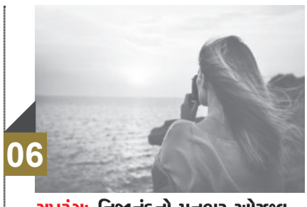
06 સમરંગ: નિજાનંદનો મનભર ઓચ્છવ છે એકાન્ત....!