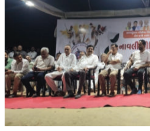
અભિનંદન પાઠવતાં રમતગમત દ્વારા યુવાનોમાં શિસ્ત, ટીમભાવના અને સ્વસ્થ સ્પર્ધાની ભાવના વિકસે છે તેમ