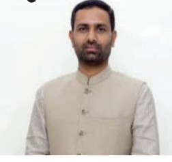
આચાર્યની ઓફીસ સામે યોજાશે. જેમાં અમરેલીના ૩ મુખ્ય માર્ગોને 'આઈકોનિક રોડ' તરીકે ડેવલપ કરવા માટે રૂ. ૪૨૨ લાખની કામગીરીનું ખાતમુહૂર્ત કરાશે.