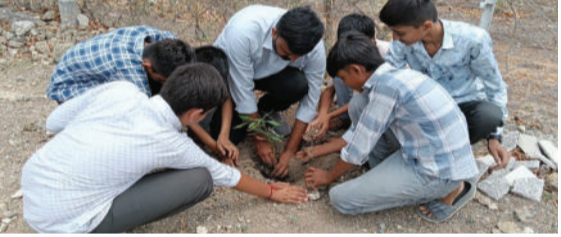
પહોંચાડતા પ્લાસ્ટિકનો ઉપયોગ અટકાવી 'વાસ્ટિક મુક્ત ગુજરાત' બનાવવા માટે સૌને સંકલ્પબધ થવા અનુરોધ કર્યો હતો. વડાપ્રધાન નરેન્દ્ર મોદીની અપીલ મુજબ 'એક પેડ મા કે નામ' પ્રકલ્પ અંતર્ગત દરેક બાળક પોતાની માતાના નામે એક વૃક્ષ વાવે અને તેનો ઉછેર કરે

જ યોજાયેલા આ કાર્યક્રમ દ્વારા બાળકોમાં પર્યાવરણ સંવર્ધન પ્રત્યે જાગૃતિ લાવવાનો પ્રશંસનીય પ્રયાસ કરાયો હતો. આ પ્રસંગે આચાર્યએ ગ્લોબલ વૉર્મિંગની ગંભીર સ્થિતિ અને તેના નિવારણના ઉપાયો વિશે વિસ્તૃત ચર્ચા કરી હતી. તેમણે જણાવ્યું કે ગ્લોબલ વૉર્મિંગને ડામવાનો સૌથી ઉત્તમ ઉપાય વધુમાં વધુ વૃક્ષો વાવવાનો છે. આ સાથે જ પર્યાવરણને નુકસાન