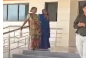
પટેલ પણ ઉપસ્થિત રહ્યા હતા. આ હોસ્પિટલ રાજુલા, ખાંભા અને જાકરાબાદ - ત્રણેય તાલુકાના

રાજુલામાં તાજેતરમાં કરોડોના રૂપિયાના ખર્ચે નિર્મિત અને પૂજ્ય મોરારીબાપુના હસ્તે લોકાર્પિત મહાત્મા ગાંધી આરોગ્ય મંદિર ત્રણ તાલુકા માટે આશીર્વાદરૂપ બની રહ્યું છે. લોકાર્પણ સમયે આરોગ્ય મંત્રી અને મુખ્યમંત્રી ભુપેન્દ્રભાઈ