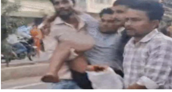
લીધે આગ આખા વોર્ડમાં ઝડપથી ફેલાઈ ગઈ હતી. ઘટનાની માહિતી મળતા જ ફાયર બ્રિગેડની ટીમે તાત્કાલિક ઘટનાસ્થળે પહોંચીને ભારે જહેમત બાદ આગ પર કાબૂ મેળવ્યો હતો. આ અકસ્માત પાંચમા

પટના, તા.૦૪ બિહારના મુઝફ્ફરપુરમાં એક ખાનગી હોસ્પિટલના આઈસીયુ વોર્ડમાં મોટી રાત્રે અચાનક ભીષણ આગ ફાટી નીકળતાં પાંચ દર્દીઓના કમકમાટીભર્યા મોત નીપજ્યા છે અને વીસથી વધુ લોકો ગંભીર રીતે ઘાયલ થયા છે. પ્રાથમિક તપાસ અનુસાર બુધવારે રાત્રે આશરે ત્રણ વાગ્યે શોર્ટ સર્કિટના કારણે એસીમાં જોરદાર બ્લાસ્ટ થયો હતો, જેના