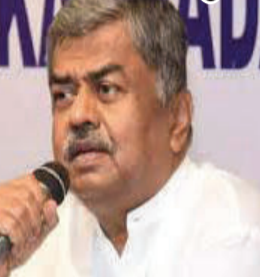
સત્તા સંભાળતા જ મુખ્યમંત્રી શિવકુમારે સરકારી બસોમાં તમામ વિદ્યાર્થીઓ માટે મફત મુસાફરીની પ્રથમ મોટી જાહેરાત કરી છે.

કર્ણાટક, તા.૦૪ કર્ણાટકમાં મુખ્યમંત્રી તરીકે ડીકે શિવકુમારે શપથ લેતાં તેમણે પ્રદેશ કોંગ્રેસ પ્રમુખ પદેથી રાજીનામું આપ્યું છે. તેમના સ્થાને ઓલ ઈન્ડિયા કોંગ્રેસ સમિતિએ વરિષ્ઠ અને અનુભવી નેતા બીકે હરિપ્રસાદને કર્ણાટક કોંગ્રેસના નવા પ્રમુખ (KPCC Chief) નિયુક્ત કર્યા છે. નવી સરકારમાં જી. પરમેશ્વર નાયબ મુખ્યમંત્રી બન્યા છે.