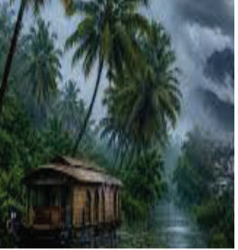
વરસાદની સંભાવનાને ધ્યાનમાં રાખીને ઓરેન્જ એલર્ટ જાહેર કરવામાં આવ્યું છે. હવામાન

નવી દિલ્હી, તા.૪ દેશભરમાં ગરમીથી ત્રસ્ત લોકોને રાહત આપતા દક્ષિણ-પશ્ચિમ ચોમાસાએ ગુરુવારે સત્તાવાર રીતે કેરળમાં પ્રવેશ કર્યો છે. ભારતીય હવામાન વિભાગ અનુસાર, ચોમાસાનું આગમન સામાન્ય તારીખ કરતાં થોડા દિવસ મોડું થયું છે. કેરળના અલાપ્પુઝા, કોટ્ટાયમ અને એનાંકુલમ જિલ્લાઓમાં ભારે