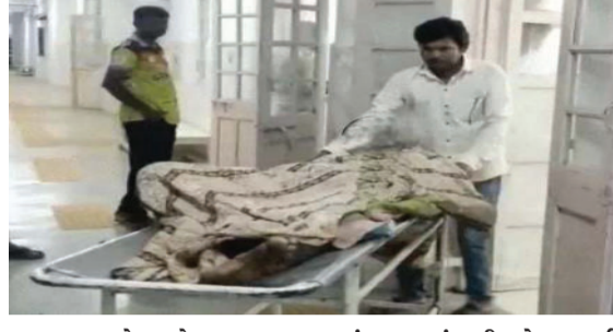
ગયા હતા અને કાયદેસરના ભાગ પાડ્યા પછી જ ખેડ કરવા જણાવ્યું હતું. આ સાંભળી મોટા ભાઈ એકદમ ઉશ્કેરાઈ ગયા હતા અને

ખાંભા, તા.૦૪ ખાંભા તાલુકાના કંટાળા ગામેથી એક ચોંકાવનારી ઘટના સામે આવી છે. અહીં માત્ર જમીનની ભાગબટાઈના એક સામાન્ય વિવાદે એટલું ઉગ્ર સ્વરૂપ ધારણ કર્યું કે સગા મોટા ભાઈ અને તેના પરિવારે મળીને પોતાના જ નાના ભાઈની નિર્મમ હત્યા કરી નાખી. આ લોહીયાણ