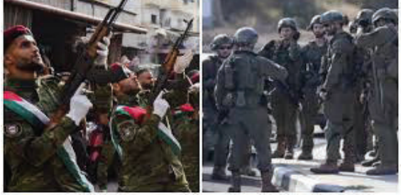
સંપૂર્ણ નિયંત્રણ સંભાળશે. યુએસ સ્ટેટ ડિપાર્ટમેન્ટ દ્વારા જારી કરાયેલા સંયુક્ત નિવેદન નદીના દક્ષિણ વિસ્તારમાંથી લડવૈયાઓને પાછા ખેંચવા પર

વોશિંગ્ટન, તા.૦૪ અમેરિકાની મધ્યસ્થતામાં યોજાયેલી વાટાઘાટો બાદ ઈઝરાયેલ અને લેબનોન વચ્ચે નાજુક યુધ્ધવિરામને પુનઃ લાગુ કરવા અને લેબનોનમાં કેટલાક પાયલોટ 'સુરક્ષા ઝોન' સ્થાપવા પર સહમતી સધાઈ છે. આ કારાર અંતર્ગત હિઝબુલ્લાહના લડવૈયાઓને સુરક્ષા ઝોનમાં પ્રવેશવા પર પ્રતિબંધ રહેશે અને લેબનીઝ સેના આ વિસ્તારોનું