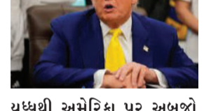
યુધ્ધથી અમેરિકા પર અબજો ડોલરનો આર્થિક ભોજ વધ્યો છે અને વૈશ્વિક સ્તરે મોંઘવારી તેમજ ફૂડ ઓઈલની અછત સર્જાઈ છે. જોકે, આ ઠરાવ પ્રતીકાત્મક છે અને હજુ સેનેટમાં તેના પર અંતિમ મતદાન બાકી છે.

વોશિંગ્ટન, તા.૦૪ અમેરિકી સંસદ (યુએસ કોંગ્રેસ) ના પ્રતિનિધિ ગુડે ઈરાન સામે લશ્કરી કાર્યવાહી અટકાવવા માટે 'વોર પાવર્સ રિઝોલ્યુશન' (યુધ્ધ શક્તિ ઠરાવ) ને ૨૧૫ વિરુદ્ધ ૨૦૮ મતોથી મંજૂરી આપી દીધી છે. રાષ્ટ્રપતિ ડોનાલ્ડ ટ્રમ્પની નીતિઓનો વિરોધ કરીને કેટલાક રિપબ્લિકન ધારાસભ્યો ૩મોકેટ્સ સાથે જોડાયા હતા. સાંસદોના મતે, આ અવિચારી