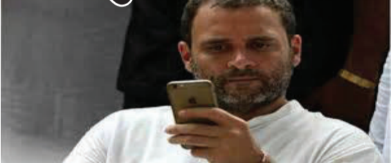
કર્યા હતા. રાહુલ ગાંધીએ આરોપ લગાવ્યો કે કેન્દ્ર સરકાર અમેરિકાના દબાણ હેઠળ કામ કરી રહી છે અને દેશની

નવી દિલ્હી, તા.૦૪ કોંગ્રેસ નેતા અને લોકસભામાં વિપક્ષના નેતા રાહુલ ગાંધીએ ખરાબ હવામાનના કારણે અલ્મોડાની જાહેર સભામાં રૂબરૂ હાજર ન રહી શકતા દિલ્હીથી ફોન દ્વારા જનતાને સંબોધિત કરી હતી. પોતાના સંબોધનમાં તેમણે કેન્દ્રની મોદી સરકારની વિદેશ, કૃષિ, શિક્ષણ અને આર્થિક નીતિઓ પર આકરા પ્રહારો