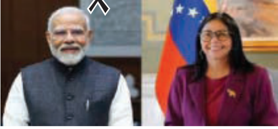
વાટાઘાટોમાં ઊર્જા સુરક્ષા, વેપાર અને રોકાણ, ફાર્માસ્યુટિકલ્સ, આરોગ્યસંભાળ, પરિવહન અને નવીનીકરણીય ઊર્જા જેવા મહત્વપૂર્ણ

નવી દિલ્હી, તા.૪ વડાપ્રધાન વડાપ્રધાન મોદીએ ગુરુવારે નવી દિલ્હીના હૈદરાબાદ હાઉસમાં વેનેઝુએલાના કાર્યકારી રાષ્ટ્રપતિ ડેલ્સી રોડ્રિગ્ઝ સાથે મહત્વપૂર્ણ બેઠક યોજી હતી. આ મુલાકાત દરમિયાન બંને દેશો વચ્ચેના દ્વિપક્ષીય સંબંધોને વધુ મજબૂત બનાવવા તેમજ વિવિધ ક્ષેત્રોમાં સહયોગ વધારવા અંગે વિસ્તૃત ચર્ચા કરવામાં આવી હતી.