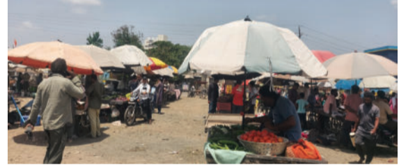
સમરસતાના પ્રતીક સમાન આ બજાર માટે તંત્ર દ્વારા

સાવરકુંડલા, તા.૦૪ રતાણીએ રૂબરૂ મુલાકાત લઈને સાવરકુંડલા શહેરમાં વ્યવસ્થાની સમીક્ષા કરી હતી અને પાર્કિંગ એરિયામાં દબાણ ન થાય તે માટે જરૂરી સૂચનો ક્યાં હતા. આ નવી જગ્યાએ અંદાજે ૨૦૦ જેટલા શાકભાજી વિકેતાઓ ઉત્સાહભરે નગરપાલિકાના ચીફ ઓફિસર સ્થળાંતરિત થયા છે. સામાજિક