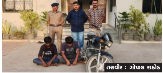
નાગેશ્રી પોલીસ ટીમ દ્વારા ચોરીની હીરો સ્પેન્ડર પ્લસ મોટરસાયકલ (રજિસ્ટ્રેશન નંબર GJ-03-20F3, કિંમત રૂપિયા ૩,૫૦૦) સાથે દબોચી લેવાયા છે.