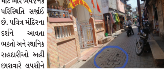
માટે ભારે ભયજનક પરિસ્થિતિ સર્જાઈ છે. પવિત્ર મંદિરના દર્શને આવતા ભક્તો અને સ્થાનિક રાહદારીઓ અહીં છાશવારે લપસીને પડી જાય છે અને અકસ્માતનો ભોગ બને છે. દરરોજ સેકંડો ગ્રામજનો આ જોખમી માર્ગ પરથી પસાર થાય છે, તેમ છતાં વહીવટી

દામનગર, તા.૦૪ દામનગર શહેરની મધ્યમાં આવેલા શ્રી રામજી મંદિરના મુખ્ય દરવાજા સામે મેઈન બજારમાં ફિટ કરવામાં આવેલા પેવર બ્લોકનો મોટો હિસ્સો કેટલાય મહિનાઓથી ઉખડી ગયો છે. આ રસ્તો સમતલ ન હોવાને કારણે અહીંથી પસાર થતા વાહનચાલકો અને રાહદારીઓ