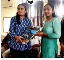
હતું. ત્યારબાદ ૧ જૂન ૨૦૨૬ના રોજ જાહેર આરોગ્ય કચેરીના

અમરેલી,તા.૦૩ સ્વસ્થ અને વિશ્વ તમાકુ નિષેધ દિવસ નિમિત્તે સરકારી આઈ.ટી.આઈ. અમરેલી ખાતે વ્યસનમુક્તિ અંગે જાગૃતિ લાવવાના હેતુથી વિવિધ કાર્યક્રમોનું સુંદર આયોજન કરવામાં આવ્યું હતું. આ કાર્યક્રમનો મુખ્ય ઉદ્દેશ્ય વિદ્યાર્થીઓને તમાકુના દૂષણોથી માહિતગાર કરી