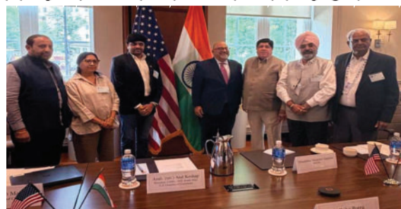
આરોગ્યમાં સુધારો લાવવા અને ખેડૂતોને વધુ અસરકારક ટેકનિકલ સહાય ઉપલબ્ધ કરાવવા અંગે

દેશો વચ્ચે સંશોધન, જ્ઞાન અને ટેકનોલોજીની આપ-લે વધારવા પર પણ ભાર મૂકવામાં આવ્યો હતો. કૃષિ નિષ્ણાઓ, નીતિ નિર્માતાઓ અને ઉદ્યોગ પ્રતિનિધિઓએ સહમતી વ્યક્ત કરી હતી કે આ સહકાર લાંબા ગાળે ખેડૂતો માટે લાભદાયી સાબિત થશે. આ બેઠક ઈફકોની વધતી આંતરરાષ્ટ્રીય પ્રતિષ્ઠા અને ભારતીય ખેડૂતોના હિતોને વૈશ્વિક મંચ પર અસરકારક રીતે રજૂ કરવાની