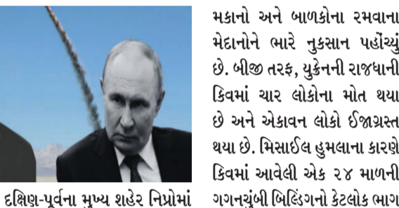
મકાનો અને બાળકોના રમવાના મેદાનોને ભારે નુકસાન પહોંચ્યું છે. બીજી તરફ, યુક્રેનની રાજધાની કિવમાં ચાર લોકોના મોત થયા છે અને એકાવન લોકો ઈજાગ્રસ્ત થયા છે. મિસાઈલ હુમલાના કારણે કિવમાં આવેલી એક ૨૪ માળની ગગનચુંબી બિલ્ડિંગનો કેટલોક ભાગ

મોસ્કો,તા.૦૨ રશિયા અને યુક્રેન વચ્ચે ચાલી રહેલું યુદ્ધ સમય જતાં વધુ ભયાનક અને વિનાશક બની રહ્યું છે. મંગળવારે વહેલી સવારે રશિયાએ યુક્રેનના મુખ્ય શહેરો કિવ, નિપ્રો અને ખાર્કિવને નિશાન બનાવીને મિસાઈલ અને ડ્રોન દ્વારા મોટા પાયે હવાઈ