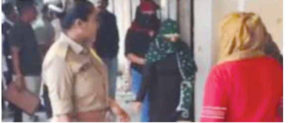
નામે ગ્રાહકો પાસેથી મોટી રકમ વસૂલીને આ ગેરકાયદેસર પ્રવૃત્તિ ચલાવવામાં આવતી હતી. પોલીસે ચોક્કસ ખાતમીના આધારે ડમી ગ્રાહક મોકલીને આ સમગ્ર પ્લાન સફળ બનાવ્યો

રાજકોટ, તા.૦૧ રાજકોટ પોલીસે શહેરના હાર્ટ ઓફ ધ સિટી ગણાતા સેન્ટ્રલ બસ પોર્ટ કોમ્પ્લેક્સમાં આવેલા એક સ્પા સેન્ટર પર ઓચિંતો દરોડો પાડીને અનૈતિક દેહવ્યાપારના મોટા નેટવર્કનો પર્દાફાશ કર્યો છે. હજારો મુસાફરો અને નાગરિકોની સતત અવરજવરથી ધમધમતા આ વિસ્તારમાં આયુર્વેદિક મસાજના