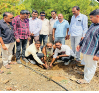
આગેવાનો અને ગ્રામજનો દ્વારા પર્યાવરણની જાળવણીના સંકલ્પ સાથે ઉત્સાહભેર વૃક્ષારોપણ કરવામાં આવ્યું હતું. કાર્યક્રમના અંતે પરમ પૂજ્ય બાપુ અને સમસ્ત ગ્રામજનોએ બંને જનપ્રતિનિધિઓનું સ્વાસ્થ્ય સદાય નિરોગી અને દીર્ઘાયુ રહે તેવી ત્રિવેણી માતાજીના ચરણોમાં શ્રધ્ધાપૂર્વક મંગલ પ્રાર્થના કરી હતી.

આ કાર્યક્રમમાં સાંસદ ભરતભાઈ સુતરીયા તથા વિસ્તારના લોકપ્રિય અને ઉત્સાહી યુવા ધારાસભ્ય જનકભાઈ તળાવીયાના જન્મદિવસની અનોખી ઉજવણી કરવામાં આવી હતી. આ શુભ અવસરે ઉપસ્થિત સૌ