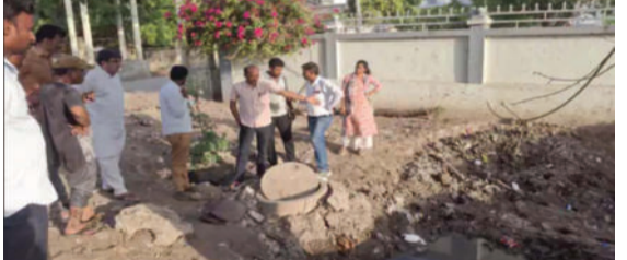
બનાવવા આ મહત્વપૂર્ણ પહેલ કરાઈ છે. આ ગંભીર સમસ્યાના કાયમી ઉકેલ માટે તાજેતરમાં જ એક પ્રમુખ સ્થળ મુલાકાત યોજાઈ

સાવરકુંડલા, તા. ૦૧ સાવરકુંડલા શહેરના જેસર રોડ વિસ્તારમાં વરસાદી પાણી અને ગટરના કાયમી નિકાલ માટે નગરપાલિકા દ્વારા તાત્કાલિક કામગીરી શરૂ કરવામાં આવશે. સ્થાનિક રહીશોની રજૂઆતોને ધ્યાનમાં રાખીને સરદાર પટેલ સોસાયટી સહિત સમગ્ર જેસર રોડ વિસ્તાર અને વોર્ડ નંબર-૮માં પ્રાથમિક સુવિધાઓ સુદૃઢ