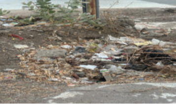
સેવાઈ રહી છે. આ બાબતે તંત્ર દ્વારા તાકીદે યોગ્ય પગલાં ભરીને નિયમિત સફાઈ કરાવવામાં આવે તેવી લોકમાં પ્રબળ બની છે.

અમરેલી, તા.૦૧ અમરેલીના લાઠી રોડ પર આવેલા ધરમનગર મેઈન રોડ પર હાલ કચરાના મોટા ગંજ ખડકાયા છે. સ્થાનિક રહીશોના જણાવ્યા અનુસાર આ વિસ્તારમાં લાંબા સમયથી કોઈ સફાઈ કામદારો આવતા નથી. માત્ર ધરમનગર જ નહીં, પરંતુ તેની આજુબાજુ આવેલી માધવનગર, પ્રમુખસ્વામી નગર, નાગનાથ સોસાયટી, શિવમ સોસાયટી, શ્રીજી સોસાયટી અને વલ્લભનગર સોસાયટીમાં પણ સફાઈની પરિસ્થિતિ અત્યંત દયનીય છે. ચારેય તરફ ગંદકી અને કચરાના ઢગલા થવાને કારણે સ્થાનિકોમાં ભયંકર રોગચાળો ફેલાવાની પૂરેપૂરી ભીતિ