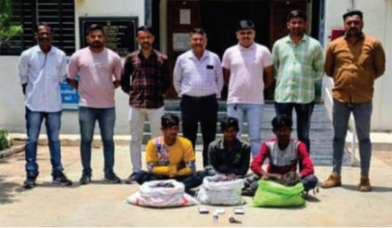
હોવાની ફરિયાદ નોંધાઈ હતી. જ્યારે ચોરીનો ત્રીજો બનાવ તા. ૨૦/૦૫ના રોજ બપોરના સમયે અમરેલી બાયપાસ ચોકડી પાસે મહિન્દ્રા ટ્રેક્ટરના શો-રૂમની સામે આવેલી વાડીમાં બન્યો હતો. ત્યાંથી તસ્કરો રૂ. ૧૨,૦૦૦ની

આશરે ૨૮૦ ફૂટ લાંબો કોપર વાયર, જેની કિંમત રૂ. ૨૮,૦૦૦ થાય છે, તેની ચોરી કરી નાસી છૂટ્યો હતો. આ જ વિસ્તારમાં ચક્કરગઢ રોડ, પાણાખાણવાળા રસ્તે આવેલી અન્ય એક વાડીઓને પણ તસ્કરોએ એ જ રાત્રિ દરમિયાન નિશાન બનાવી હતી. ત્યાંથી સબમશિંચલ મોટર સાથે જોડેલો કુલ ૧૮૫ ફૂટ કોપર વાયર (કિંમત રૂ. ૧૮,૫૦૦) ચોરી ગયા