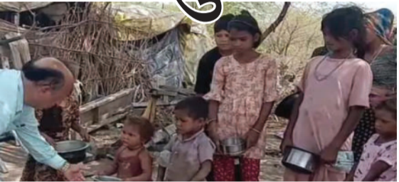
પુણ્યશાળી સેવાકાર્ય ચલાલાના મૂળ વતની અને હાલ રાજકોટમાં રહેતા જલારામભક્ત અને રઘુવંશી સેવકના આર્થિક સહયોગથી સફળતાપૂર્વક યોજાયું હતું. આ સમગ્ર માનવતાવાદી કાર્યનું સુંદર આયોજન અને

ચલાલા, તા.૦૧ ચલાલા શહેરમાં ઉનાળાની કાળઝાળ ગરમી અને ડાપ ડિઝી જેટલા આકરા તાપમાન વચ્ચે ગરીબ અને જરૂરિયાતમંદ લોકોને રાહત આપવા માટે એક સરાહનીય પ્રવૃત્તિ કરવામાં આવી હતી. ગત ૩૧ મેના રોજ "જલારામ છાશ કેન્દ્ર" દ્વારા સમગ્ર શહેરમાં ઠંડી છાશનું નિ:શુલ્ક વિતરણ કરવામાં આવ્યું હતું. આ