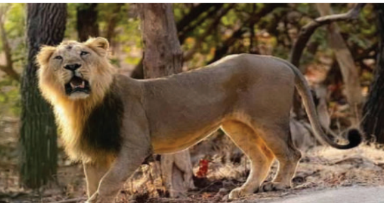
નથી. જો આ સિંહોને ગીર જંગલમાં ખસેડવામાં આવશે તો ત્યાં પહેલેથી વસવાટ કરતા સિંહો સાથે ઘર્ષણ સર્જવાની

સિંહોને પાંજરે પૂરવામાં આવ્યા હોવાનું જાણવા મળ્યું છે. માનવ મૃત્યુની ઘટનાના પગલે નિર્દોષ સિંહોને પણ પકડી લેવામાં આવી રહ્યા હોવાના આક્ષેપ સાથે સિંહપ્રેમીઓએ નારાજગી વ્યક્ત કરી છે. તેમનું કહેવું છે કે યોગ્ય ઓળખ અને વૈજ્ઞાનિક પ્રક્રિયા વિના સિંહોને પકડવાની કાર્યવાહી યોગ્ય