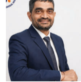
કરશે. આ કાર્યક્રમમાં ભાગ લેવા દર્દીઓએ તેમની

સુવિધા માટે અગાઉથી મો. નં. ૮૪૮૭૮-૦૦૭૧૦ પર એપોઈન્ટ લેવી. આ કાર્યક્રમ દરમિયાન તમામ પ્રકારના બ્લડ કેન્સર અને થેલેસેમિયા સહિતના વિવિધ રક્તરોગ અંગે માર્ગદર્શન આપવામાં આવશે. દર્દીઓને સારવાર માટે સેકન્ડ ઓપિનિયન પણ આપવામાં આવશે.