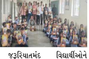
જરૂરિયાતમંદ વિદ્યાર્થીઓને નોટબુકોનું વિતરણ કરાયું હતું. આ ઉપરાંત ગરીબ અને મધ્યમવર્ગીય પરિવારોના બાળકો પરથી મોંઘા ભણતરનો ભોજ હળવો કરવા માટે ૫૦૦૦ જેટલા પાઠ્યપુસ્તકો પણ એનાયત કરવામાં આવ્યા હતા.

સાવરકુંડલા, તા.૩૦ સાવરકુંડલા તાલુકાના ગાંધકડા ગામે આશાપુરા નારાયણ દેવી મંદિર ટ્રસ્ટ દ્વારા એક પ્રશંસનીય સેવાયજ્ઞ યોજાયો હતો. ગ્રામીણ વિસ્તારનું કોઈ બાળક આર્થિક સંકટમાં મુજબ કારણે શિક્ષણથી વંચિત ન રહે તેવા હેતુથી ટ્રસ્ટ દ્વારા દીકરા-દીકરીઓને શૈક્ષણિક સામગ્રીનું પ્રદાન કરવામાં આવ્યું હતું. નવા શૈક્ષણિક વર્ષના પ્રારંભે અંદાજે ૯૨૦ જેટલા