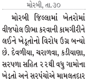
કે તેમની રજૂઆતોને અવગણીને ખેતરોમાં વીજપોલ ઊભા કરવામાં આવી રહ્યા છે, જેના કારણે ખેતી અને માલિકીના હકોને નુકસાન પહોંચશે. તેમણે વીજપોલની કામગીરી તાત્કાલિક બંધ કરવાની

મોરબી, તા.૩૦ મોરબી જિલ્લામાં ખેતરોમાં વીજપોલ ઊભા કરવાની કામગીરીને લઈને ખેડૂતોનો વિરોધ ઉગ્ર બન્યો છે. દેવળીયા, ચરાળવા, કડીયાણા, સરપળા સહિત ૨૨ થી વધુ ગામોના ખેડૂતો અને સરપંચોએ મામલતદાર કચેરી ખાતે ભેગા થઈ સરકાર અને તંત્ર વિરુદ્ધ સૂતોચ્ચાર સાથે વિરોધ નોંધાવ્યો હતો. ખેડૂતોનો આક્ષેપ છે