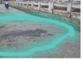
થવાની પૂરેપૂરી આશંકા છે. કોઈ વાહનચાલક પોતાનો જીવ ગુમાવે તે પહેલાં સંબંધિત તંત્ર જાગે અને આ જીવલેણ ખાડાઓનું તાત્કાલિક મરામત કામ કરે તેવી લોક માંગ ઉઠી છે.

દામનગરમાં જિલ્લા પંચાયતના માર્ગ અને મકાન વિભાગ દ્વારા રૂ. દોઢ કરોડના ભારે ખર્ચે નવનિર્મિત ૨૧ નાળા વાળો પુલ અત્યારે ભારે જોખમી બન્યો છે. આ નવા પુલ પર ટૂંકા અંતરે મોટા ખાડા પડી ગયા છે. ચોવીસ કલાક સતત વાહનોથી ધમધમતા આ મુખ્ય માર્ગ પર ગમે ત્યારે ગમખવાર અકસ્માત