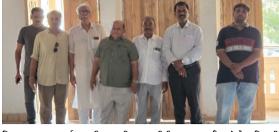
વિગતવાર ચર્ચા કરી હતી. રિનોવેશનમાં ક્યા પ્રકારનું મટીરીયલ વપરાઈ રહ્યું છે સહિતની ચર્ચા કરવામાં આવી હતી. આ

અમરેલીના ઐતિહાસિક રાજમહેલ ખાતે ચાલી રહેલા રિનોવેશન કામની અમરેલી ડિસ્ટ્રિક્ટ ચેમ્બર તેમજ મોટા બસ સ્ટેન્ડ વેપારી એસોસિએશનના સભ્યોએ મુલાકાત લીધી હતી. મુલાકાત દરમિયાન સભ્યોએ કામ સંબંધિત કોન્ટ્રાક્ટ સાથે