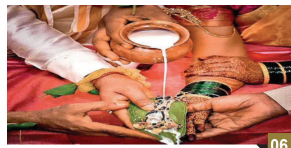
લાગો તો તીર : -“લગ્ન એ લાકડાનો લાડું છે, નથી ખાતા એ પસ્તાય છે”

ભારતના નાગરિક કોણ ગણાય ? ભારતના વિદેશ મંત્રાલયે હમણાં સ્પષ્ટતા કરી કે, ભારતીય પાસપોર્ટ ભારતના નાગરિક હોવાનો પુરાવો નથી પણ માત્ર એક ટ્રાવેલ ડોક્યુમેન્ટ છે. વિદેશ મંત્રાલયે કહ્યું છે કે, ભારત સરકારે આપેલો પાસપોર્ટ વિદેશ જનારા ભારતીયોની ભારતીય તરીકેની ઓળખ સ્થાપિત કરે છે અને પાસપોર્ટ આપવાનો ઉદ્દેશ આંતરરાષ્ટ્રીય મુસાફરી શક્ય બનાવવાનો છે તેથી તેને નાગરિકતાનો પુરાવો ના ગણી શકાય.