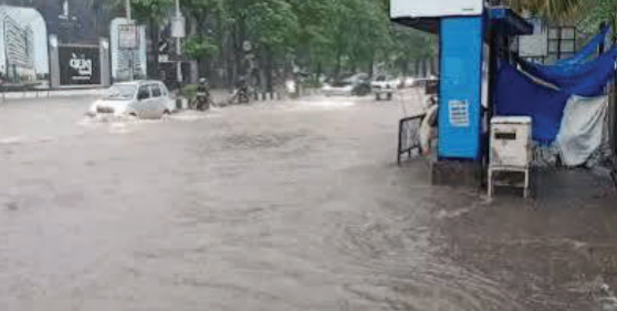
૩.૬૬ ઈંચ વરસાદ વરસતા અનેક વિસ્તારોમાં પાણી ભરાઈ ગયા હતા. કેટલાક ઘરોમાં વરસાદી પાણી ઘૂસી જતાં ઘરવખરી અને અન્ય સામાનને નુકસાન પહોંચ્યું હતું. સુરતમાં પણ છેલ્લા ૧૫ દિવસથી વરસાદની રાહ જોવાઈ રહી હતી. આખરે

નોંધાઈ હતી. જોકે હવે હવામાન વિભાગે રાજ્ય માટે રાહતના સમાચાર આપ્યા છે. જુલાઈ મહિનાની શરૂઆતથી ગુજરાતના અનેક વિસ્તારોમાં ભારેથી અતિભારે વરસાદ પડવાની શક્યતા વ્યક્ત કરવામાં આવી છે. હવામાન વિભાગના અનુમાન મુજબ આવતીકાલ ૧ જુલાઈથી રાજ્યના વિવિધ જિલ્લાઓમાં વરસાદનું જોર વધશે. કેટલાક વિસ્તારોમાં ભારે વરસાદની સાથે તેજ પવન ફૂંકાવાની તેમજ વીજળી પડવાની પણ સંભાવના દર્શાવવામાં આવી છે. આ આગાહીને પગલે વહીવટી તંત્રને પણ સાવચેત રહેવા સૂચના આપવામાં આવી છે. બીજી તરફ આજે સવારે ૬ વાગ્યાથી બપોરે ૧૨ વાગ્યા સુધીમાં રાજ્યના પૃથ્થક તાલુકાઓમાં વરસાદ નોંધાયો હતો. સૌથી વધુ વરસાદ સુરત જિલ્લામાં નોંધાયો હતો, જ્યાં