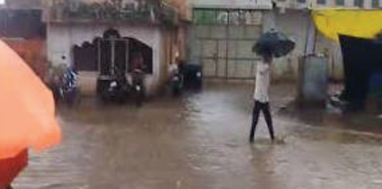
ચેકડેમ સિઝનના પ્રથમ સારા વરસાદમાં જ છલકાઈ ગયો હતો, જેના કારણે આસપાસના વિસ્તારમાં પાણીનો સારો જથ્થો ઉપલબ્ધ બનશે અને સ્થાનિકોને લાભ મળશે. તાલુકાના લુવારા, ગોરડકા, વંડા, પીઠવડી, વિજપડી સહિતના ગામોમાં એક ઈંચ જેટલો વરસાદ વરસ્યો હતો. બીજી તરફ રાજુલા તાલુકાના

અમરેલી, તા.૩૦ સાવરકુંડલા શહેરમાં ધોધમાર વરસાદના બે રાઉન્ડ આવતા કુલ ૩ ઈંચ જેટલો વરસાદ નોંધાયો હતો. ભારે વરસાદને કારણે શહેરમાંથી પસાર થતી નાવલી નદીમાં પૂર જેવી સ્થિતિ સર્જાઈ હતી. શહેરના અનેક રસ્તાઓ પર વરસાદી પાણી ભરાઈ જતા વાહનચાલકો અને સ્થાનિક લોકોને હાલાકીનો સામનો કરવો પડ્યો હતો. સાવરકુંડલા નજીક તાત્કાલિક હનુમાન આશ્રમ પાસે આવેલો