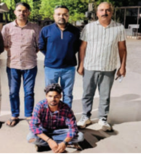
હુકમથી પેરોલ રજા પર મુક્ત થયેલા કેદીને ઝડપી પાડ્યો છે.

બાતમી અને ટેકનિકલ સોર્સના આધારે કેદીને મુંબઈથી ઝડપી જેલ હવાલે કર્યો અમરેલી, તા. ૩૦ અમરેલી જિલ્લામાં ગંભીર ગુનાઓ આચરી નાસતા ફરતા અને જેલમાંથી પેરોલ/ફલો કે વચગાળાના જામીન પરથી ફરાર થયેલા કેદીઓને પકડવા