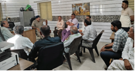
સાથે વિસ્તૃત ચર્ચા કરવામાં આવી હતી. આ બેઠકનો મુખ્ય હેતુ લીલીયા તાલુકામાં કાયદો અને વ્યવસ્થાની પરિસ્થિતિ જાળવી રાખવાનો તેમજ તમામ ધર્મના લોકો પરંપરાગત રીતે