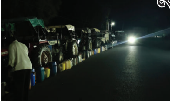
કિલોમીટર લાંબી લાઈનો જોવા મળી રહી છે. ખેડૂતોને

કુંકાવાવ પંથકમાં વર્તમાન સમયમાં ખેતી બચાવવા માટે અત્યંત જરૂરી એવા ડીઝલની તીવ્ર અછત સર્જાઈ છે. આ ગંભીર પરિસ્થિતિને કારણે ખેડૂતો પોતાના ઘરબાર અને ખેતીકામ અધવચ્ચે છોડીને રસ્તા પર ઉતરી આવ્યા છે. કુંકાવાવમાં ડીઝલ મેળવવા માટે ટ્રેક્ટરો અને કેરબાઓની