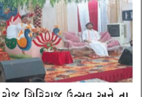
રોજ ગિરિરાજ ઉત્સવ અને તા. ૩૦ના રોજ રુકમિણી વિવાહ પ્રસંગ ધામધૂમથી ઉજવાશે. દરરોજ બપોરે ૪ થી ૭ કલાકના વચનામૃતનું વ્યાખ્યાન યોજાય છે. સમગ્ર વૈષ્ણવ સમાજ કથાનો લહાવો લઈ રહ્યો છે.