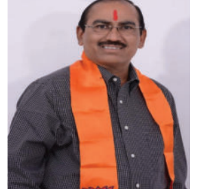
કલ્પસર યોજના એ સૌરાષ્ટ્ર માટે આશાનું નવું કિરણ

ગુજરાતના મહત્વકાંક્ષી કલ્પસર પ્રોજેક્ટને ફરી એકવાર નવો વેગ મળ્યો છે. પૂર્વ કેબિનેટ મંત્રી અને ખેડૂત નેતા બાવકુ ઊંધાડ દ્વારા કેન્દ્ર અને રાજ્ય સરકારમાં સતત કરવામાં આવેલી રજૂઆતો રંગ લાવી છે. નર્મદા અને કલ્પસર વિભાગના જણાવ્યા અનુસાર, હાલમાં આ પ્રોજેક્ટના અહેવાલની જવાબદારી ચેન્નઈની 'નેશનલ સેન્ટર ફોર કોસ્ટલ રિસર્ચ' (NCCR) સંસ્થાને સોંપવામાં આવી છે. આ સાથે જ પ્રધાનમંત્રી નરેન્દ્ર મોદીની તાજેતરની નેધરલેન્ડ મુલાકાત અને ત્યાંના અફસ્લુટડાઈક બંધની આધુનિક ટેકનોલોજીના નિરીક્ષણ બાદ આ ડ્રિમ પ્રોજેક્ટ સાકાર થવાની આશા પ્રબળ બની છે. જો ભાવનગરના ધોધાથી દહેજ વચ્ચે અંદાજે ૩૦ કિલોમીટર લાંબો ૩મ