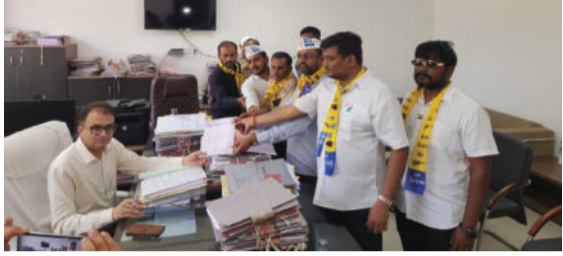
નેતૃત્વ હેઠળ મોટી સંખ્યામાં હોદ્દેદારો ઉપસ્થિત રહ્યા હતા. આ આવેદનપત્રમાં ખેડૂતો, ટ્રાન્સપોર્ટરો અને સામાન્ય નાગરિકોને ભોગવવી પડી રહેલી ગંભીર સમસ્યાઓ અંગે સરકારનું ધ્યાન દોરવામાં