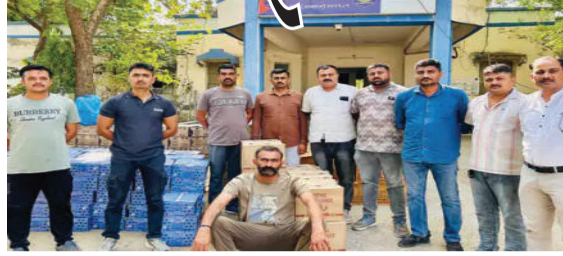
પાડ્યો છે. ખેતરમાં ઉભેલા એક અશોક લેલન ટ્રકમાંથી તપાસ દરમિયાન વિદેશી દારૂની કુલ

ધારી, તા. ૨૧ ધારી તાલુકાના માણાવાવ ગામ નજીક આંબરડી તરફ જતા કાચા રસ્તા પર આવેલી એક વાડીમાં પોલીસે ભાતમીને આધારે સફળ દરોડો પાડ્યો હતો. આ કાર્યવાહી દરમિયાન દારૂનું કિંદગ થાય તે પહેલા જ પોલીસે રૂપિયા ૪૬.૫૨ લાખની કુલ કિંમતનો વિદેશી દારૂનો મોટો જથ્થો ઝડપી