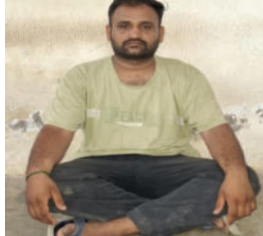
અંગેની દરખાસ્ત માન્ય

અમરેલી જિલ્લામાં અસામાજિક પ્રવૃત્તિઓ અને પ્રોહિબિશનના ગુનાઓ રોકવા માટે પોલીસ તંત્ર દ્વારા કડક કાયદાકીય કાર્યવાહી હાથ ધરવામાં આવી છે, જે અંતર્ગત એક બુટલેગર સામે પાસા (PASA) હેઠળ પગલાં લેવાયાં છે. એક કેસમાં અમરેલી એલ.સી.બી.એ જિલ્લામાં પ્રોહિબિશન સંબંધી ગુનાઓમાં સંડોવાયેલ ઈસમ વિરૂધ્ધ પાસા અંગે દરખાસ્ત તૈયાર કરી હતી. અમરેલી જિલ્લા મેજિસ્ટ્રેટ આ પાસા