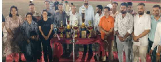
કુલ ૪૮ ટીમો ભાગ લઈ રહી છે. શહેરની મહિલા ક્રિકેટ ખેલાડીઓની બે ટીમો વચ્ચે રોમાંચક પ્રારંભિક મેચ