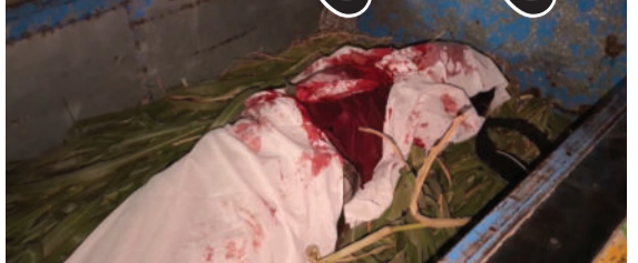
બાઈક ચાલક યુવાનને માથાના ભાગે અત્યંત ગંભીર ઈજાઓ પહોંચતા તેનું ઘટનાસ્થળે જ કમકમાટીભર્યું મોત નીપજ્યું હતું. અકસ્માતની જાણ થતાં જ

વડિયા, તા. ૨૦ અમરેલી જિલ્લાના છેવાડાના તાલુકા મથક વડિયાથી ચારણીયા તરફ જવાના રોડ પર રાત્રિના આશરે નવ વાગ્યે એક ભયાનક અકસ્માત સર્જાયો હતો. એક પરપ્રાંતિય મજૂર યુવાન પોતાનું બાઈક લઈને વડિયા તરફ આવી રહ્યો હતો, ત્યારે પૂરપાટ ઝડપે ધસી આવેલી એક ઈકો કારે તેને જોરદાર હડકંટે લીધો હતો. આ અકસ્માતમાં