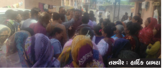
લગાવી પોતાનો આકોશ ઢાલવ્યો હતો. આ સમગ્ર મામલે જ્યારે પાણી વિતરક કર્મચારીને પૂછવામાં આવ્યું, ત્યારે તેણે ટેકનિકલ ખામીનું બહાનું કાઢતા જણાવ્યું કે મોટરનું સ્ટાર્ટર બળી ગયું છે. જો કે, ત્યાં હાજર એક જાગૃત નાગરિકે જ્યારે ઘટનાસ્થળે જઈને પાતરી કરી, ત્યારે પાણીની મોટર બિલકુલ ચાલુ હાલતમાં જોવા મળી

બગસરા નગરપાલિકા દ્વારા મંગળવારે જ નવા પ્રમુખની વરણી કરવામાં આવી હતી, પરંતુ આ જ દિવસે પાલિકાની વહીવટી શિથિલતા પણ સપાટી પર આવી ગઈ છે. શહેરના આવાસ કોલોની વિસ્તારમાં લાંબા સમયથી અનિયમિત પાણી મળતું હોવાના કારણે સ્થાનિક મહિલાઓએ ભારે હોબાળો મચાવ્યો હતો અને પાલિકા વિરુદ્ધ 'હાય હાય' ના નારા