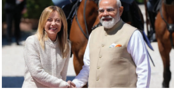
સંબંધોને નવી ઊંચાઈ આપવા માટે વર્ષ ૨૦૨૮ સુધીમાં દ્વિપક્ષીય વેપારને વર્તમાન ૧૪ બિલિયન યુરોથી વધારીને ૨૦ બિલિયન યુરો (આશરે ૨,૨૪૧.૮૫ લાખ રૂપિયા) કરવાનો લક્ષ્યાંક રાખવામાં આવ્યો છે. વડાપ્રધાન મેલોનીએ જણાવ્યું કે, ભારત અને યુરોપિયન યુનિયન વચ્ચેના મુક્ત વેપાર કરાર (FTA) આ લક્ષ્યને પ્રાપ્ત કરવામાં મહત્વની ભૂમિકા ભજવશે. હાલમાં ૪૦૦થી વધુ ઈટાલિયન

મજબૂત પગલાં લે છે." તેમણે ઉમેર્યું કે આતંકવાદના ટેરર ફંડિંગ (ભંડોળ) સામે લડવામાં ઈટાલી હંમેશા ભારતની સાથે ઊભું રહ્યું છે. બીજી તરફ, વડાપ્રધાન મેલોનીએ ઈન્ડો-પેસિફિક (પ્રશાંત) ક્ષેત્રમાં મુક્ત નેવિગેશનની સ્વતંત્રતા અને વૈશ્વિક સુરક્ષા પર ભાર મૂક્યો હતો. બંને દેશો વચ્ચેના આર્થિક