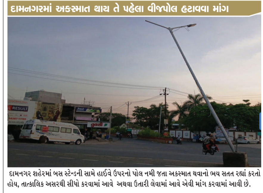
દામનગરમાં અકસ્માત થાય તે પહેલા વીજપોલ હટાવવા માંગ

વાસ્તવમાં વર્ષ ૨૦૨૬ છે. આમ, ઘઉંની ખરીદીની આખરી મુદત ૧૫.૦૫.૨૦૨૬થી વધારીને હવે ૧૫.૦૬.૨૦૨૬ સુધી લંબાવવામાં આવી છે. આ મહત્વપૂર્ણ નિર્ણય અંગે અમરેલીના નાયબ જિલ્લા મેનેજરશ્રીએ સત્તાવાર યાદી જાહેર કરીને તમામ ખેડૂત મિત્રોને આ સુધારા સાથેની નવી મુદતની નોંધ લેવા ખાસ અનુરોધ કર્યો છે.