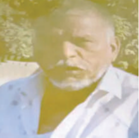
ઘટનાની ગંભીરતા જોઈને સ્થાનિક પોલીસ અને કાર્ડમ બ્રાન્ચની ટીમો દોડતી થઈ છે.

પોલીસે બંને મૃતદેહોને પોસ્ટમોર્ટમ અને ફોરેન્સિક તપાસ માટે મોકલી આપ્યા છે. આ મામલે કાર્યવાહી કરતા પોલીસે ગેરકાયદે દેશી દારૂ વેચનારા એક આરોપીની ધરપકડ કરી છે અને તેની પાસેથી દારૂના નમૂના જપ્ત કર્યાં છે. આ દુર્ઘટનાને પગલે સ્થાનિક રહીશોમાં ભારે રોષ છે અને ગેરકાયદે દારૂના વેચાણ સામે કડક પગલાં ભરવાની માંગ ઉઠી છે.