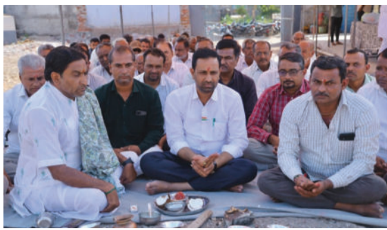
કટિબદ્ધ છે. વડીયા વિસ્તારના યુવાનોને ઉચ્ચ શિક્ષણ માટે બહાર ન જવું પડે તે હેતુથી

અમરેલી, તા. ૧૮ રાજ્યના ઊર્જા અને કાયદો રાજ્ય મંત્રી કૌશિકભાઈ વેકરીયાના હસ્તે મહત્વના વિકાસકાર્યો સંપન્ન થયા છે. રવિવારે વડીયા તાલુકાના ઢુંટીયાપીપળીયા ગામે અંદાજે રૂપિયા ૧.૨૫ કરોડના ખર્ચે સાકાર થનારી પ્રાથમિક શાળાના નવા ભવનનું શાસ્ત્રોક્ત વિધિથી ખાતમુહૂર્ત કરવામાં આવ્યું હતું. આ સાથે જ વડીયા શહેરમાં