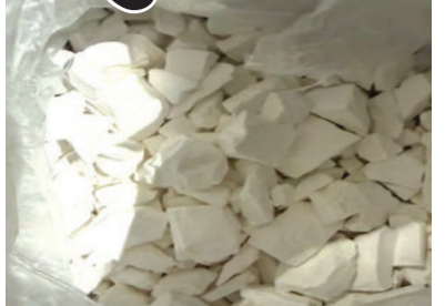
૪૫થી ૫૦ કરોડ આંકવામાં આવી રહી છે. ઝડપાયેલો મુસાફર મૂળ કેરળનો વતની હોવાનું સામે આવ્યું છે.

અમદાવાદ, તા. ૧૮ અમદાવાદ આંતરરાષ્ટ્રીય એરપોર્ટ પર દાણચોરીની વધતી જતી પ્રવૃત્તિઓને રોકવા માટે કસ્ટમ્સ અધિકારીઓ સંપૂર્ણપણે સાવચેત થઈ ગયા છે. ડ્રગ્સની હેરાફેરી સામે કડક કાર્યવાહીના ભાગરૂપે, કસ્ટમ્સ વિભાગે મલેશિયાના કુઆલાલંપુરથી એર એશિયાની ફ્લાઈટ દ્વારા અમદાવાદ આવેલા એક મુસાફરને