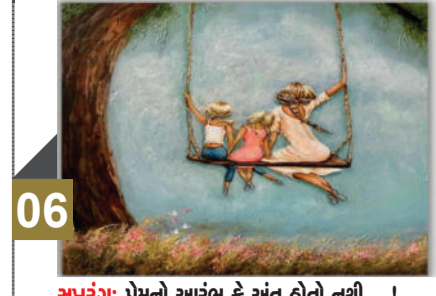
સમરંગ: પ્રેમનો આરંભ કે અંત હોતો નથી...!