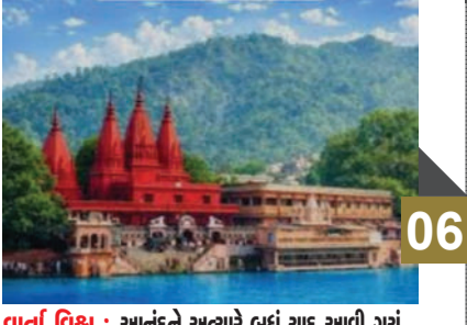
વર્તા વિશ્વ : આનંદને અચારે બહુ યાદ આવી ગયું