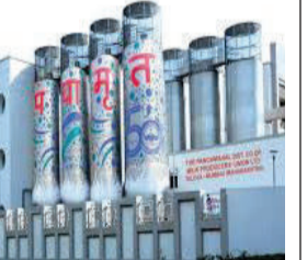
રૂ. ૮૭૫ થશે. પશુઆહાર અને મોંઘવારીના સમયમાં ડેરીનો આ નિર્ણય પશુપાલકોને આર્થિક રીતે મજબૂત બનાવશે.

પંચમહાલ, દાહોદ અને મહીસાગર જિલ્લાના અઢી લાખથી વધુ પશુપાલકો માટે ખુશીના સમાચાર છે. પંચામૃત ડેરીએ દૂધના ખરીદી ભાવમાં પ્રતિ કિલો ફેટે રૂ. ૧૦નો વધારો જાહેર કર્યો છે. અત્યાર સુધી પશુપાલકોને પ્રતિ કિલો ફેટના રૂ. ૮૬૫ ચૂકવવામાં આવતા હતા, જે હવે ૧ જૂનથી વધીને