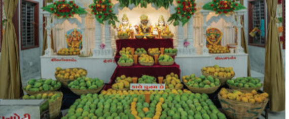
ઉપસ્થિત રહી દર્શન, ભજન અને પ્રસાદનો લાભ લીધો હતો. સ્વામિનારાયણ વડતાલ ગાદીના આચાર્ય અજેન્દ્રપ્રસાદજી મહારાજ

કોડીનારના છારા ગાંપા વિસ્તારમાં સ્ટેડિયમ રોડ પર આવેલા સ્વામિનારાયણ મુખ્ય મંદિર (SVG) ખાતે અધિક માસ નિમિત્તે ભવ્ય 'કેરી મનોરથ ઉત્સવ' તથા સંગીતમય સુંદરકાંડ પાઠનું આયોજન કરવામાં આવ્યું હતું. આ ધાર્મિક મહોત્સવમાં કોડીનાર તેમજ આસપાસના ગ્રામ્ય વિસ્તારોમાંથી મોટી સંખ્યામાં હરિભક્તો