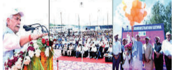
કરવા ૧૦૦ દિવસનું લક્ષ્યાંકિત અભિયાન શરૂ કરાયું છે. છેલ્લા ૫૦ દિવસમાં તંત્ર દ્વારા ૮૫૬ દાણચોરો સામે એકઠાઈઆર નોંધી ૮૪ ની

જમ્મુ અને કાશ્મીરના લેફ્ટનન્ટ ગવર્નર મનોજ સિન્હાએ ડ્રગ ડીલરો સામે "યુધ્ધ" છેડ્યું છે. તેમણે પાકિસ્તાનને ચેતવણી આપતા જણાવ્યું કે, જમ્મુ-કાશ્મીરમાં ડ્રગ્સની નર્સરીને આતંકનું જંગલ બનવા દેવામાં આવશે નહીં. પાકિસ્તાન હવે સ્થાનિક યુવાનોને ડ્રગ્સના રવાડે ચઢાવી આતંકવાદ તરફ વાળવાનું કાવતરું ઘડી રહ્યું છે, જેને નાબૂદ