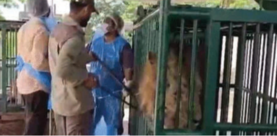
એનિમલ કેર સેન્ટરની મુલાકાત સહિતના ઉચ્ચ અધિકારીઓ સાથે કટોકટીની બેઠક યોજીને સિંહોની વર્તમાન સ્થિતિ અને સારવાર