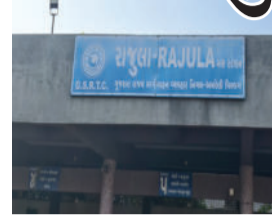
કલાકે ઉપડતા મુસાફરો અટવાયા હતા. ડેપો મેનેજરને ટેલિફોનિક જાણ કરવા છતાં કોઈ યોગ્ય વ્યવસ્થા કરવામાં આવી

રાજુલા, તા.૩૧ અમરેલી જિલ્લાના રાજુલા એસટી ડેપોમાં અધિકારીઓના અણધર વહીવટને કારણે મુસાફરો ભારે હાલાકી ભોગવી રહ્યા છે. તારીખ ૩૧.૦૫.૨૦૨૬ના રોજ વહીવી સવારે ૪:૫૫ કલાકે ઉપડતી રાજુલા-ભાવનગર બસ બે કલાક મોડી, એટલે કે સવારે ૦૬:૧૦