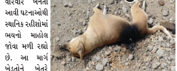
વારંવાર બનતી આવી ઘટનાઓથી સ્થાનિક રહીશોમાં ભયનો માહોલ જોવા મળી રહ્યો છે. આ માર્ગ ખેડૂતોને ખેતરે જવા માટેનો મુખ્ય રસ્તો છે અને અવરજવર રહે છે. સદનસીબે કોઈ નજીકમાં જ શળા આવેલી હોવાથી માનવ જાનહાનિ થઈ નથી, પરંતુ અહીંથી નાના બાળકો, વિદ્યાર્થીઓ અને રાહદારીઓની સતત ભારે રોષ વ્યાપ્યો છે.

ધોરાજીના હિરપરા વાડી અને કેલાશ નગર વિસ્તાર નજીક વહેલી સવારે એક શ્વાનનો મૃતદેહ અત્યંત બળેલી હાલતમાં મળી આવ્યો હતો. ઉપરથી પસાર થતો વીજ કંપનીનો જીવતો તાર તૂટીને નીચે પડવાના કારણે આ અકસ્માત સર્જાયો હતો. સ્થાનિકોના જણાવ્યા અનુસાર, થોડા સમય પહેલાં પણ આ જ જગ્યાએ કરંટાથી ગાયનું મોત નીપજ્યું હતું.