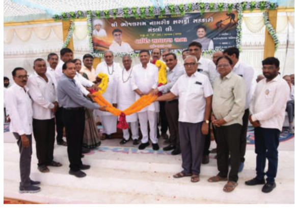
લાઠી, તા. ૩૧

શ્રી ભોજલરામ નાગરિક શરાફી સહકારી મંડળી લિ.ની વર્ષ ૨૦૨૫-૨૬ની વાર્ષિક સાધારણ સભા લાઠીના શેખ પીપરિયા ખાતે ઉત્સાહભેર યોજાઈ હતી. સભામાં મોટી સંખ્યામાં સભાસદોએ હાજરી