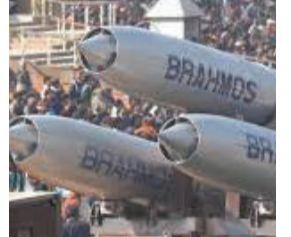
આ ઉપરાંત, ઈન્ડોનેશિયા સાથે પણ આવો જ કરાર તેના અંતિમ તબક્કામાં છે.