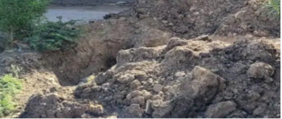
કિકાણી પ્લોટ, ઉમિયા મંદિર અને પાનસુરીયા પ્લોટ જેવા

લીલીયા શહેરમાં કેન્દ્ર સરકારની મહત્વાકાંક્ષી 'નલ સે જલ' યોજના અંતર્ગત હાઉસ કનેક્શન આપવાની કામગીરી હાલ સ્થાનિકો માટે આશીર્વાદને બદલે આફત સમાન બની ગઈ છે. છેલ્લા એક મહિનાથી