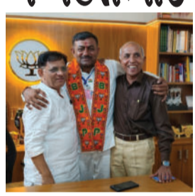
માનતા જણાવ્યું હતું કે, આ જીત જનસમર્થન અને વિકાસના કાર્યોનું પરિણામ છે.