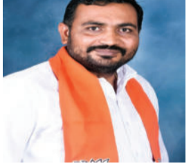
ખેત મજૂરો અને ગ્રામ્ય જનતાએ વિકાસ અને વિશ્વાસના માર્ગને