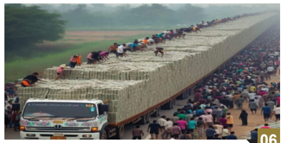
લાગે તો તીર : - ભલે ગરીબનો રોટલાનો ટૂંકડો અને છાંસ મળે. પણ..

મતાનો અસ્ત નજીક છે? દેશનાં પાંચ રાજ્યો પશ્ચિમ બંગાળ, તમિલનાડુ, કેરળ, આસામ અને પુડુચેરીની ચૂંટણીમાં સૌથી વધારે ચર્ચા પશ્ચિમ બંગાળની છે. બાકીનાં ૪ રાજ્યોમાં મતદાન પતી ગયું છે અને આજે ૨૯ એપ્રિલે પશ્ચિમ બંગાળમાં બીજા તબક્કાનું મતદાન પતશે એ પછી સૌની નજર ૪ મેના રોજ જાહેર થનારાં પરિણામો પર હશે. તેમાં પણ સૌને વધારે રસ પશ્ચિમ બંગાળમાં છે કેમ કે બંગાળમાં મમતા બેનરજીને પછાડવા ભાજપ પૂરી તાકાત લગાવી દીધી છે. કેન્દ્રીય ગૃહ મંત્રી અમિત શાહે તો બંગાળમાં ધામા જાંપી દીધા છે એને એકદમ આક્રમક પ્રચાર કર્યો છે.