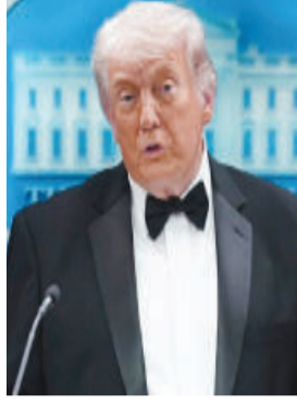
ગઈ. એક સુરક્ષા અધિકારીને ગોળી વાગ્યાની માહિતી મળી છે, પરંતુ બુલેટપ્રૂફ જાકેટના કારણે જાનહાનિ ટળી. આ ઘટનાની

ટોરેન્સનો રહેવાસી છે. તેના પાસેથી શોટગન, હેન્ડગન અને અન્ય હથિયારો મળી આવ્યા હતા. હુમલાના હેતુ અંગે હજી સુધી સ્પષ્ટ માહિતી મળી નથી, પરંતુ એફબીઆઈ દ્વારા ઘટનાની ઊંડાણપૂર્વક તપાસ હાથ ધરવામાં આવી છે. હુમલા બાદ ટ્રમ્પે જણાવ્યું કે રાષ્ટ્રપતિ પદ હંમેશા જોખમી રહ્યું છે અને આવા પ્રયાસો તેમની કામગીરીનો ભાગ છે. તેમણે સુરક્ષા દળોની પ્રશંસા કરી અને કહ્યું કે તેમની ઝડપી કામગીરીથી મોટી દુર્ઘટના ટળી