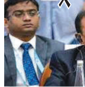
વચ્ચેના તણાવ બાદ સમગ્ર વિસ્તારમાં ઊભી થયેલી સુરક્ષા ચિંતાઓ, આર્થિક હિતો અને દ્વિપક્ષીય સંકલન મુદ્દાઓ પર ખાસ ધ્યાન કેન્દ્રિત કરવામાં આવ્યું. ડોભાલની આ મુલાકાત ભારત દ્વારા ગલ્ફ દેશો સાથેના વ્યૂહાત્મક

મધ્ય પૂર્વમાં વધતા તણાવ વચ્ચે ભારતના રાષ્ટ્રીય સુરક્ષા સલાહકાર અજિત ડોભાલ ગલ્ફ પ્રવાસના ભાગરૂપે અબુ ધાબી પહોંચ્યા અને યુનાઈટેડ અરબ એમિરેટ્સના રાષ્ટ્રપતિ શેખ મોહમ્મદ બિન ઝાયેદ અલ નાહ્યાન સાથે મહત્વપૂર્ણ બેઠક કરી. આ મુલાકાત દરમિયાન બંને પક્ષોએ પશ્ચિમ એશિયાની વર્તમાન પરિસ્થિતિ, પ્રાદેશિક સ્થિતિ અને ચાલી રહેલા ભૂ-રાજકીય વિકાસ પર વિસ્તૃત ચર્ચા કરી. મીડિયા અહેવાલો મુજબ, ઈઝરાયલ-ઈરાન