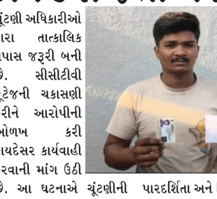
ચૂંટણી અધિકારીઓ દ્વારા તાત્કાલિક તપાસ જરૂરી બની છે. સીસીટીવી ફૂટેજની ચકાસણી કરીને આરોપીની ઓળખ કરી કાયદેસર કાર્યવાહી કરવાની માંગ ઉઠી છે. આ ઘટનાએ ચૂંટણીની પારદર્શિતા અને વિશ્વસનીયતા