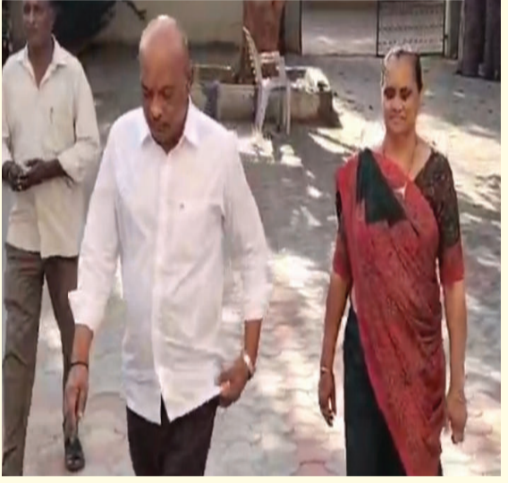
અમરેલીના સાંસદ ભરત સુતરીયાએ કર્યું મતદાન

અમરેલીના સાંસદ સુતરીયાએ પોતાના વતન જરબિયા ગામે સજોડે મતદાન કર્યું હતું. સ્થાનિક સ્વરાજ્યની ચૂંટણીમાં વિકાસ માટે મતદાન કરવા અપીલ કરી જણાવ્યું હતું કે, મતદાન કરવું એ મતદારોનો અધિકાર અને ફરજ પણ છે.