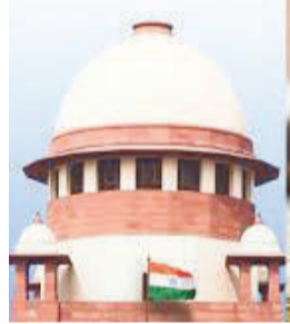
શરૂઆતમાં નીચલી અદાલતે તેને નિર્દોષ જાહેર કરી હતી, પરંતુ બાદમાં પટણા હાઈકોર્ટે આ નિર્ણયને પલટાવી તેને દોષિત ઠેરવી સજા ફટકારી હતી. સુનાવણી દરમિયાન રજૂ કરાયેલ માહિતી અનુસાર, જપ્ત કરાયેલ

ભ્રષ્ટાચાર નિવારણ કાયદા હેઠળના એક કેસમાં સુપ્રીમ કોર્ટે ઉંદરોએ જપ્ત કરાયેલ લાંચની રકમ નાશ કરી હોવાના દાવા પર આશ્ચર્ય વ્યક્ત કર્યું છે. ન્યાયમૂર્તિ જે.બી. પારડીવાલા અને ન્યાયમૂર્તિ કે.વી. વિશ્વનાથનની બેન્ચે નોંધ્યું કે આવી પરિસ્થિતિ રાજ્ય માટે ગંભીર મહેસૂલ નુકસાનનું કારણ બની શકે છે. અહેવાલ મુજબ, કેસમાં આરોપી મહેલા બાળ વિકાસ કાર્યક્રમ અધિકારી પર ૧૦,૦૦૦ રૂપિયાની લાંચ માંગવાનો આરોપ હતો.