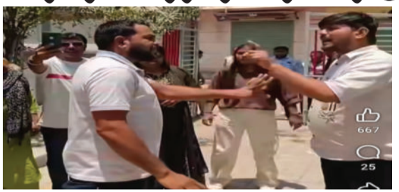
જ્યારે 'આપ'ના કાર્યકર ડાઉન્ટ કાર્યો કે ભાજપ દ્વારા મતદાન વઘાસીયાએ સોશિયલ મીડિયા દ્વારા ગંભીર આક્ષેપ

અમરેલી,તા.૨૬ અમરેલી જિલ્લાની મોટા આંકડીયા બેઠક પર મતદાન પ્રક્રિયા દરમિયાન રાજકીય ગરમાવો જોવા મળ્યો હતો. ભાજપ અને આમ આદમી પાર્ટી (AAP) ના કાર્યકરો સામસામે આવી જતાં મતદાન મથક પર હોબાળો મચ્યો હતો. વિવાદની શરૂઆત ત્યારે થઈ