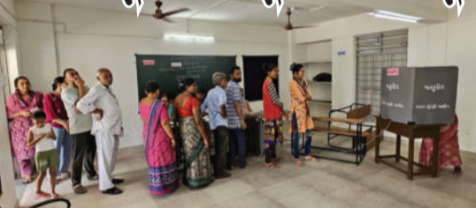
ઉમેદવાર અને જિલ્લા પંચાયતની ૨ બેઠકો માટે ૬ ઉમેદવારો મેદાનમાં રહ્યા હતા. ચૂંટણી દરમિયાન પોલીસ દ્વારા ચાંપતો બંદોબસ્ત ગોઠવવામાં આવ્યો હતો. ખાસ કરીને વૃદ્ધ અને અશક્ત મતદારોને પોલીસકર્મીઓએ સહારો આપી મતદાન મથક સુધી પહોંચાડ્યા હતા.

બગસરા,તા.૨૬ બગસરા પંથકમાં સ્થાનિક સ્વરાજ્યની ચૂંટણી શાંતિપૂર્ણ માહોલમાં પૂર્ણ થઈ હતી. નગરપાલિકામાં કુલ ૫૮.૨૯ ટકા મતદાન નોંધાયું હતું, જ્યારે તાલુકા વિસ્તારમાં ૫૪.૧ ટકા મતદાન થયું હતું. નગરપાલિકાની ૨૮ બેઠકો માટે કુલ ૮૭ ઉમેદવારોનો ભાવિ ઈવીએમમાં સીલ થયું છે. તાલુકા પંચાયતની ૧૬ બેઠકો માટે ૪૭