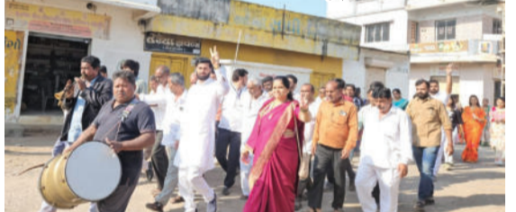
અને શરણાઈના નાદ સાથે મતદાતાઓ ઉત્સાહપૂર્વક મતદાન કેન્દ્ર સુધી પહોંચ્યા હતા. યુવાનો, મહિલાઓ અને વડીલો સહિત તમામ વર્ગના લોકોએ મતદાનમાં ભાગ લીધો હતો. આ રીતે સામૂહિક મતદાન દ્વારા લોકશાહીનું મહત્વ ઉજાગર કરવામાં આવ્યું હતું.