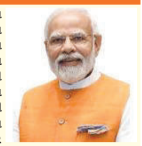
વોશિંગ્ટન ડીસીમાં આયોજિત 'વ્હાઈટ હાઉસ કોરસપોન્ડન્સ ડિનર'માં ગોળીબારની ઘટના બની, જેમાં રાષ્ટ્રપતિ ડોનાલ્ડ ટ્રમ્પ અને અન્ય નેતાઓ સુરક્ષિત બચી ગયા છે. હુમલાખોર કોલ થોમસ એલનની ધરપકડ કરવામાં આવી છે. આ હિંસક ઘટનાની નિંદા કરતા વડાપ્રધાન નરેન્દ્ર મોદીએ દિવર પર જણાવ્યું કે, 'લોકશાહીમાં હિંસાને કોઈ સ્થાન નથી.' હુમલા દરમિયાન સિકેટ સર્વિસના એક એજન્ટને ગોળી વાગી હતી, પરંતુ બુલેટપ્રૂફ વેસ્ટને કારણે તેમનો જીવ બચી ગયો. આ ઘટના બાદ કાર્યક્રમ રદ કરવામાં આવ્યો છે. પીએમ મોદીએ ટ્રમ્પ અને તેમના પરિવારની સુખાકારી માટે શુભેચ્છાઓ પાઠવી છે.