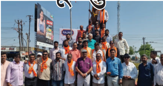
ઈતિહાસના સુવર્ણ અક્ષરે લખાયેલું એક ગૌરવશાળી પ્રકરણ છે. આ પાવન અવસરની

અમરેલી, તા. ૨૬ આગામી વૈશાખ સુદ નવમી અને શનિવારના પવિત્ર દિવસે અપ્રતિમ શૌર્યના પ્રતિક એવા વીર હમીરસિંહજી ગોહિલના બલિદાન દિવસ નિમિત્તે ભવ્ય "વીરોત્સવ"ની ઉજવણી કરવામાં આવી છે. સોમનાથ મહાદેવની રક્ષા કાજે પોતાના પ્રાણોની આહુતિ આપનાર આ વીર કેસરીનું બલિદાન ભારતીય