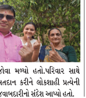
જોવા મળ્યો હતો. પરિવાર સાથે મતદાન કરીને લોકશાહી પ્રત્યેની જવાબદારીનો સંદેશ આપ્યો હતો.