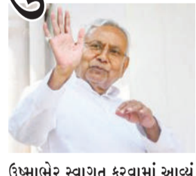
ઉપમાબેર સ્વાગત કરવામાં આવ્યું હતું. તેમણે કાર્યકરોની શુભેચ્છાઓ સ્વીકારી અને કાર્યક્રમ દરમિયાન તેમના પર બનાવવામાં આવેલા ગીત પર તાળીઓ પાડી. સાથે જ સ્ટેજ પર બેઠેલા નેતાઓને પણ

બિહારના મુખ્યમંત્રી પદેથી રાજનામા આપ્યાના ૧૨ દિવસ બાદ નીતિશ કુમાર રવિવારે જદયુ કાર્યાલયે પહોંચ્યા અને ભામાશાહ જયંતિ નિમિત્તે આયોજિત કાર્યક્રમમાં હાજરી આપી. દર વર્ષની જેમ આ પ્રસંગે ખાસ આયોજન કરવામાં આવ્યું હતું, જેમાં પાર્ટીના અનેક નેતાઓ અને કાર્યકરો ઉપસ્થિત રહ્યા હતા. કાર્યાલયે પહોંચતા જ નીતિશ કુમારનું કાર્યકરો દ્વારા