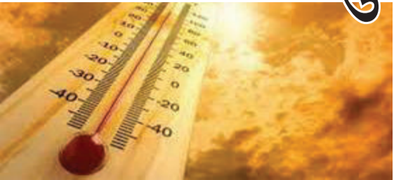
જ્યારે અનેક મતદાતાઓએ પણ બપોર બાદ મતદાન કરવાનું ટાળ્યું હતું. ગત દિવસની સરખામણીએ તાપમાનમાં

અમરેલી જિલ્લામાં ઉનાળાની તીવ્રતા દિવસે ને દિવસે વધતી જઈ રહી છે. સીઝનમાં પ્રથમ વખત શહેરમાં મહત્તમ તાપમાન ૪૪ ડિગ્રી સેલ્સિયસ સુધી પહોંચતા લોકો માટે પરિસ્થિતિ મુશ્કેલ બની છે. બપોરના સમયે અસહ્ય ગરમી અને તાપના કારણે રસ્તાઓ સુમસામ જોવા મળ્યા હતા,