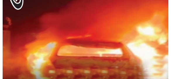
સ્ટેશન વિસ્તારના બડકા મોડ પાસે રાત્રે આશરે સાડા નવ વાગ્યે આ અકસ્માત થયો હતો. ઘટનાની ભયાનકતાનો અંદાજ એ વાત

ઉત્તર પ્રદેશના મિર્ઝાપુર જિલ્લામાં બુધવારે રાત્રે એક અત્યંત હૃદયદ્રાવક માર્ગ અકસ્માત સર્જાયો હતો, જેમાં ડ્રાઈવર સહિત કુલ ૧૧ લોકોએ પોતાના જીવ ગુમાવ્યા છે. મધ્યપ્રદેશથી કપચી ભરીને આવી રહેલા એક બેકાબૂ ટ્રેલરની બ્રેક ફેઈલ થવાને કારણે આ સમગ્ર હોનારત સર્જાઈ હતી. મિર્ઝાપુર-રીવા રાષ્ટ્રીય ધોરીમાર્ગ પર સ્થિત ડૂમડગંજ પોલીસ