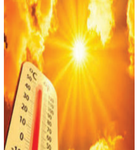
ગણતરીની કામગીરી બપોરે ૧૧ થી ૩ વાગ્યા સુધી સ્થગિત કરી દીધી છે. દિલ્હીની શાળાઓમાં બાળકોને હાઈડ્રેટેડ રાખવા માટે 'વોટર બેલ' સિસ્ટમ અમલમાં

ભારતભરમાં ગરમીનું મોજું (હીટવેવ) આક્રમક બન્યું છે, જેમાં ઓડિશાનું આરસુગુડા અને મહારાષ્ટ્રનું વર્ધા ૪૪.૬ ડિગ્રી સેલ્સિયસ તાપમાન સાથે દેશના સૌથી ગરમ શહેરો નોંધાયા છે. બિહાર, મધ્યપ્રદેશ, રાજસ્થાન અને ઉત્તર પ્રદેશ સહિતના અડધાથી વધુ રાજ્યોમાં પારો ૪૦ થી ૪૫ ડિગ્રીની વચ્ચે રહ્યો છે. તીવ્ર ગરમીને ધ્યાનમાં રાખીને ઓડિશા સરકારે વસ્તી