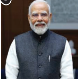
પંચ અને સરકારી કર્મચારીઓની પ્રશંસા કરી હતી. વડાપ્રધાને તૃણમૂલ કોંગ્રેસ (TMC) પર પ્રહાર કરતા કહ્યું કે બંગાળમાં 'જંગલરાજ' અને ભ્રષ્ટાચારનો અંત નજીક છે.

પશ્ચિમ બંગાળના કૃષ્ણનગરમાં આયોજિત 'વિજય સંકલ્પ સભા'ને સંબોધતા વડાપ્રધાન નરેન્દ્ર મોદીએ આત્મવિશ્વાસ વ્યક્ત કર્યો હતો કે ૪ મેના રોજ રાજ્યમાં ભાજપની સરકાર બનવા જઈ રહી છે. પીએમ મોદીએ જણાવ્યું કે, આ ચૂંટણીમાં ભય પર વિશ્વાસનો વિજય થઈ રહ્યો છે અને વર્ષોથી દબાયેલા અવાજો હવે પરિવર્તન માટે એકસૂરે બોલી રહ્યા છે. તેમણે શાંતિપૂર્ણ મતદાન સુનિશ્ચિત કરવા બદલ ચૂંટણી