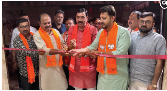
ઉત્સાહ ભર્યો હતો. ત્યારબાદ બગસરામાં નગરપાલિકાના ઉમેદવારો માટે જાહેર સભા અને સાવરકુંડલામાં કાર્યકરો

સ્થાનિક સ્વરાજ્યની ચૂંટણીના માહોલમાં ગુજરાત પ્રદેશ ભાજપના ઉપાધ્યક્ષ ગૌતમભાઈ ગેડિયાએ અમરેલી જિલ્લાના વિવિધ વિસ્તારોમાં સભાઓ ગજવી ભાજપના ઉમેદવારો માટે પ્રચંડ જનસમર્થન માંગ્યું હતું. તેમણે કુકાવાવ ખાતે જિલ્લા અને તાલુકા પંચાયતના ઉમેદવારોના સમર્થનમાં વિરાટ સભા સંબોધી કાર્યકરોમાં