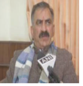
કરવામાં આવી છે. સરકારી નોટિફિકેશન મુજબ, આ વ્યવસ્થા એપ્રિલ ૨૦૨૬ ના પગારથી અમલમાં આવશે.

હિમાચલ પ્રદેશની સુબર્વિવેટર સિંહ સુધુ સરકારે રાજ્યની ડગમગતી આર્થિક સ્થિતિને ધ્યાને પાડવા માટે એક કઠોર વહીવટી નિર્ણય લીધો છે. રાજ્ય પર વધતા દેવા અને નાણાકીય સંકટને પહોંચી વળવા માટે મુખ્યમંત્રી, મંત્રીઓ, ધારાસભ્યો અને ઉચ્ચ અધિકારીઓના પગારનો અમુક હિસ્સો આગામી છ મહિના માટે મુલતવી રાખવાની જાહેરાત