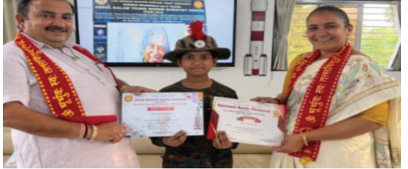
પ્રવૃત્તિઓમાં વિશેષ સિધ્ધિ મેળવનાર ઈકરીઓને મહાનુભાવોના હસ્તે સન્માનિત કરાઈ હતી.કાર્યક્રમનો પ્રારંભ