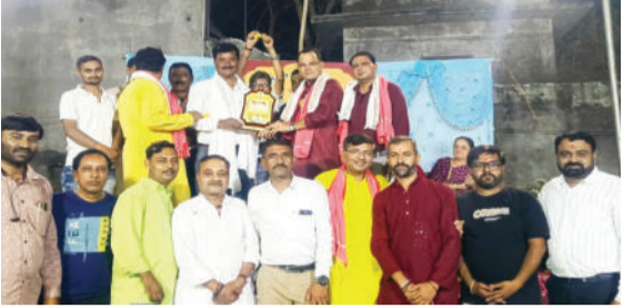
નાદથી વાતાવરણ ગુંજી ઉઠ્યું હતું. પરંપરાગત વસ્ત્રોમાં સજ્જ બ્રહ્મ પરિવારોએ શિસ્તબધ્ધ રીતે રાજમાર્ગો પર

સાવરકુંડલા,તા.૨૦ સાવરકુંડલાની પવિત્ર ધરા પર અક્ષય તૃતીયાના પાવન પર્વે ભગવાન પરશુરામ પ્રાગટ્ય ઉત્સવની અભૂતપૂર્વ ઉજવણી કરવામાં આવી હતી. પરશુરામ સેના દ્વારા આયોજિત આ ભવ્ય શોભાયાત્રામાં સમગ્ર તાલુકામાંથી ઉમટેલા ભૂદેવોના 'જય પરશુરામ' ના ગગનભેદી