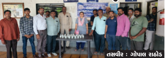
રાજુલા, તા. ૨૦