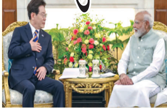
જરૂરિયાતોને ધ્યાનમાં રાખીને, બંને દેશોએ સેમિકન્ડક્ટર, આર્ટિફિશિયલ ઇન્ટેલિજન્સ (AI) અને આઈટી ક્ષેત્રે ભાગીદારી ગાઢ બનાવવા માટે 'ભારત-કોરિયા ડિજિટલ બ્રિજ' શરૂ કરવાની જાહેરાત કરી છે. વધુમાં: આર્થિક સુરક્ષા સંવાદ:

વેપાર $૨૭ બિલિયન સુધી પહોંચ્યો છે. બંને નેતાઓએ સંયુક્ત રીતે નિર્ણય લીધો છે કે ૨૦૩૦ સુધીમાં આ આંકડાને $૫૦ બિલિયન સુધી લઈ જવામાં આવશે. આ લક્ષ્યને પ્રાપ્ત કરવા માટે 'ભારત-કોરિયા નાણાકીય મંચ' અને એક 'ઔદ્યોગિક સહકાર સમિતિ'ની સ્થાપના કરવામાં આવી છે, જે બંને દેશો વચ્ચેના રોકાણ અને નાણાકીય પ્રવાહને વધુ સરળ બનાવશે. આધુનિક યુગની