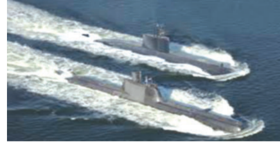
સાથે આ 'પ્રોજેક્ટ 751' (P751) ને અંતિમ સ્વરૂપ આપશે. આ પ્રોજેક્ટ હેઠળ ૭ સબમરીનનું પરંપરાગત સબમરીનનું નિર્માણ મુંબઈના માઝાગોન

ભારત અને જર્મની વચ્ચે સંરક્ષણ ક્ષેત્રે એક ઐતિહાસિક સમજૂતી થવા જઈ રહી છે. અંદાજે રૂ.૭૦,૦૦૦ કરોડથી રૂ. ૯૯,૦૦૦ કરોડના ખર્ચે ૭ અત્યાધુનિક સબમરીન બનાવવા માટેના કરાર પર ટૂંક સમયમાં હસ્તાક્ષર થઈ શકે છે. સંરક્ષણ મંત્રી રાજનાથ સિંહ ૨૧ થી ૨૩ એપ્રિલ દરમિયાન જર્મનીની મુલાકાતે છે, જ્યાં તેઓ જર્મન સંરક્ષણ મંત્રી બોરિસ પિસ્ટોરિયસ