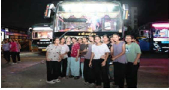
સંકુલ ખાતેથી આ પ્રવાસનો પ્રારંભ થયો હતો. આ પ્રવાસ અંતર્ગત વિદ્યાર્થીનીઓ દ્વારા જવા વિવિધ ધાર્મિક અને શૈક્ષણિક

અમરેલી, તા. ૨૦ શ્રી અમરેલી જિલ્લા લેઉવા પટેલ ચેરીટેબલ ટ્રસ્ટ-સુરત સંચાલિત, શ્રી લેઉવા પટેલ ટ્રસ્ટ માધ્યમિક કન્યા શાળા દ્વારા વિદ્યાર્થીનીઓ માટે એક ભવ્ય શૈક્ષણિક પ્રવાસનું આયોજન કરવામાં આવ્યું હતું. તારીખ ૧૮/૦૪/૨૦૨૬ના રોજ રાત્રે અમરેલી સ્થિત ગજેરા શૈક્ષણિક