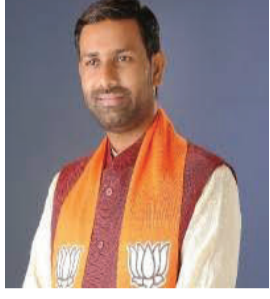
મંત્રી કૌશિક વેકરિયા

અમરેલી, તા. ૨૦ અમરેલીના ધારાસભ્ય અને ગુજરાત રાજ્યના મંત્રી કૌશિક વેકરિયાએ પોતાના મતવિસ્તારમાં આંતરમાળખાકીય સુવિધાઓને વધુ સુદૃઢ બનાવવાના પ્રયાસો તેજ કર્યા છે. આ દિશામાં વધુ એક મહત્વનો નિર્ણય લેતા, કુંકાવાવ તાલુકાના