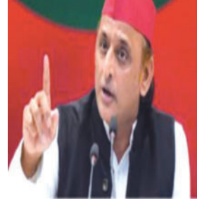
તેમણે જણાવ્યું કે ભાજપ હારના ડરથી નકારાત્મક રાજનીતિ કરી રહ્યું છે. પીડીએ (PDA) સમુદાયની એકતાથી ગભરાઈને ભાજપ આવા હથકડા અપનાવી રહ્યું હોવાનો પણ તેમણે દાવો કર્યો હતો.

સીમાંકન બિલ મુદ્દે ભાજપ અને સપા વચ્ચેનો રાજકીય વિવાદ વધુ ઘેરો બન્યો છે. ઉત્તર પ્રદેશ ભાજપે તેના સત્તાવાર 'X' હેન્ડલ પર અભિલેશ યાદવનો ફોટો મૂકી તેમને 'વોન્ટેડ' જાહેર કર્યા હતા, સાથે જ 'નળ ચોરી'નો ગંભીર કટાક્ષ પણ કર્યો હતો. ભાજપે તેમના પર મહિલા અધિકારોના વિરોધી હોવાનો આરોપ લગાવ્યો છે. સામે પક્ષે અભિલેશ યાદવે આકરી પ્રતિક્રિયા આપતા ભાજપને 'દેશદ્રોહી' ગણાવ્યા છે.