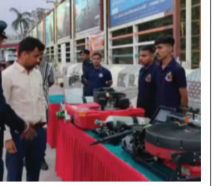
આ કાર્યક્રમમાં જિલ્લા કલેક્ટર અને એસ.પી. સહિતના ઉચ્ચ અધિકારીઓ વિશેષ ઉપસ્થિત રહ્યા હતા.

અમરેલી, તા. ૨૦ અમરેલી ફાયર એન્ડ ઇમરજન્સી સર્વિસ દ્વારા 'ફાયર સર્વિસ ૩' નિમિત્તે 'એક શામ શહીદ કે નામ' કાર્યક્રમ હેઠળ ભવ્ય ફાયર એક્ટિવિશનનું આયોજન કરવામાં આવ્યું હતું. વર્ષ ૧૯૪૪માં મુંબઈ ડોક્યાઈની આગમાં શહીદ થયેલા ૬૬ જવાનોની સ્મૃતિમાં યોજાયેલા