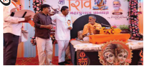
સજ્જ મહિલાઓએ રાસ-ગરબાની રમઝટ બોલાવી સમગ્ર વાતાવરણને શિવમય બનાવી દીધું હતું. સ્થાનિક સ્વરાજ્યની ચૂંટણીઓના પ્રચાર વચ્ચે, ભાજપ અને કોંગ્રેસના ઉમેદવારો પણ આ ધાર્મિક પ્રસંગે જનસંપર્ક માટે જોડાયા હતા.

અમરેલી, તા. ૨૦ અમરેલી નજીક આવેલ વડેરા ગામે અક્ષય તૃતીયાના પવિત્ર અવસરે સમસ્ત ગ્રામજનોના સહયોગથી શિવ મહાપુરાણ કથાનું ભવ્ય આયોજન કરવામાં આવ્યું છે. કથાના પ્રથમ દિવસે ગામમાં વાજતે-ગાજતે પોથીયાત્રા નીકળી હતી, જેમાં શ્રદ્ધાળુઓ મોટી સંખ્યામાં ઉમટી પડ્યા હતા. પરંપરાગત વસ્ત્રોમાં