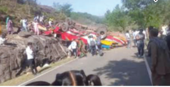
બચાવ કામગીરી શરૂ કરી હતી. વડાપ્રધાન નરેન્દ્ર મોદીએ આ ઘટના પર ઊંડો શોક વ્યક્ત કર્યો છે. તેમણે મૃતકોના પરિવારોને પીએમએનઆરએફમાંથી રૂ.૨ લાખ અને ધાયલોને રૂ. ૫૦,૦૦૦ ની આર્થિક સહાય આપવાની જાહેરાત કરી છે.

જમ્મુ અને કાશ્મીરના ઉધમપુર જિલ્લામાં એક ગમખવાર બસ અકસ્માત સર્જાયો છે. રામનગરથી ઉધમપુર જઈ રહી રહેલી એક પેસેન્જર બસ પહાડી રસ્તા પર ખાઈમાં ખાબકતા ૨૧ લોકોના કમકમાટીભર્યાં મોત નિપજ્યા છે, જ્યારે ૩૦થી વધુ મુસાફરો ધાયલ થયા છે. અકસ્માતની જાણ થતા જ સ્થાનિક લોકો અને વહીવટી ટીમે તાત્કાલિક