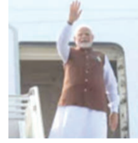
મહિલા અનામત સંબંધિત બંધારણીય સુધારો બિલ જરૂરી બહુમતીના અભાવે પસાર થઈ શક્યું નથી. કુલ ૫૨૮

વડાપ્રધાન નરેન્દ્ર મોદી ૨૮ એપ્રિલે પોતાના સંસદીય ક્ષેત્ર વારાણસીની બે દિવસીય મુલાકાતે જશે. આ પ્રવાસ દરમિયાન તેઓ એક વિશાળ મહિલા સંમેલનને સંબોધિત કરશે, જેમાં ૫૦,૦૦૦થી વધુ મહિલાઓ ઉમટી પડે તેવું આયોજન ભાજપ મહિલા મોરચા દ્વારા કરવામાં આવ્યું છે. તાજેતરમાં લોકસભામાં