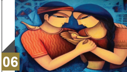
સમરંગ: કોઈ પણ પરિસ્થિતિ હોય, પરિવારમાં પ્રેમની ઓટ ન આવવી જોઈએ...!

‘ગૂંચામ બટાટાવાડા ચાય...’ ટ્રેનમાં ફેરિયા જે રીતે બૂમ પાડે તેવી સ્ટાઈલમાં આશાએ બૂમ પાડી કહ્યું હતું, ટ્રેનમાં જો તમે મુસાફરી નથી કરી તો કંઈ નથી કહ્યું. ગાયિકા ન બન્યાં હોત તો આશા ભોસલે સારાં મિમિક્રી આર્ટિસ્ટ બની શક્યાં હોત.