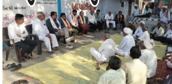
મહેનત કરી રહ્યા છે. તેઓ કહે છે કે, હાલમાં સાવરકુંડલા શહેર અને ગ્રામ્યના મતદારોને જે સ્થાનિક જરૂરિયાત હોય તે મળતી નથી. લોકો સરકારની ખોટી નીતિ, મોંઘવારી, બેરોજગારી તેમજ સ્થાનિક સમસ્યાથી પીડાઈ રહી છે.