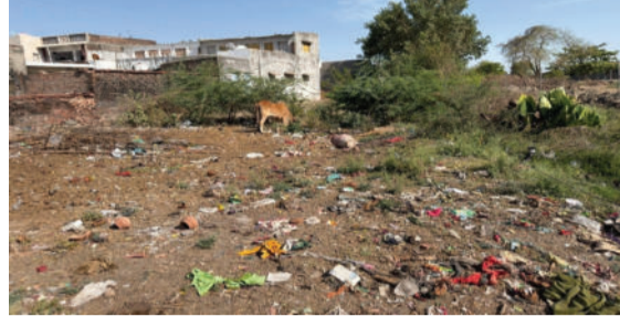
કેમ ઉણા ઉતર્યા છે અને તેમણે ઉપયોગ કર્યાં કર્યો છે? ચૂંટણીના સમયે જ્યારે નેતાઓ મતોની

ખરેખર તો જિલ્લા અને તાલુકા પંચાયતના સદસ્યોની પ્રાથમિક જવાબદારીમાં આવે છે. આ આક્રમક વચ્ચે સ્થાનિકોમાં સવાલ ઉઠી રહ્યો છે કે પૂર્વ જિલ્લા પંચાયત સદસ્ય અને તાલુકા પંચાયત સદસ્યે છેલ્લા પાંચ વર્ષમાં કૃષ્ણપરા વિસ્તારના વિકાસ માટે શું કર્યું? લોકોની સમસ્યાઓ નિવારવામાં તેઓ