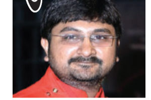
થનગનાટ જોવા મળી રહ્યો છે.

તથા પ્રયાગ મહેતાનો લોકડાયરો યોજાયો હતો. ભગવાન પરશુરામનો પ્રાગટ્ય મહોત્સવ ઉજવવા માટે બ્રહ્મ પરિવારોમાં