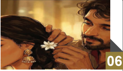
વર્તા વિશ્વ : રૂપાની નાદાંદે વાતની બાંધણી કરીને મા સામે જોયું