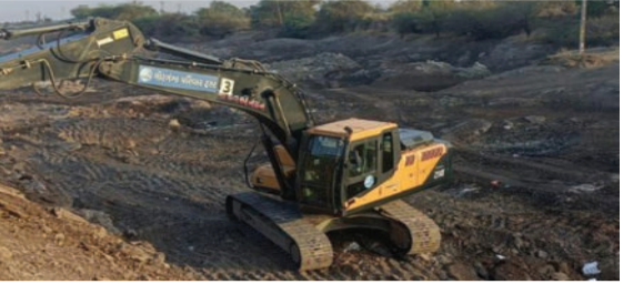
અભિયાન ચાલી રહ્યું છે, જેમાં વિવિધ ગામોના જૂના ચેકડેમોનું રિપેરિંગ અને તેમને ઊંડા

સાવરકુંડલા, તા. ૧૫ સાવરકુંડલા-લીલીયા તાલુકામાં પાણીના તળ ઊંચા લાવવા અને ખેડૂતોની સમૃદ્ધિ માટે ગીરગંગા પરિવાર ટ્રસ્ટ દ્વારા જળસંચય અભિયાન શરૂ કરવામાં આવ્યું છે. ઉલ્લેખનીય છે કે, હાલમાં અમરેલી જિલ્લાના ૧૬૦ જેટલા ગામોના વિકાસ માટે એક ઐતિહાસિક જળસંચય