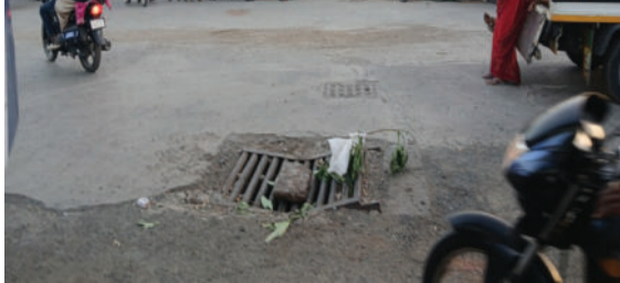
ભૂરખીયા ચોકડી પાસે ડાયવર્ઝન હોવાથી આ માર્ગ પર હાલ વાહનોની સતત અવરજવર રહે છે, જેને કારણે ગમે ત્યારે મોટી જાનહાનિ સર્જવાની ભીતિ સેવાઈ રહી છે. સ્થાનિકોનો આશંકા છે કે

દામનગર, તા. ૧૫ દામનગર શહેરમાં જાહેર જનતાની સુરક્ષા સામે જોખમ ઊભું કરતી તંત્રની ઘોર બેદરકારીનો એક ગંભીર કિસ્સો સામે આવ્યો છે. શહેરના હવેલી અને સરદાર સર્કલ પાસે પાણીના નિકાલની જાળી અત્યંત બિસ્માર હાલતમાં હોવાથી અકસ્માતને પુલ્વું આમંત્રણ આપી રહી છે.