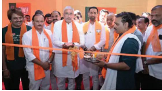
મધ્યસ્થ ચૂંટણી કાર્યાલયનું રિબન કાપીને ઉદ્ઘાટન કર્યું હતું. અહીં ઉપસ્થિત કાર્યકર્તાઓને સંબોધતા તેઓએ જણાવ્યું હતું કે ચૂંટણી જીતવા માટે પેજ સમિતિ અને બુથ લેવલની કામગીરી સૌથી