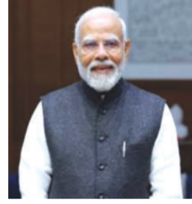
તેમના આદર્શ મૂલ્યોનું પાલન કરવાની પ્રેરણા આપે છે. આ પ્રસંગે તેમણે દેશવાસીઓને સંવાદિતા, કરુણા, દયા અને ક્ષમા જેવા ગુણોને હૃદયપૂર્વક સ્વીકારવાની અપીલ કરી હતી.

લોકસભા અધ્યક્ષ ઓમ બિરલાએ માનવતાના કલ્યાણ માટે ઈસુ ખ્રિસ્તના સર્વોચ્ચ ત્યાગને યાદ કર્યો નવી દિલ્હી, તા.૦૩ વડા પ્રધાન નરેન્દ્ર મોદીએ ગુડ ફાઈડે નિમિત્તે રાષ્ટ્રને આપેલા સંદેશમાં જણાવ્યું હતું કે, આ પવિત્ર દિવસ આપણને પ્રભુ ઈસુ ખ્રિસ્તના પરમ ભવિદાનની યાદ અપાવે છે. ઈસુના વિચારો આપણને