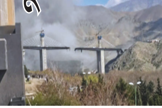
'ફહદ કોઝવે' તેમજ જોર્ડનના 'કિંગ હુસૈન ખ્રિજ', 'દામિયા ખ્રિજ' અને 'અબ્દુન ખ્રિજ' પણ આ યાદીમાં છે. નોંધનીય છે કે યુએસ અને ઈઝરાયલના

યુએસ-ઈઝરાયલી હુમલા બાદ 'જેસે થે' (ટિટ-ફોર-ટોટ) નીતિ હેઠળ લેવાયેલા બદલાની નિશાની તરીકે જોવામાં આવે છે. ઈરાનની અર્ધ-સત્તાવાર 'ફાર્સ ન્યૂઝ એજન્સી' એ આ યાદી પ્રકાશિત કરી છે. આ અહેવાલમાં જણાવાયું છે કે ગુરુવારે ઈરાનના સૌથી ઊંચા 'બી ૧' (B1) ખ્રિજ પર થયેલા ભીષણ હુમલાઓ બાદ, ગલ્ફ દેશો અને જોર્ડનમાં આવેલા ઘણા મોટા પુલ હવે ઈસ્લામિક રિવોલ્યુશનરી ગાર્ડ