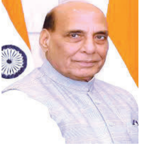
કરતા સંરક્ષણ મંત્રી રાજનાથ સિંહે જણાવ્યું હતું કે, 'આપણી નૌકાદળ હિંદ મહાસાગરમાં સતત હાજરી જાળવી રાખે છે, પછી ભલે તે પરિચિત ગલ્ફ હોય કે મલાકકાની સામુદ્રધુની. જ્યારે પણ કોઈ કટોકટી ઊભી થાય છે,

નવી દિલ્હી, તા.૦૩ ભારતની દરિયાઈ સુરક્ષાને અભેદ બનાવવા તરફ શુક્રવારે એક નવો અધ્યાય ઉમેરાયો છે. સંરક્ષણ મંત્રી રાજનાથ સિંહે વિશાખાપટ્ટનમના નેવલ રોકયાર્ડ ખાતે સ્વદેશી અત્યાધુનિક સ્ટીલ્થ ફ્રિગેટ્સ 'આઈએનએસ તારાગિરી' અને 'આઈએનએસ અરિધમન' ને ભારતીય નૌકાદળમાં કમિશન કર્યાં છે. આ ગૌરવશાળી સમારોહમાં સીડીએસ જનરલ અનિલ ચૌહાણ અને નૌકાદળના વડા એડમિરલ દિનેશ કુમાર ત્રિપાઠી પણ હાજર રહ્યા હતા. આ પ્રસંગે સંબોધન