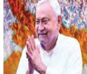
મુખ્યમંત્રી નીતિશ કુમાર દ્વારા રાજ્યસભામાં જોડાવાની જાહેરાત કરવામાં આવતા જ બિહારના રાજકારણમાં ગરમાવો આવી ગયો છે.

મુખ્યમંત્રી નીતિશ કુમાર દ્વારા રાજ્યસભામાં જોડાવાની જાહેરાત કરવામાં આવતા જ બિહારના રાજકારણમાં ગરમાવો આવી ગયો છે. આ જાહેરાતથી જનતા દળ યુનાઈટેડ (JDU) ના કાર્યકરોમાં ભારે આઘાત અને રોષ જોવા મળી રહ્યો છે. પટણામાં મુખ્યમંત્રી નિવાસસ્થાનથી લઈને પાર્ટી કાર્યાલય સુધી વિરોધ પ્રદર્શનો અને હંગામોનો દોર