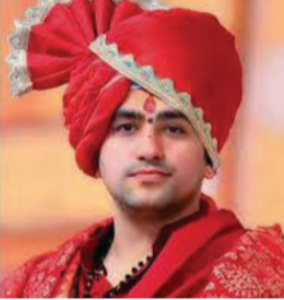
તત્વોથી દૂર રહીને નવી ઉર્જા અને નવા વિચારો પ્રાપ્ત કરવા માટે તેમણે ગુરુની આજ્ઞાથી

છતરપુર, તા.૦૯ સનાતન ધર્મના પ્રચારક અને બાગેશ્વર ધામના પીઠાધીશ્વર ધીરેન્દ્ર કૃષ્ણ શાસ્ત્રીએ એક મોટો નિર્ણય લેતા આગામી મે મહિનામાં એક મહિના માટે તમામ જાહેર પ્રવૃત્તિઓથી દૂર રહેવાની જાહેરાત કરી છે. આ સમય દરમિયાન તેઓ કોઈપણ મોબાઈલ નેટવર્ક, ટીવી કે ઈન્ટરવ્યુ માટે ઉપલબ્ધ રહેશે નહીં અને તેમના પ્રખ્યાત દિવ્ય દરબાર કે કથાનું આયોજન પણ કરવામાં આવશે નહીં. મળતી માહિતી મુજબ, ધીરેન્દ્ર શાસ્ત્રી ઉત્તરાખંડના બદ્રીનાથ ધામની પહાડીઓમાં ૨૧ દિવસ સુધી એકાંતમાં ગુપ્ત ધ્યાન અને તપસ્યા કરશે. પોતાની આ યાત્રા અંગે તેમણે જણાવ્યું કે, વર્તમાન તબક્કે આત્મ-ધ્યાન ખૂબ જ જરૂરી છે. ગેરમાર્ગે દોરનારા