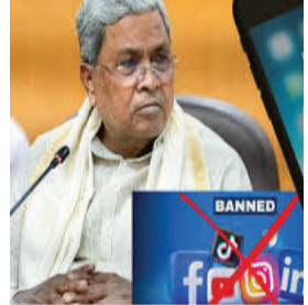
સરકારનું માનવું છે કે અનિયંત્રિત સ્ક્રીન સમય બાળકોની શીખવાની

બેંગલુરુ, તા.૦૯ બાળકોના માનસિક સ્વાસ્થ્ય અને ડિજિટલ વ્યસનને ધ્યાનમાં રાખીને કર્ણાટક સરકારે એક ક્રાંતિકારી નિર્ણય લીધો છે. મુખ્યમંત્રી સિદ્ધાર્થ મહેતાએ બજેટ ભાષણમાં જાહેરાત કરી કે રાજ્યમાં ૧૬ વર્ષથી ઓછી ઉંમરના બાળકો માટે સોશિયલ મીડિયાના ઉપયોગ પર પ્રતિબંધ લાદવામાં આવશે.