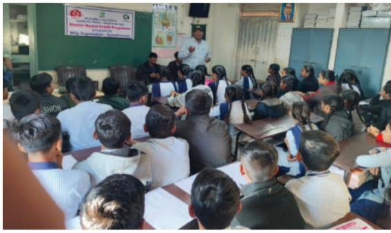
ઈન્સ્ટિટ્યૂટ, વ્યાયામ મંદિર તેમજ ઓથા, બગદાણા, નાના જાદરા, કુંભાજ, સેદરડા, બોરડી

અમરેલી, તા.૦૬ શિલ્પ ઓર્ગેનાઈઝેશન સુરેન્દ્રનગર અને સર તખ્તસિંહજી હોસ્પિટલ ભાવનગરના સંયુક્ત ઉપક્રમે મહુવા તાલુકાની વિવિધ શાળાઓ અને સંસ્થાઓમાં માનસિક આરોગ્ય સેમિનારનું સુંદર આયોજન કરવામાં આવ્યું હતું.