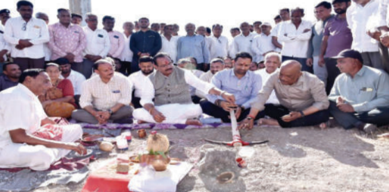
અર્ચ સ્કાવર વાલ્વ, પાઈપલાઈન, એર વાલ્વ ચેમ્બર અને એનર્જી ડિસીપેશન સ્ટ્રક્ચરનું નિર્માણ કરવામાં આવશે. આ યોજનાનો મુખ્ય ઉદ્દેશ્ય નર્મદાના નીરને સનાળા

અમરેલી, તા.૦૬ અમરેલી જિલ્લાના નાની કુંકાવાવ અને સનાળા મુકામે 'સોની યોજના' લિંક-૪ અંતર્ગત વિવિધ વિકાસકાર્યોનું ખાતમુહૂર્ત કૃષિ મંત્રી જીતુભાઈ વાઘાણી અને ઉર્જા રાજ્યમંત્રી કૌશિકભાઈ વેકરીયાના હસ્તે સંપન્ન થયું હતું. આ પ્રકલ્પ હેઠળ આશરે રૂ. ૧.૮૭ કરોડના