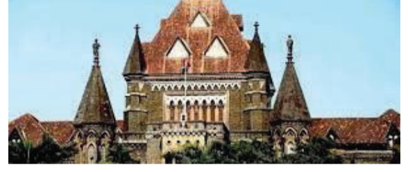
નમાઝ પઢવી એ કોઈનો મૌલિક ધાર્મિક અધિકાર હોઈ શકે નહીં. કોર્ટે એરપોર્ટ સુરક્ષાને પ્રાથમિકતા આપતા જણાવ્યું કે,