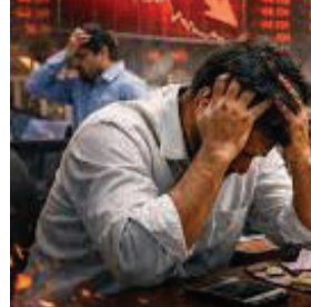
થયો હતો. આ ઘટાડાને કારણે રોકાણકારોની સંપત્તિમાં લાખો કરોડ રૂપિયાનું ધોવાણ થયું છે. બજાર તૂટવાના મુખ્ય કારણોમાં ઈરાન-ઈઝરાયલ સંઘર્ષને લીધે

મુંબઈ, તા.૦૯ ભારતીય શેરબજારમાં શુક્રવારે કાળો દિવસ સાબિત થયો હતો. વૈશ્વિક બજારના નબળા સંકેતો અને પશ્ચિમ એશિયામાં વધી રહેલા યુદ્ધના તણાવને કારણે બજારમાં ભારે વેચવાલી જોવા મળી હતી. ટ્રેડિંગના અંતે BSE સેન્સેક્સ ૧,૦૧૭.૩૭ પોઈન્ટ ઘટીને ૭૮,૮૮૮.૫૩ પર અને NSE નિફ્ટી ૩૧૫.૪૫ પોઈન્ટ તૂટીને ૨૪,૪૫૦.૪૫ પર બંધ