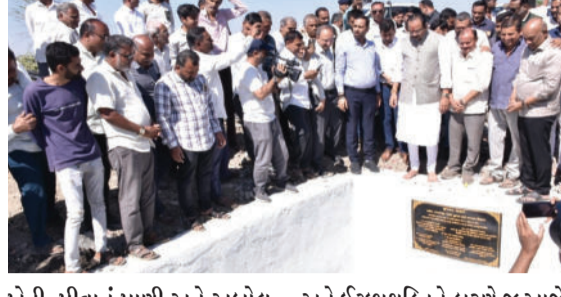
ખેતી, પીવાનું પાણી અને અબોલ પશુ-પંખીઓ માટે જીવન આપતો 'પ્રાણવાયુ' સમાન સ્ત્રોત છે. વડાપ્રધાન નરેન્દ્ર મોદીની દીર્ઘદ્રષ્ટિ

જે સમગ્ર પંથક માટે હર્ષ અને ઉલ્લાસનો વિષય બન્યો છે. આ ઐતિહાસિક ક્ષણના સાક્ષી બનતા જિલ્લા પ્રભારી મંત્રી જીતુ વાઘાણી અને ઊર્જા રાજ્યમંત્રી કૌશિક વેકરીયાએ મોણપુર ખાતે 'સૌની યોજના' લિંક ૪, પેકેજ ૫ અંતર્ગત તૈયાર કરાયેલા સ્કાવર વાલ્વનું વિધિવત લોકાર્પણ કર્યું હતું. આ વાલ્વના નિર્માણ પાછળ અંદાજે રૂ. ૨૭.૮૪ લાખનો ખર્ચ કરવામાં આવ્યો છે. આ સુવિધાને પરિણામે આશરે ૩૫૦ કિલોમીટર જેટલા લાંબા અંતરેથી નર્મદા મૈયાના પાણી હવે સીધા જ મોણપુરના સ્થાનિક તળાવમાં ઠલવાશે, જે આ વિસ્તારના જળસ્તરને ઊંચા લાવવામાં પાયાની ભૂમિકા ભજવશે. લોકાર્પણ સમારોહ દરમિયાન કેબિનેટ મંત્રી જીતુ વાઘાણીએ જણાવ્યું હતું કે, આ માત્ર એક લોખંડી વાલ્વ નથી, પરંતુ તે આસપાસના ૮ થી ૧૦ ગામોની