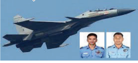
એરબેઝથી તાલીમ સત્ર માટે ઉડાન ભરી હતી. ઉડાન ભર્યાના થોડા સમય બાદ, રાત્રે ૭:૪૨ વાગ્યે વિમાનનો રડાર સંપર્ક તૂટી ગયો હતો. શોધખોળ દરમિયાન જાણવા મળ્યું કે વિમાન જોરહાટથી ૬૦ કિમી દૂર દુર્ઘટનાગ્રસ્ત થયું હતું. સ્થાનિક લોકોએ આકાશમાં વિમાન નીચે ઉતરતા જોયા બાદ પ્રચંડ વિસ્ફોટનો અવાજ સાંભળ્યો

ગુવાહાટી, તા.૦૯ આસામના કાર્બી આંગલોંગ વિસ્તારમાં ભારતીય વાયુસેનાનું અન્યાધુનિક સુખોઈ-૩૦ એમકેઆઈ (Su-30 MKI) ફાઈટર જેટ કેશ થવાની દુખદ ઘટના સામે આવી છે. આ અકસ્માતમાં સ્કવોડ્રન લીડર અનુજ અને ફ્લાઈટ લેફ્ટનન્ટ પૂર્વેશ દુરાગર શહિદ થયા છે. માહિતી મુજબ, ફાઈટર જેટે ગુરુવારે સાંજે આસામના જોરહાટ