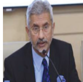
વિદેશ મંત્રી એસ. જયશંકરે વિશ્વ વ્યવસ્થા પર નિવેદન આપ્યું છે.

વર્તમાન વૈશ્વિક તણાવ અને બદલાતા સમીકરણો વચ્ચે ભારતના વિદેશ મંત્રી એસ. જયશંકરે વિશ્વ વ્યવસ્થા પર મહત્વનું નિવેદન આપ્યું છે. તેમણે સ્પષ્ટપણે જણાવ્યું છે કે આજના સમયમાં કોઈ પણ એક દેશનું સંપૂર્ણ વર્ચસ્વ રહ્યું નથી. જયશંકરે ઉમેર્યું કે ૨૦મી સદીના મધ્યભાગથી ચાલી આવતી સ્થિર વિશ્વ વ્યવસ્થા જાળવવાની અપેક્ષા રાખવી હવે "અવાસ્તવિક" છે, કારણ કે વૈશ્વિક શક્તિ હવે વિવિધ