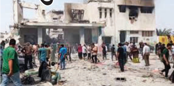
સૈનિકો માર્યા ગયા હોવાના અહેવાલ છે. ઘડાઈટ હાઉસના પ્રવક્તા કેરોલિન લેવિટ્ટે દાવો કર્યો છે કે અમેરિકાએ ઈરાનની ૭૩% ડ્રોન અને ૮૬% બેલિસ્ટિક

વોશિંગ્ટન, તા.૦૯ અમેરિકા, ઈઝરાયલ અને ઈરાન વચ્ચે ચાલી રહેલા યુદ્ધના સાતમા દિવસે પરિસ્થિતિ અત્યંત સ્ફોટક બની છે. અમેરિકા વાયુસેનાના B-2 અને B-52 બોમ્બરોએ ઈરાનના સૈન્ય મથકો અને તેહરાનના આઝાદી સ્ટેડિયમ જેવા વિસ્તારો પર ૨,૦૦૦ પાઉન્ડના બોમ્બ ફેંકી ભારે વિનાશ વેર્યો છે. અત્યાર સુધીના હુમલામાં ૧,૪૦૦થી વધુ ઈરાની નાગરિકો અને