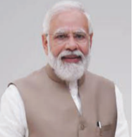
પ્રધાનમંત્રી મોદી વિશાળ રેલી યોજશે.

પશ્ચિમ બંગાળમાં આગામી ચૂંટણીઓની તૈયારીઓના ભાગરૂપે ભારતીય જનતા પાર્ટીએ તેની વ્યૂહરચના તેજ કરી છે. ૧૪ માર્ચે કોલકાતાના ઐતિહાસિક બ્રિગેડ પરેડ ગ્રાઉન્ડ ખાતે વડાપ્રધાન નરેન્દ્ર મોદીની એક વિશાળ રેલી યોજવા જઈ રહી છે. આ રેલીને બંગાળમાં ભાજપના આગામી રાજકીય અભિયાનના વિવિધ પ્રારંભ તરીકે જોવામાં આવી રહી છે. આ વખતે ભાજપ દરેક બેઠક પર પરંપરાગત રીતે લડવાને