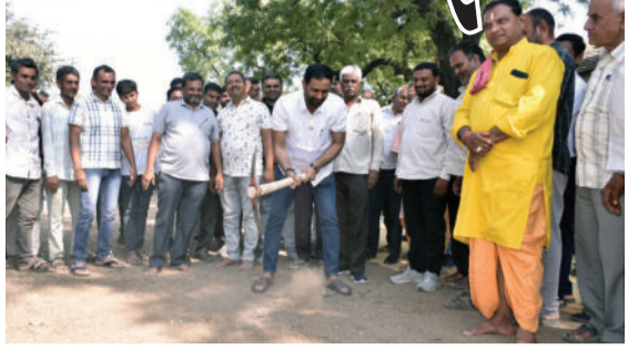
થશે, જેનો સીધો લાભ સ્થાનિક ખેડૂતોને સિંચાઈ માટે મળશે.

રાજ્યના ઊર્જા મંત્રી કૌશિકભાઈ વેકરીયાના હસ્તે કરવામાં આવ્યું છે. આ આયોજન અંતર્ગત માંગપાળ ખાતે વડી ઈરીગેશન યોજનામાં રૂ. ૫૯.૩૩ લાખના ખર્ચે બોક્ષ કલવર્ટ બનાવવામાં આવશે, જ્યારે સાંથળી અને ખડખડ ગામે નવા ચેકડેમોનું નિર્માણ થશે. આ ચેકડેમોના કારણે વિસ્તારમાં કરોડો લિટર જળસંચય શક્તિમાં વધારો