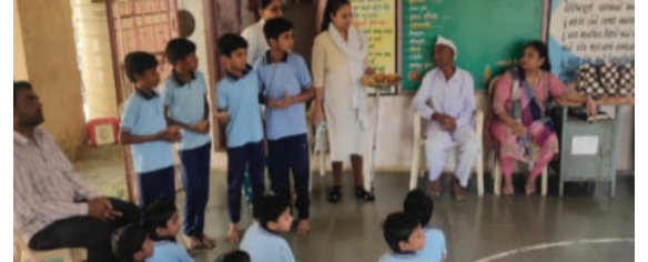
ઉપાયો વિશે ઊંડાણપૂર્વક અને તેનાથી થતા ફાયદાઓ સમજાણ આપવામાં આવી વિશેષ પણા વિદ્યાર્થીઓને માગદર્શન પૂરું પાડવામાં માટે પૌષ્ટિક આહારનું મહત્વ આપ્યું હતું. કાર્યક્રમના અંતે

આયુષ્માન આરોગ્ય મંદિર વડેરા દ્વારા રંગપુર પ્રાથમિક શાળામાં ધોરણ ૧ થી ૫ ના વિદ્યાર્થીઓ માટે એક વિશેષ આરોગ્યલક્ષી કાર્યક્રમનું સુંદર આયોજન કરવામાં આવ્યું હતું. આ કાર્યક્રમ દરમિયાન બાળકોને વાહકજન્ય રોગો ફેલાવાના મુખ્ય કારણો અને તેનાથી બચવા માટેના અસરકારક