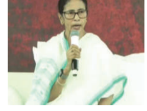
જીવિત મતદારોને મૃત જાહેર કરી દેવાયા છે, જેમને તેઓ રૂબરૂ રજૂ કરીને આ અન્યાયનો પર્દાફાશ કરશે. ચૂંટણી પંચની ટીમની મુલાકાત પૂર્વે શરૂ થયેલા આ ધરણાએ રાજ્યના રાજકારણમાં ભારે ગરમાવો લાવી દીધો છે.

કોલકાતા, તા.૦૯ પશ્ચિમ બંગાળના મુખ્યમંત્રી મમતા બેનર્જીએ શુક્રવારે કોલકાતાના એસ્પેનેડ મેટ્રો ચેનલ પાસે મતદાર યાદીમાંથી નામ હટાવવા સામે વિરોધ પ્રદર્શન શરૂ કર્યું છે. તેમણે ભાજપ અને ચૂંટણી પંચ પર ગંભીર આરોપ લગાવતા જણાવ્યું કે બંગાળી મતદારોને મતાધિકારથી વંચિત રાખવાનું વ્યવસ્થિત ષડયંત્ર રચાઈ રહ્યું છે. ટીએમસી પ્રમુખે દાવો કર્યો કે સુધારેલી યાદીમાં અનેક