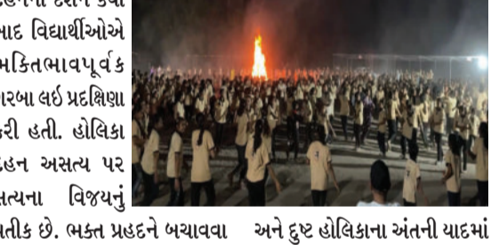
દહનના દર્શન કર્યા બાદ વિદ્યાર્થીઓએ ભક્તિભાવપૂર્વક ગરબા લઈ પ્રદક્ષિણા કરી હતી. હોલિકા દહન અસત્ય પર સત્યના વિજયનું પ્રતીક છે. ભક્ત પ્રદહને બચાવવા અને દુષ્ટ હોલિકાના અંતની યાદમાં

અમરેલી,તા.૦૫ શાંતાબેન હરિભાઈ ગજેરા કેમ્પસ-વિદ્યાસભા ખાતે ૨ માર્ચ ૨૦૨૬, ફાગણ સુદ પૂનમના દિવસે ધોરણ ૪ થી કોલેજના હોસ્ટેલ વિદ્યાર્થીઓ દ્વારા દરવર્ષની પરંપરા મુજબ હર્ષોલ્લાસ સાથે હોલિકા દહન ઉજવવામાં આવ્યું હતું. હોલિકા