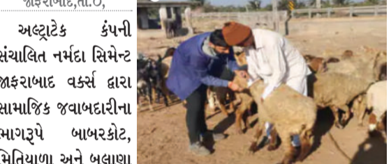
વધુ પશુઓ જેવા કે ગાય, ભેંસ અને ઘેટા-બકરાને વિનામૂલ્યે તબીબી સારવાર, જરૂરી દવાઓ અને વૈજ્ઞાનિક માર્ગદર્શન પૂરું પાડવામાં આવ્યું હતું.

જાફરાબાદ, તા.૦૫ અલ્ટ્રાટેક કંપની સંચાલિત નર્મદા સિમેન્ટ જાફરાબાદ વર્ક્સ દ્વારા સામાજિક જવાબદારીના ભાગરૂપે બાબરકોટ, મિતિયાળા અને બલાણા ગામોમાં ભવ્ય એનિમલ હેલ્થ કેમ્પનું આયોજન કરવામાં આવ્યું હતું. આ વિશેષ કાર્યક્રમ અંતર્ગત બાયક ટીમની નિષ્ણાત સેવાઓ દ્વારા કુલ ૧૭૬ ખેડૂતોના આશરે ૩૫૦૦થી વધુ પશુઓ જેવા કે ગાય, ભેંસ અને ઘેટા-બકરાને વિનામૂલ્યે તબીબી સારવાર, જરૂરી દવાઓ અને વૈજ્ઞાનિક માર્ગદર્શન પૂરું પાડવામાં આવ્યું હતું.