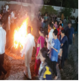
મુક્ત તહેવારોની ઉજવણી કરવી એ આ સંસ્થાની પરંપરા રહેલી છે.

અમરેલી, તા.૦૫ અમરેલીના જાણીતા શ્રીજી વિધાર્થી ભુવનમાં ૦૨-૦૩-૨૦૨૬ના રોજ શાળાના વિધાર્થીઓ દ્વારા ઈકો ફેન્ડલી હોલિકા દહન કાર્યક્રમ યોજાયો હતો. જેમાં સંસ્થામાં ગાયોના ગોબરમાંથી બનેલ છાણા તથા કપૂર, ગૂળણ, હવન સામગ્રી અને ગાયના ઘીનો ઉપયોગ કરવામાં આવ્યો હતો. કોઈ પણ કેમિકલ્સ, કેરોસીન કે પ્લાસ્ટિકનો ઉપયોગ ન થવાથી આ પ્રાકૃતિક રીતે થયેલ હોળીનું મહત્વ વિધાર્થીઓને સમજાવ્યું હતું. પર્યાવરણ જાગૃતિ અને પ્રદૂષણ