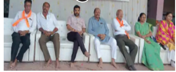
મહત્વપૂર્ણ કાર્યક્રમ અંગેની તિના અગ્રણી જયેશભાઈ લોકોએ ઉત્સાહભરે ભાગ વિગતવાર માહિતી હિન્દુ જાગૃ પંડ્યા દ્વારા પૂરી પાડવામાં

અમરેલી,તા.૦૫ બગસરાની સતવારા વાડી ખાતે જય ભવાની હિન્દુ જાગરણ સમિતિ દ્વારા એક વિશેષ હિન્દુ સંમેલનનું ભવ્ય આયોજન કરવામાં આવ્યું હતું. આ કાર્યક્રમનો મુખ્ય ઉદ્દેશ્ય સમાજમાં એકતા અને જાગૃતિ લાવવાનો હતો. આ