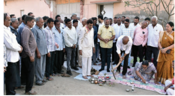
સાથે જ ૩૫ લાખના ખર્ચે તૈયાર કરવામાં આવેલા તળાવના રીનોવેશન સહિતના ૧૧ વિકાસકામોનું ખાતમુહૂર્ત કરવામાં આવ્યું હતું.

અમરેલી,તા.૦૫ કુંકાવાવ-વડીયા તાલુકાના ૪૫ ગામડાઓમાં એકસાથે જળસંચય અભિયાનનો શંખનાદ કરવામાં આવ્યો છે. આ મહત્વપૂર્ણ અભિયાનના પ્રારંભે આયોજિત સરપંચ સંમેલનમાં રાજ્યના ઊર્જા મંત્રી કૌશિકભાઈ વેકરીયા અને સાંસદ ભરતભાઈ સુતરીયા ઉપસ્થિત રહ્યા હતા. મંત્રીએ અમરેલી વિધાનસભાના તમામ ગામડાઓમાં જળસંચયના કાર્યોને ગતિ આપીને વિકાસની પ્રતિબદ્ધતા વ્યક્ત કરી હતી. તેમણે ગ્રામજનોને તળાવ ઊંડા ઉતારવાની કામગીરી પર સતત દેખરેખ રાખવા આગ્રહ કર્યો હતો. બરવાળા બાવીસી મુકામે ૫૫ લાખના ખર્ચે નવા ગ્રામ પંચાયત ભવન અને તળાવના રીનોવેશન સહિતના ૧૧ વિકાસકામોનું ખાતમુહૂર્ત કરવામાં આવ્યું હતું.