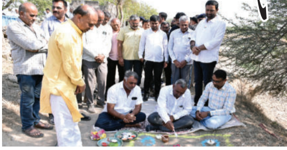
જોખમથી બચાવવા માટે અંદાજે ૩.૩૦ લાખના ખર્ચે પુરસંરક્ષણ ટિવાલનું નિર્માણ થશે. આ ઉપરાંત વાવડી-ચોકી-સનાળા-