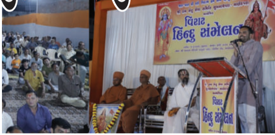
પ્રાસંગિક સ્વાગત પ્રવચન કર્યું હતું. શાળાના બાળકોએ આકર્ષક સાંસ્કૃતિક કૃતિઓ રજૂ કરી પ્રેક્ષકોને મંત્રમુગ્ધ કર્યા હતા. સંમેલનમાં મુખ્ય વક્તા