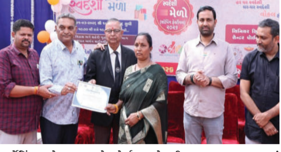
માર્કેટિંગ માટે સશક્ત પ્લેટફોર્મ સ્ટોલની વ્યવસ્થા કરવામાં મળી રહ્યું છે. મેળામાં ૪૬ આવી છે. તા. ૦૧થી ૧૦

મંત્રીશ્રીએ પ્રદર્શનની મુલાકાત લઈ સખી મંડળ અને સ્વ સહાય જૂથોની બહેનોને શુભેચ્છા પાઠવી હતી. તેમણે જણાવ્યું કે નરેન્દ્ર મોદીના 'વોકલ ફોર લોકલ' સૂત્રને સાર્થક કરવા અને ભૂપેન્દ્રભાઈ પટેલના માર્ગદર્શન હેઠળ રાજ્ય સરકાર પ્રતિબદ્ધ છે. આ મેળા દ્વારા સ્થાનિક ઉત્પાદકોને પોતાના શહેરમાં જ