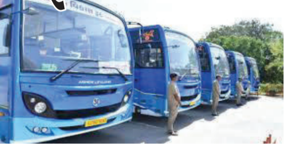
ગારીયાધાર એક જ સમયે એક જ રૂટ પર ગારીયાધાર સુધી ચાલે છે. તેમજ ચલાવાથી ચલાવા

જુનાગઢ એસટી ડેપો દ્વારા ચલાવવામાં આવતી જુનાગઢ હસ્તગીરી બસ અગાઉ સાવરકુંડલા, વંડા, જેસર થઈ ચલાવવામાં આવતી પરંતુ કોઈ કારણોસર તે બસ સાવરકુંડલા, ભુવા, જુનાસાવર, ગારીયાધાર થઈ ચલાવવામાં આવે છે. જુનાગઢ ડેપો દ્વારા સવારે જુનાગઢ હસ્તગીરી તથા જુનાગઢ