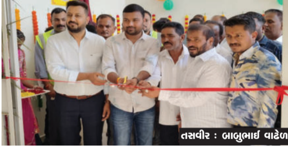
બનાવવામાં આવ્યું છે. ઘણા રાખી તાત્કાલિક મંજૂર કરાવી સમયથી આ પ્રશ્ન પડતર હોય અને કેન્દ્ર બનાવવામાં આવ્યું છે. આ કાર્યક્રમમાં જિલ્લા પંચાયત જેથી સરકાર દ્વારા આ પ્રશ્ન ધ્યાને

જાફરાબાદ તાલુકાના નાગેશ્રી ગામે ધારાસભ્ય હીરાભાઈ સોલંકીના હસ્તે પ્રાથમિક આરોગ્ય કેન્દ્રનું લોકાર્પણ કરાયું હતું. આ તકે ભાજપના આગેવાનો તેમજ આસપાસના ગ્રામ્ય વિસ્તારમાંથી સરપંચો અને નાગેશ્રીના ગ્રામજનો મોટી સંખ્યામાં ઉપસ્થિત રહ્યા હતા. આ પ્રાથમિક આરોગ્ય કેન્દ્ર એક કરોડ અને ૩૦ લાખના ખર્ચે