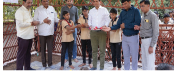
અને આહુતિ આપીને ઉજવશે. આ યજ્ઞશાળા માત્ર ધાર્મિક વિધિ નથી, પરંતુ વિદ્યાર્થીઓમાં સકારાત્મક ઊર્જા, માનસિક શાંતિ અને આત્મભગ્ન વધારવાનું કેન્દ્ર બનશે. શૈક્ષણિક પ્રવૃત્તિમાં વિદ્યન આવે તે