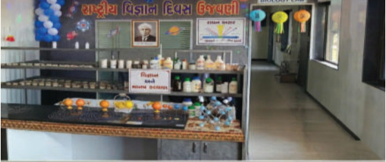
નવીનતમ શોધોથી વિદ્યાર્થીઓ અવગત થાય અને તેમની વૈજ્ઞાનિક સૂઝબૂઝ ખીલે તે હેતુથી આ કાર્યક્રમ યોજાયો હતો.

સાવરકુંડલા શહેરના જેસર રોડ પર સ્થિત સ્વામિનારાયણ ગુરુકુળ સંચાલિત સહજાનંદ પ્રાથમિક વિદ્યાલય અને સ્વામિનારાયણ વિદ્યાલયમાં ૨૮ ફેબ્રુઆરી 'રાષ્ટ્રીય વિજ્ઞાન દિવસ' નિમિત્તે એક ભવ્ય વિજ્ઞાન પ્રદર્શનનું આયોજન કરવામાં આવ્યું હતું. આજના આધુનિક વિજ્ઞાન યુગમાં થઈ રહેલી