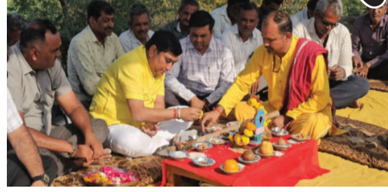
તળાવિયાએ જણાવ્યું હતું કે, કાળુભાર નદી પરનો આ ચેકડેમ વર્ષો જૂનો હોવાથી તેમાં ક્ષતિઓ

લાઠીના હિરાણા ગામે કાળુભાર નદી પર આવેલ ચેકડેમના રિપેરિંગ અને મજબૂતીકરણના કામનો શુભ પ્રારંભ કરવામાં આવ્યો હતો. ધારાસભ્ય જનક તળાવિયાના હસ્તે રૂ. ૫૨ લાખના ખર્ચે આ મહત્વપૂર્ણ વિકાસ કાર્યનું વિધિવત ખાતમુહૂર્ત કરવામાં આવ્યું હતું. આ પ્રસંગે ધારાસભ્ય જનક