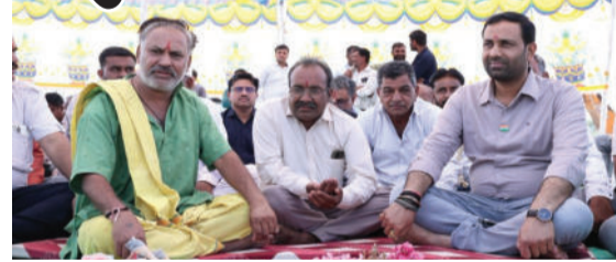
હાઉસ, કલોરીન રૂમ, કમ્પાઉન્ડ વોલ અને જરૂરી મશીનરીનો સમાવેશ થાય છે. મંત્રીએ કરવાની સૂચના આપી. જલ જીવન મિશન