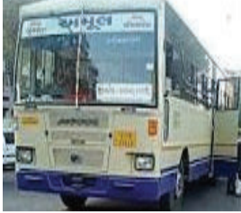
મહુવા-સાવરકુંડલા જેવા લોકલ રૂટો શરૂ કરવા અનેકવાર રજૂઆતો કરવામાં આવી છે, તેમ છતાં તંત્ર દ્વારા કોઈ નક્કર

સાવરકુંડલા, તા. ૨૨ ગુજરાત રાજ્ય વાહન વ્યવહાર નિગમના અમરેલી ડિવિઝન હેઠળ આવતા સાવરકુંડલા રોડમાં ડ્રાઇવરોની અછત પૂરી થઈ હોવા છતાં, ગ્રામ્ય વિસ્તારના અનેક લોકલ રૂટો હજી પણ બંધ હોવાથી સ્થાનિકોમાં ભારે નારાજગી જોવા મળી રહી છે. ખાસ કરીને સાવરકુંડલા-કરલા-મોદા જેવો