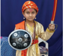
દીધા હતા, જેને જોઈને શાળાના સ્ટાફમાં પણ ભારે રાજીખો જોવા મળ્યો હતો. આ નાના વિદ્યાર્થીએ શિવાજી મહારાજનું અદભુત પાત્ર ભજવીને શાળા, કાઠી ક્ષત્રિય સમાજ અને પોતાના જાબાળ