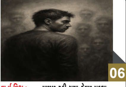
વર્તા વિશ્વ : ... પાછળ રહી ગયા કેવળ પડ્યા...