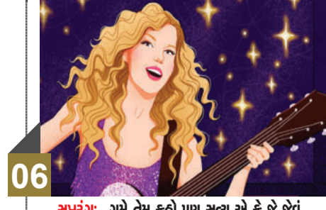
સમરંગ: ગમે તેમ કહો પણ સત્ય એ કે જે જેવું વિચારે છે તે તેવું પામે છે

તુ જેતરમાં વડાપ્રધાન નરેન્દ્ર મોદી અને રા. સ્વ. સંઘના સરસંઘચાલક મોહન ભાગવતના હસ્તે શ્રી રામમંદિર પર ભવ્ય ધ્વજરોહણ થયું. કેસરિયો ધ્વજ ઉત્તર મસ્તકે હાલેરાઈ રહ્યો હતો ત્યારે તે પ્રસંગે યથાર્થ રીતે મોહનજીએ શ્રી