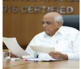
પંચાયત, ગ્રામ ગુહનિર્માણ અને ગ્રામ વિકાસ મંત્રી ઋષિકેશ પટેલે જણાવ્યું હતું કે, "આ રકમથી રાજ્યના ગામડાંઓમાં આશરે

ગાંધીનગર, તા. ૨૯ મુખ્યમંત્રી ભૂપેન્દ્ર પટેલના નેતૃત્વ હેઠળની ગુજરાત સરકારે રાજ્યના ગ્રામીણ વિસ્તારોને વધુ સશક્ત અને સ્વાવલંબી બનાવવા માટે મહત્વનો નિર્ણય લીધો છે. ૧૫મા કેન્દ્રીય નાણાપંચની ભલામણોને અનુરૂપ રાજ્ય સરકારે પંચાયતીરાજ સંસ્થાઓને બીજા હતા હેઠળ કુલ ૭૪૧.૯૦ કરોડની વિશાળ ગ્રાન્ટ ફાળવી છે.