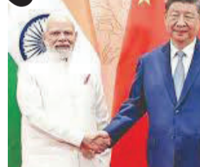
સ્થાન મેળવ્યું છે અને ફરીથી ૪૦ પોઈન્ટનો મહત્વપૂર્ણ બેન્ચમાર્ક હાંસલ કર્યો છે. ભારતનો એકંદર સ્કોર ૧૦૦ માંથી ૪૦.૦ પોઈન્ટ હતો, જે અગાઉની આવૃત્તિની સરખામણીમાં ૦.૯ પોઈન્ટ અથવા ૨% નો વધારો છે. એશિયા પાવર ઈન્ડેક્સ

સિડની, તા. ૨૯ ઓસ્ટ્રેલિયા સ્થિત થિંક ટેન્ક લોવી ઈન્સ્ટિટ્યૂટ દ્વારા બહાર પાડવામાં આવેલા એશિયા પાવર ઈન્ડેક્સ ૨૦૨૫માં ભારતે ફરી એકવાર એશિયાની 'મુખ્ય શક્તિ'નો દરજ્જો પ્રાપ્ત કર્યો છે. તે વડાપ્રધાન નરેન્દ્ર મોદીના નેતૃત્વમાં શક્તિશાળી નવા ભારતનું પ્રતિક છે. ભારતે એશિયાના ટોચના ૨૭ દેશોની યાદીમાં ત્રીજું