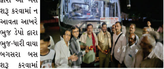
દ્વારા આ બસ શરૂ કરવામાં ન આવતા આખરે ભુજ રૂપો દ્વારા ભુજ-ધારી વાયા બગસરા બસ શરૂ કરવામાં આવી હતી જેથી શહેરની સામાજિક સંસ્થાઓ ચેમ્બર ઓફ કોમર્સ અને પેસેન્જર્સ એસોસિયેશન દ્વારા ભુજ-ધારી એસટી બસના

બગસરા, તા. ૧૮ ભુજ રૂપો દ્વારા ભુજ-ધારી વાયા રાજકોટ, બગસરા બસ શરૂ કરવામાં આવતા બગસરા પંથકના મુસાફરોમાં આનંદની લાગણી પ્રસરી જવા પામી છે. બગસરા-ભુજ બસ શરૂ કરવા માટે તંત્ર સમક્ષ અનેકવાર રજૂઆત કરવામાં આવી હતી આ બાબતે સામાજિક સંસ્થાઓએ પણ રજૂઆત કરી હતી પરંતુ બગસરા એસટી વિભાગ