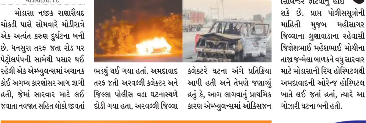
મોડાસા, તા. ૧૮ મોડાસા નજીક રાણાસૈયદ ચોકડી પાસે સોમવારે મોડીરાત્રે એક અત્યંત કરુણ દુર્ઘટના બની છે. ધનસુરા તરફ જતા રોડ પર પેટ્રોલપંપની સામેથી પસાર થઈ રહેલી એક એમ્બ્યુલન્સમાં અચાનક કોઈ અગમ્ય કારણોસર આગ લાગી હતી, જેમાં સારવાર માટે લઈ જવાતા નવજાત સહિત લોકો જીવતાં