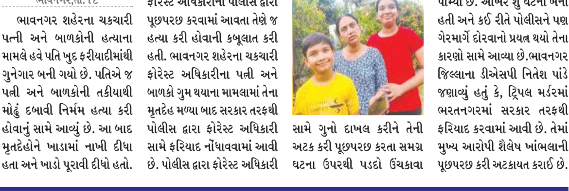
ભાવનગર, તા. ૧૮ ભાવનગર શહેરના ચક્રચારી પત્ની અને બાળકોની હત્યાના મામલે હવે પતિ બુદ ફરીયાદીમાંથી ગુનેગાર બની ગયો છે. પતિએ જ પત્ની અને બાળકોની તકીયાથી મોઢું દબાવી નિર્મમ હત્યા કરી હોવાનું સામે આવ્યું છે. આ બાદ મુતદેહોને ખાડામાં નાખી દીધા હતા અને ખાડો પૂરાવી દીધો હતો. ફોરેસ્ટ અધિકારીની પોલીસ દ્વારા પૂછપરછ કરવામાં આવતા તેણે જ હત્યા કરી હોવાની કબૂલાત કરી હતી. ભાવનગર શહેરના ચક્રચારી ફોરેસ્ટ અધિકારીના પત્ની અને બાળકો ગુમ થયાના મામલામાં તેના મુતદેહ મળ્યા બાદ સરકાર તરફથી પોલીસ દ્વારા ફોરેસ્ટ અધિકારી સામે ફરિયાદ નોંધાવવામાં આવી છે. પોલીસ દ્વારા ફોરેસ્ટ અધિકારી પામ્યો છે. આમરે શું ઘટના બની હતી અને કઈ રીતે પોલીસને પણ ગેરમાર્ગે દોરવાનો પ્રયત્ન થયો તેના કારણો સામે આવ્યા છે. ભાવનગર જિલ્લાના ડીએસપી નિતેશ પાંડે જણાવ્યું હતું કે, ટ્રિપલ મર્ડરમાં ભરતનગરમાં સરકાર તરફથી ફરિયાદ કરવામાં આવી છે. તેમાં મુખ્ય આરોપી શૈલેષ ખાંભલાની પૂછપરછ કરી અટકાયત કરાઈ છે.