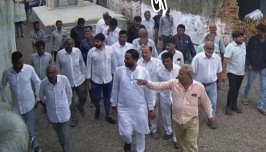
ગામના ગદય સમાજ દ્વારા આયોજીત અને રક્તદાન કેમ્પ નેજો (નિશાન) યદાવવામાં પણ યોજાયો હતો. મહોત્સવમાં

રામપુરમાં શ્રી દાનગીગેવ જન્મભૂમિ ચેરીટેબલ ટ્રસ્ટ દ્વારા ત્રિ દિવસીય યજ્ઞ અને મૂર્તિ પ્રતિષ્ઠા મહોત્સવ યોજાયો હતો. ગામલોકોએ સાથે મળીને સત્તાધારના સંત શ્રી આપાગીગાના જન્મ સ્થળ રામપુરમાં આ મહોત્સવનું ભવ્ય આયોજન કર્યું હતું. મહોત્સવમાં યુદ્ધ સૌરઠ