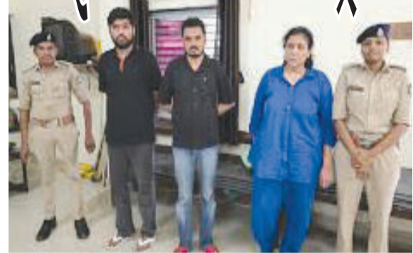
છોડી દેવાયો હતો. બિનવારસી થેલામાં એમ્ફેટાઈનમાઈન અને મેથાએમ્ફેટામાઈન ૩રીવેટીસ પ્રકારનો ૭૯.૨૧ ગ્રામ જથ્થો મળી આવ્યો, જેનું બજારમૂલ્ય ૭૯.૨૧ લાખ રૂપિયા થાય છે.

અખાણ્યા શપ્સે થેલો બિનવારસી હાલતમાં છોડ્યો હોવાનું અનુમાન હિંમતનગર, તા. ૨૭ હિંમતનગર જુઆરપીએ રેલવેમાં હેરફેર કરાતો ડ્રગ્સનો જથ્થો ઝડપ્યો હતો. હિંમતનગર રેલવે પ્લેટફોર્મ પરથી ચેકિંગ દરમિયાન રૂં ૭૯.૨૧ લાખની કિંમતનો ડ્રગ્સનો જથ્થો ઝડપાયો છે. અખાણ્યા શપ્સ પોલીસની ચલપહલ જોઈ પ્લેટફોર્મ પર ડ્રગ્સ ભરેલો થેલો મૂકી ફરાર થઈ ગયો હતો. વીરભૂમિ એક્સપ્રેસ ટ્રેનમાં ડ્રગ્સના જથ્થાની હેરફેર કરવામાં આવી રહી હોવાનું મનાય છે. વીરભૂમિ એક્સપ્રેસ ટ્રેન ઈન્દોરથી અમદાવાદના અસારવા જઈ રહી હતી. હિંમતનગર જુઆરપી પોલીસ ટીમના ચેકિંગને લઈ અખાણ્યા શપ્સે થેલો બિનવારસી હાલતમાં છોડ્યો હોવાનું માનવામાં આવે છે. વીરભૂમિ એક્સપ્રેસ ટ્રેનના જનરલ કોચ પાસે બિનવારસી થેલો