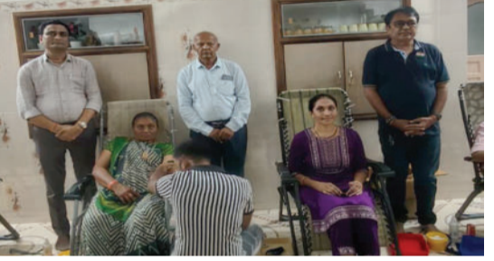
સર્જાતી રક્તની અછતને દૂર કરવામાં મદદ કરી હતી. આ કેમ્પમાં અમરેલીના સંસ્થાના કેમ્પનું આયોજન 'સ્વર્ણિમ ગુજરાત