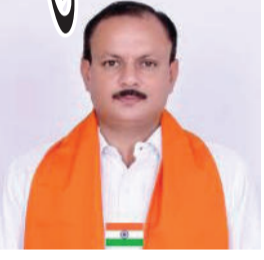
અમરેલી જિલ્લામાં તાજેતરમાં