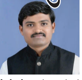
ઉભા પાકોમાં ખુબ જ મોટા સહિત અનેક વિસ્તારોમાં છેલ્લા ત્રણ દિવસથી રાત-દિવસ એકધારે વરસાદ વરસી રહ્યો છે, આ કમોસમી વરસાદને લીધે ખેડૂતોને મગફળી, કપાસ સહિત અનેક ઉભા પાકોમાં ખુબ જ મોટા પ્રમાણમાં નુકસાન થયું છે, તે આ બાબતે તાત્કાલિક ધોરણે સર્વે કરાવી ખેડૂતોને સહાય આપવી જોઈએ. તેમણે આ પત્રની નકલ કૃષિ મંત્રી જીતુભાઈ વાઘાણીને પણ મોકલી છે.