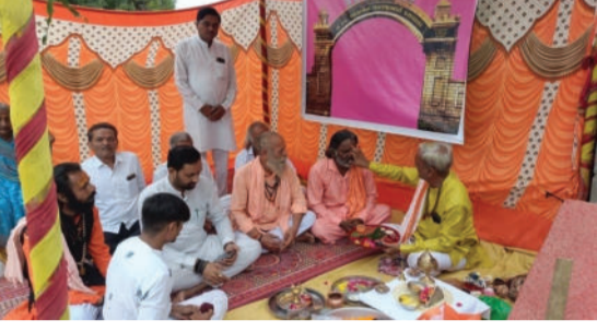
રજૂઆતો રંગ લાવી હતી. ગામની અંદર આપાગીગાની પ્રસાદીનો

લાભ પાંચમના શુભ દિવસે અમરેલીના મોટા ભંડારીયા ગામે ધારાસભ્યના વરદ હસ્તે વિવિધ કામોનું ખાતમુહૂર્ત કરવામાં આવ્યું હતું. અમરેલી તાલુકાના મોટા ભંડારીયા ગામે ઉપસરપંચ દ્વારા