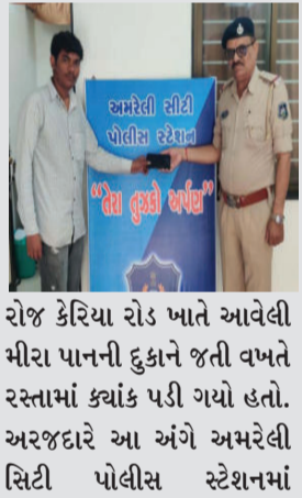
રોજ કેરિયા રોડ ખાતે આવેલી મીરા પાનની દુકાને જતી વખતે રસ્તામાં ક્યાંક પડી ગયો હતો. અરજદારે આ અંગે અમરેલી સિટી પોલીસ સ્ટેશનમાં

અરજી આપી હતી. અરજીના અનુસંધાને, અમરેલી સિટી પો. સ્ટે. સર્વેલન્સ ટીમે હુમન સોર્સની મદદથી સઘન તપાસ હાથ ધરી હતી અને ગુમ થયેલો મોબેલનો, જેની કિંમત રૂ. ૧૧,૫૦૦/- છે, તે ફોન શોધી કાઢ્યો હતો. પોલીસે તત્કાળ અરજદારને તેમનો ફોન પરત કરી 'તેરા તુજકો અર્પણ' કાર્યક્રમને ખરા અર્થમાં સફળ બનાવ્યો હતો.