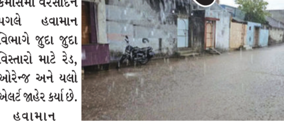
કમોસમી વરસાદને પગલે હવામાન વિભાગે જુદા જુદા વિસ્તારો માટે રેડ, ઓરેન્જ અને યલો એલર્ટ જાહેર કર્યાં છે. હવામાન વિભાગના જણાવ્યા અનુસાર, ભારે પવન અને ગાજવીજ સાથે કમોસમી વરસાદ વરસી શકે છે. આ સંદર્ભમાં

અમદાવાદ, તા. ૨૬ રાજ્યમાં છેલ્લા ૨૪ કલાકમાં અચાનક વાતાવરણમાં પલટો આવતા ૬૭ જેટલા તાલુકાઓમાં કમોસમી વરસાદ (માવઠું) પડ્યો છે. ખેડૂતોને પાકને નુકસાન થવાની ભીતિ સતાવી રહી છે, ત્યારે હવામાન વિભાગે આગામી ૪ દિવસ સુધી રાજ્યમાં હજુ ભારે વરસાદની આગાહી કરી છે.