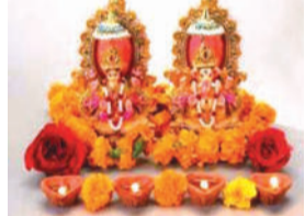
પાંચમના દિવસે મોટા ભાગના વેપારીઓ નવા વર્ષના વેપારના શ્રી ગણેશ, માતા લક્ષ્મી, શિવ અને ગણપતિની પૂજાથી કરતા હોય છે. દિવાળીના તહેવારો બાદ લાભ પાંચમના દિવસે વેપારીઓએ તેમના નવા વર્ષના વેપાર ધંધાની શરૂઆત કરી હતી.

અમદાવાદ, તા. ૨૬ દિવાળી પછીના પાંચમા દિવસે કારતક મહિનાના શુકલ પક્ષની પંચમીની તિથિ પર લાભ પાંચમનો તહેવાર ઉજવવામાં આવ્યો હતો. આ લાભ પાંચમનો દિવસ સામાન્ય રીતે વેપારી પેઢીઓ માટે તેમજ આજના દિવસે સંપત્તિની