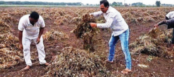
જોવા મળ્યો હતો. સાવરકુંડલા શહેરમાં શનિવારે બપોર પછી વાતાવરણમાં વાદળો છવાયેલા જોવા મળ્યા હતા. પછી ઝરમરિયો

ગામે તરસરીયા પરિવાર દ્વારા પિતૃના મોક્ષધામ માટે ભાગવત સમાહ ચાલતી હતી જેમાં કમોસમી વરસાદના કારણે મંડપ ઉડી ગયા હતાં. રાજુલાના જાકરાબાદ તાલુકાના ગ્રામ્ય વિસ્તારમાં અવિરત વરસાદ પડી રહ્યો છે. જેમાં વઢેરા, મીતીયાળા, નાગેશ્રી, ધારાબંદર, હેમાળ, રાજુલાના માંડરડી, આગરિયા, ધારેશ્વર સહિત ગામડામાં વરસાદ