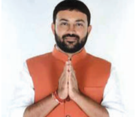
મહીસાગરનાં વડાગામમાં શ્રી પાટીદાર સેવા સમાજનો સ્નેહમિલન કાર્યક્રમ યોજાયો હતો. ૪૨ ગામ લેઉઆ પાટીદાર સમાજ ખાનપુર દ્વારા આ કાર્યક્રમનું આયોજન કરવામાં આવ્યું હતું. સરદાર પટેલની