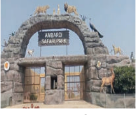
માગણી કરી રહ્યા છે. નજીકમાં આવેલા ખોડિયાર કેમ્પમાં નોકા વિહારની વ્યવસ્થા કરવામાં આવે

ધારી,તા.૨૬ ધારી શહેરથી સાત કિલોમીટર દુર આવેલ આંબરડીમાં સફારી પાર્ક બનાવીને તેને પ્રવાસન સ્થળ તરીકે જાણીતું બનાવવામાં આવી રહ્યું છે. રજાઓના દિવસોમાં અહીં મોટી સંખ્યામાં પ્રવાસીઓ મુલાકાતે આવી રહ્યા છે. પરંતુ પ્રવાસીઓ વધુ સુવિધા વિકસાવવાની