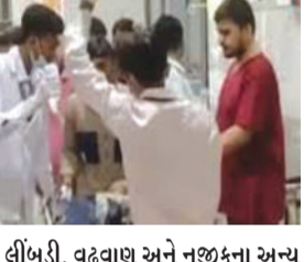
લીંબડી, વઢવાણ અને નજીકના અન્ય વિસ્તારોની હોસ્પિટલોમાં દાખલ કરવામાં આવ્યા છે, પ્રાથમિક માહિતી અનુસાર, નાના બાળકો, મહિલાઓ અને યુવાનોની સ્થિતિ વધુ ગંભીર હોવાનું જાણવા મળે છે.

સુરેન્દ્રનગર, તા. ૨૬ સુરેન્દ્રનગરમાં ફૂડ પોઈઝનિંગનો એક ગંભીર કેસ નોંધાયો છે. ગોમટા ગામના એક ઘરમાં ધાર્મિક સમારોહમાં પીરસવામાં આવતી છાશ પીવાથી ૨૦૦ થી વધુ લોકો ભીમાર પડ્યા હોવાનું જાણવા મળે છે. કાર્યક્રમના થોડા સમય પછી, ઉપસ્થિતોએ ઉલટી, ચક્રર અને પેટમાં દુઃખાવો થવાની ફરિયાદ શરૂ કરી. અસરગ્રસ્ત વ્યક્તિઓને