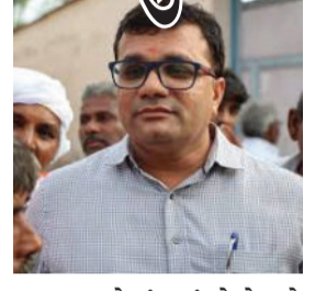
સ્પષ્ટ શબ્દોમાં કહ્યું છે કે હવે સરકારે ઉત્સવોમાંથી બહાર