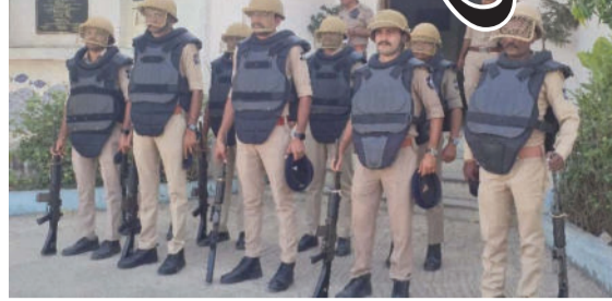
પોલીસ સ્ટેશનને થતાં, તેમણે તાત્કાલિક સંલગ્ન એજન્સીઓને જાણ કરી હતી.

હાથ ધરવામાં આવી હતી, જેથી કમાન્ડો વાઈટલ પોઈન્ટ્સથી વાકેફ થાય. મોકડીલ અંતર્ગત બપોરે ત્રણ વાગ્યા બાદ APL ટર્મિનલ, પીપાવાવ પોર્ટ ખાતે ત્રણ આતંકવાદીઓ વિસ્ફોટકો અને AK-૪૭ હથિયારો સાથે ઘૂસ્યા હોવાનો સંદેશ મળ્યો હતો. આતંકવાદી હુમલાની પ્રથમ જાણ પીપાવાવ મરીન