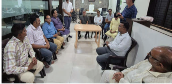
ન્યૂઝ ધીમે-ધીમે જિલ્લામાં છેવાડાના માનવી સુધી પહોંચ્યું છે. સંજોગ ન્યૂઝને ૮ વર્ષ પુરા કરી નવરાત્રિના નવમા