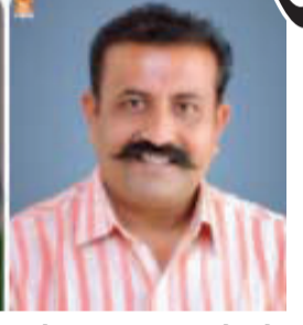
મળી રહે તેવા ઉમદા હેતુથી દૂધના પ્રતિ કિલો ફેટેના ભાવમાં વધારો કરવામાં આવ્યો છે.

અમર ડેરીના સ્થાપક ચેરમેન દિલીપભાઈ સંઘાણી અને સ્થાપક ડિરેક્ટર પરશોત્તમભાઈ રૂપાલા સાથે પરામર્શ કરીને, ચેરમેન, વાઈસ ચેરમેન અને બોર્ડ ઓફ ડિરેક્ટરોની ઉપસ્થિતિમાં આ નિર્ણય લેવાયો છે. હાલમાં દૂધના પ્રતિ કિલો ફેટેનો ભાવ રૂ. ૮.૧૦ છે, જેમાં રૂ. ૧ પનો વધારો કરવાનો