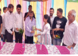
અને પ્રાથમિક સારવાર ઉપલબ્ધ થશે. સાથે જ, સરકારની વિવિધ આરોગ્યલક્ષી સેવાઓ અંગેની માહિતી અને માર્ગદર્શન પણ મળી રહેશે.