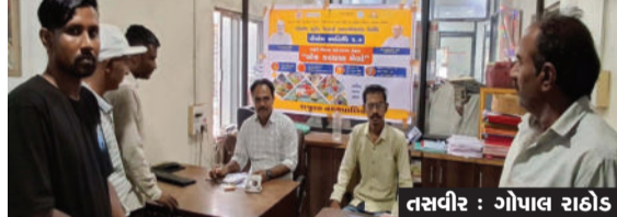
રાજુલા, તા. ૦૧

તા. ૩૦/૦૯/૨૦૨૫ મંગળવારના રોજ અમરેલી જિલ્લા રાજુલા નગરપાલિકા દ્વારા કર્મચારીઓ અને PM SVANIDHI યોજનાના લાભાર્થીઓનો શહેરી વિકાસ વર્ષ -૨૦૨૫ અન્વયે PM