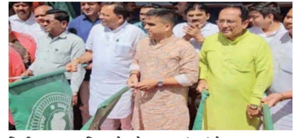
કિ.મી. ૨.૫૦ રૂપિયા છે, જે નવી વોલ્વોમાં રૂ. ૧.૫૦ છે. આ પ્રસંગે હર્ષ સંઘવીએ જણાવ્યું કે, એક વર્ષમાં ૨૦૦૦થી વધુ બસ મુકવામાં આવી છે. તેમણે વધુમાં જણાવ્યું હતું કે, આવનારા દસ દિવસમાં એટલે કે દિવાળીના તહેવાર પહેલાં નાગરિકો માટે બીજી નવી બસો ચાલુ કરવાનો ST વિભાગનો ટાર્ગેટ છે.

સુરત, તા. ૦૧ ગુજરાત એસટી વિભાગ દ્વારા સુરતમાં ૪૦ નવી બસનો પ્રારંભ કરવામાં આવ્યો છે. વાહન વ્યવહાર મંત્રી હર્ષ સંઘવીએ આ બસોને લીલી ઝંડી આપી હતી. આ ૪૦ બસમાં ૫ નવી વોલ્વોનો પણ સમાવેશ થાય છે. આ વોલ્વોમાં સુવિધા હાલની વોલ્વો બસ જેવી જ છે, જોકે ભાડું તેના કરતા ૨૫% ઓછું છે. જેથી મુસાફરોને રાહત થશે. હાલની વોલ્વોનું ભાડું પ્રતિ