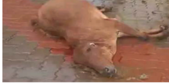
થતાં જ વનવિભાગની ટીમ તાત્કાલિક સ્થળ પર પહોંચી હતી. અમરેલી જિલ્લામાં સિંહોની વધતી જતી સંખ્યાના કારણે તેઓ હવે રેવન્યુ ગામડાઓમાં વધુ અવરજવર કરી રહ્યા છે. આનાથી ખેડૂતો અને સ્થાનિક લોકોમાં સતત ભયનો માહોલ જોવા મળી રહ્યો છે.

અમરેલી, તા. ૦૧ ધારી તાલુકાના ખીયા ગામમાં રાત્રિના સમયે એક સિંહણ તેના સિંહબાળ સાથે પ્રવેશી હતી. સિંહ પરિવારે ગામમાં બે પશુઓનું મારણ કર્યું હતું, જેના કારણે ગ્રામજનોમાં ગભરાટ ફેલાયો છે. આ સિંહ પરિવાર ગામની શેરીઓ અને બજારમાં પણ લટાર મારતો જોવા મળ્યો હતો, જેને પગલે સ્થાનિક લોકોમાં વધુ ફફડાટ ફેલાયો હતો. ઘટનાની જાણ