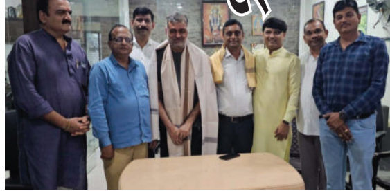
અમરેલી,તા.૦૧ સમાહના સાતેય દિવસ પ્રકાશિત સંજોગ ન્યૂઝ એ અમરેલી પહેલી ઓક્ટોબર જિલ્લાનું એકમાત્ર અખબાર છે જે ૨૦૧૭ના રોજ શરૂ થયેલું સંજોગ