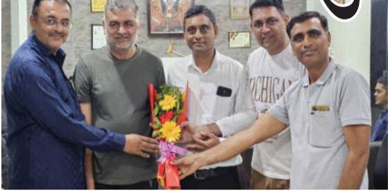
શહેર અને જિલ્લાના રાજકિય, સામાજિક અગ્રણીઓ અને પત્રકાર મિત્રો સંજોગ કાર્યાલય ખાતે આવી