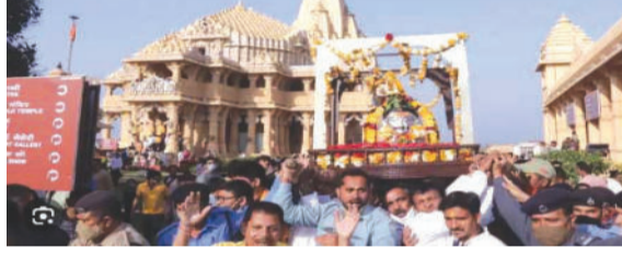
બિલીપત્ર, કૂલો, કળો અને દૂધ-જળથી અભિષેક કરી શિવજીને અર્પણ કર્યા હતાં. શહેરના નિર્ણયનગર વિસ્તારમાં

શ્રાવણ માસના બીજા સોમવારે અમદાવાદ સહિત ગુજરાતભરના શિવાલયોમાં ભક્તોની અપાર ભીડ જોવા મળી. શહેરના અનેક શિવ મંદિરોમાં વહેલી સવારથી જ ભક્તોનું ઘોડાપૂર ઉમટ્યું હતું. 'હર હર મહાદેવ'ના ગગનભેદી નાદ સાથે શિવભક્તો ભક્તિરસમાં ડૂબેલા દેખાયા. દેવાધિદેવ મહાદેવની આરાધના માટે ભક્તોએ