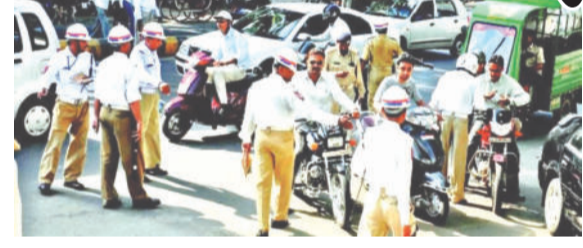
તવાઈ બોલાવી છે. જેમાં છેલ્લા દોઢ વર્ષમાં રોન્ગ સાઈડ, અકસ્માતમાં મોત, ઓવર સ્પિડ, ઓવરલોડ

અમદાવાદમાં છેલ્લા કેટલાક સમયથી રોન્ગ સાઈડ તથા ઓવર સ્પિડમાં બેફામ બેદકારી ભર્યા ડ્રાઈવિંગના કારણે અકસ્માતની વણગાર લાગી છે. માટેલા સાંઠની જેમ વાહનો હાંકી વાહનચાલકો નિર્દોષ નાગરિકોનો ભોગ લઈ રહ્યા છે. વાહનો ચલાવીને અકસ્માત સર્જનારા વાહનચાલકો સામે અમદાવાદ આરટીઓએ