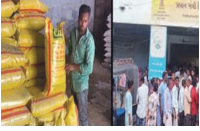
ડીલર્સ એસોસિએશને મંજૂરી ન હોવા છતાં યુરિયાનું વેચાણ કર્યું. ભાવનગરના ગુજરાત ઓનિયન ગ્રોવર્સ ફેડરેશન પાસે પણ યુરિયાના વેચાણનું લાયસન્સ નથી. બંનેએ

ગુજરાતમાં ખાતરમાં ચાલતી ગોલમાલ મુદ્દે મહત્વના સમાચાર સામે આવ્યા છે. ૧૦ જિલ્લાના ૩૭ ડીલર્સને નોટિસ ફટકારવામાં આવી છે. તપાસમાં જણાવાયું કે, મંજૂરી વિના જ બે જગ્યાએ યુરિયાનું વેચાણ થતું હતું. જામનગરના ગુજરાત ફર્ટિલાઈઝર્સ