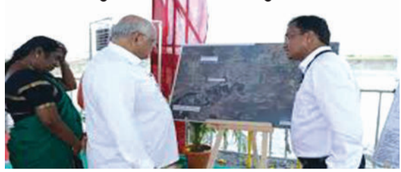
(એચ.એસ.એલ), ભરૂચ, તા.૪

૨૦૧૫ એકર વિસ્તારમાં ૩૮૦૦ કરોડના અંદાજિત ખર્ચ સાથે અદ્યતન ઈન્ફ્રાસ્ટ્રક્ચર યુક્ત બલ્ક ડ્રગ પાર્કની કોમન ઈન્ફ્રાસ્ટ્રક્ચર સુવિધાઓની કામગીરી મુખ્યમંત્રી ભૂપેન્દ્ર પટેલે નિહાળી