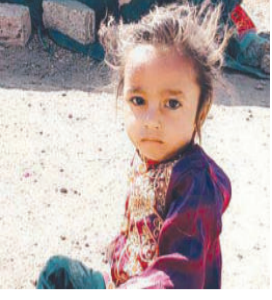
આસપાસના લોકો પણ હચમચી ગયા છે. આ ઘટનાને પગલે સમગ્ર વિસ્તારમાં શોક અને ભયનો માહોલ ફેલાયો છે. ઘટનાની