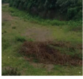
નહિવત જોવા મળી છે. ઉપરવાસમાં

ગીર પંથકમાં છેલ્લા ઝપ દિવસમાં નહિવત વરસાદને કારણે ઉના-ગીરગઢડા પંથકની શાહી, રૂપેણ, રાવલ અને મધુન્દ્રી નદીઓ સૂકી બની જતાં ખેડૂતો ચિંતામાં મુકાયા છે. જંગલ વિસ્તારમાંથી પસાર થતી રાવલ અને મધુન્દ્રી નદીમાં આયોમાસા દરમિયાન એકપણ વાર નવા નીર આવ્યા નથી. દર વર્ષે શ્રાવણ માસમાં બે કાંઠે વહેતી રાવલ નદીમાં આજે પણ નહિવત પાણી જોવા મળી રહ્યું છે. ગીર વિસ્તારમાંથી પસાર થતી શાહી નદી ખાલીબમ જોવા મળે છે. ગીરગઢડાની મધુન્દ્રી નદીમાં પણ નવા નીરની આવક