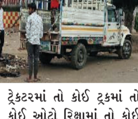
ટ્રેક્ટરમાં તો કોઈ ટ્રકમાં તો કોઈ ઓટો રિક્ષામાં તો કોઈ ટુલ્કીલમાં સાવરકુંડલા તાલુકાના લાથસણી ગામે આવેલ નદી કાંઠે દશામાને ભાવભરી વિદાય સાથે આવતાં વર્ષે વહેલા પધારવા માટે પ્રાર્થના કરી હતી.

સાવરકુંડલા, તા.૦૪ સાવરકુંડલા શહેરમાં દશામાના વ્રતની પૂર્ણાહુતિ થતાં ભાવિકો ભારે આરત્યા, ભક્તિભાવ તેમજ દશામાના ગુણગાન ગાતા ગાતા દશામાની મૂર્તિને જળમાં પધરાવવા લાથસણી ગામે આવેલ શેલ ડેટુમલ નદી કિનારે જતાં જોવા મળ્યા હતા. ભાવિકો દશામાના ગુણગાન ગાતાં ગાતાં કોઈ