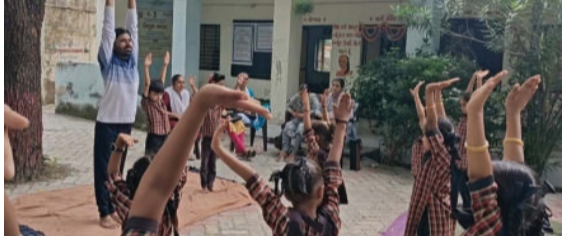
બાળકોને યોગ અભ્યાસ કરાવ્યો હતો. જેમાં સૂક્ષ્મ ક્રિયાઓ, આસન, પ્રાણાયામ વગેરેનો અભ્યાસ કરાવ્યો હતો. તેમજ નિયમિત યોગાભ્યાસ કરવાથી