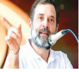
માટે પાયો તૈયાર કરવા માટે બ્લોક

કોંગ્રેસ ટૂંક સમયમાં ગુજરાતની ૧૮૨ વિધાનસભા બેઠકોમાંથી ૪૦ બેઠકો પર ફરીથી સ્થાન મેળવવા માટે કેમ્પેઈન શરૂ કરશે જ્યાં આદિવાસી મતદારો ચૂંટણી પરિણામોને પ્રભાવિત કરી શકે છે. આ કેમ્પેઈન ૨૦૨૭ માં યોજાનારી વિધાનસભા ચૂંટણી