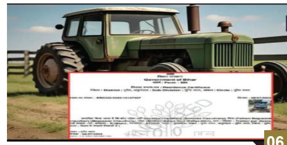
લાગે તો તીર : - બોસ, સરકારી ઓફિસોમાં ઘડકા ખાઈ ખાઈને યાકી ગયો હું

રોબર્ટ વાડ્રા જેલમાં જશે? હરિયાણામાં જમીનના સોદામાં ભ્રષ્ટાચારના કેસમાં રાહુલ ગાંધીના સુટેડ-બુટેડ જીજીએ રોબર્ટ વાડ્રા સામે ચાર્જશીટ દાખલ થતાં જ આ સવાલ ફરી પૂછાઈ રહ્યો છે. ફેબ્રુઆરી ૨૦૦૮માં રોબર્ટ વાડ્રાની કંપની સ્કાયલાઈટ હોસ્પિટાલિટીને ગુરુગ્રામના શિકોપુર ગામમાં ૩.૫ એકર જમીન ઓમકારેશ્વર પ્રોપર્ટીઝ નામની કંપની પાસેથી ખરીદી હતી. જમીનનો ૦.૫ કરોડ રૂપિયામાં સોદો થયેલો.