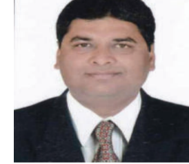
ડિવિડન્ડ જાહેર કરવામાં આવ્યું હતું સાથે જ બેંકે સતત ૨૩મા વર્ષે ઝીરો એનપીએલ મેળવેલ છે. બેંક