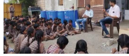
ઉત્સાહભરે જોડાયા હતા. આ ઉજવણી અંતર્ગત, બાલવાટિકાથી ધોરણ પાંચ સુધીના પ્રાથમિક વિભાગના બાળકોએ મુંજ્યાસર સિંચાઈ યોજના ખાતે આવેલી નર્સરીની મુલાકાત લીધી હતી

બગસરા શહેરમાં જેતપુર રોડ પર આવેલી શાળા નંબર ૪ ના વિદ્યાર્થીઓએ 'બેગલેસ ડે'ની અનોખી રીતે ઉજવણી કરી હતી. રાજ્ય સરકાર દ્વારા આગામી સત્રમાં ચાર શનિવાર 'બેગલેસ ડે' તરીકે ઉજવવાનો નિર્ણય લેવાતા, આ શાળાના વિદ્યાર્થીઓ આ કાર્યક્રમમાં