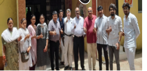
શીમ સાથે વિશ્વ વસ્તી દિવસની ઉજવણી કરવામાં આવી હતી આ ઉજવણીના ભાગરૂપે

જિલ્લા વિકાસ અધિકારીના માર્ગદર્શન નીચે અડજો કર્મચારીઓ આ કામગીરી કરી અમરેલી તા. ૨૦ અમરેલી આરોગ્ય વિભાગ દ્વારા વિશ્વ વસ્તી દિવસની ઉજવણીની સાથે સાથે તારીખ ૧૧ થી ૧૮ જુલાઈ દરમિયાન મા બનવાની ઉંમર એ જ જ્યારે શરીર અને મન તૈયાર હોય પ્રાથમિક આરોગ્ય કેન્દ્ર ચાવંડ ખાતે તા ૧૮ ના રોજ જિલ્લા કક્ષાના પુરુષ નસબંધી કેમ્પનું આયોજન કરવામાં આવ્યું હતું જેમાં ભાવનગરથી પુરુષ નસબંધીના સર્જન ડો. બોરીયાએ સેવા આપી હતી જિલ્લા કક્ષાના આ કેમ્પમાં કુલ ત્રણ પુરુષ નસબંધીના ઓપરેશન કરવામાં આવ્યા હતા. જિલ્લા વિકાસ અધિકારીના માર્ગદર્શન નીચે અડજો કર્મચારીઓએ આ કામગીરી કરી હતી.