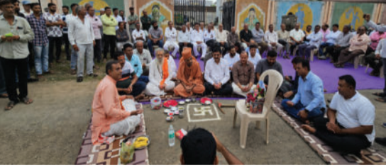
આ રસ્તાનું ખાતમુહૂર્ત કરવામાં આર. ૩. ૨.૨૨ કરોડના ખર્ચે ખાતમુહૂર્ત સમારોહમાં ધારાસભ્ય

બગસરાથી અમરેલી જવા માટેનો આ એકમાત્ર માર્ગ અગાઉ પણ બે-ત્રણ વખત બનાવવામાં આવ્યો હતો, પરંતુ ભારે પાણીના પ્રવાહને કારણે તે વારંવાર ધોવાઈ જતા અત્યંત બિસ્માર બની જતો હતો. સ્થાનિક લોકો દ્વારા અનેકવાર રજૂઆતો કરવામાં આયા બાદ અંતે