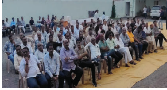
યાત્રા અમરેલી જિલ્લામાં પ્રવેશ કરશે અને ૨૧ સપ્ટેમ્બરના રોજ જિલ્લાના વિવિધ સ્થળોએ ફરી સોમનાથ તરફ જશે. આ તકે