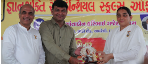
અભ્યાસમાં પ્રગતિ માટે જ્ઞાનરૂપી સ્મરણ શક્તિ દ્વારા એકાગ્રતા પ્રાપ્ત કરવા પ્રેરિત કર્યાં. આ પ્રસંગે બ્રહ્માકુમારી સેન્ટરના પ્રતિનિધિઓ,