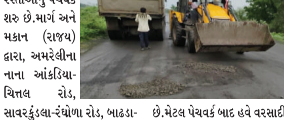
વિભાગ હેઠળના રસ્તાઓનું પેચવર્ક શરૂ છે. માર્ગ અને મકાન (રાજ્ય) દ્વારા, અમરેલીના નાના આંકડિયા-ચિત્તલ રોડ, સાવરકુંડલા-રંઘોળા રોડ, બાદગા-થોરડી-રાજુલા રોડ, રાજુલા-ડુંગર રોડ, ચાંચ - ખેરા પટવા રોડ પર મેટલ વર્ક કરવામાં આવ્યું છે. મેટલ પેચવર્ક બાદ હવે વરસાદી વાતાવરણ ન હોય ત્યારે ડામર પેચ વર્ક કરવાનું આયોજન હાથ ધરવામાં આવ્યું છે.

અમરેલી, તા.૦૮ અમરેલી જિલ્લામાં છેલ્લા થોડાં દિવસો પૂર્વે થયેલા વરસાદથી અસરગ્રસ્ત શહેરી અને ગ્રામ્ય વિસ્તારના રસ્તાઓના મરામતની કામગીરી અમરેલી જિલ્લામાં શરૂ છે. વરસાદથી અસરગ્રસ્ત રસ્તાઓની મરામત પ્રક્રિયા હાલ શરૂ છે. બિસ્માર રસ્તાઓનું મેટલિંગ દ્વારા પેચવર્ક થઈ રહ્યું છે, જિલ્લાના માર્ગ અને મકાન (રાજ્ય)