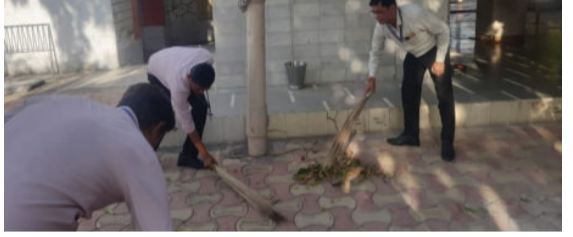
તથા નાગરિક સહકારી બેંચો દ્વારા 'સ્વચ્છતા મે સહકાર' કાર્યક્રમની હર્ષભેર ઉજવણી કરવામાં આવી હતી. આ કાર્યક્રમમાં સહકારી સંસ્થાના આગેવાનો અને સ્થાનિક નાગરિકો ઉત્સાહભેર જોડાયા હતા.

અમરેલી, તા.૦૮ અમરેલી જિલ્લામાં આંતરરાષ્ટ્રીય સહકારી વર્ષ-૨૦૨૫ અંતર્ગત જિલ્લાના ગ્રામ્ય અને શહેરી વિસ્તારમાં 'સ્વચ્છતા મે સહકાર' કાર્યક્રમ યોજવામાં આવ્યા હતા, જેમાં પ્રભાત ફેરી અને સ્વચ્છતાલક્ષી કાર્યક્રમ યોજાયા હતા. જિલ્લાની સેવા સહકારી મંડળીઓ, સહકારી સંઘો