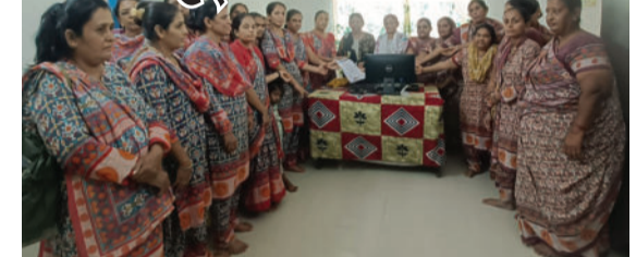
રાજ્ય સરકારના પરિપત્ર છતાં વધારાની કામગીરીઓ જેવી કે પોષણ ટેકર લાભાર્થીઓના KYC અને દર મહિને ફોટો

લીલીયા, તા.૦૮ લીલીયા મોટા ઘટકના ૮૦ આંગણવાડી કેન્દ્રોની ૧૪૫ વર્કર અને હેલ્પર બહેનો એક દિવસની સામૂહિક રજા પર રહેશે. તેઓ પોતાની વિવિધ પડતર માંગણીઓને લઈને સરકાર સામે વિરોધ નોંધાવશે. મુખ્ય માંગણીઓમાં ૨૦૧૮ પછી વેતન વધારો ન થયો હોવાનો મુદ્દો છે. આ ઉપરાંત,