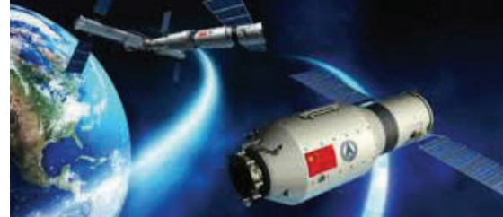
અવકાશયાત્રીઓ મોકલવાનું છે. લખનૌમાં ઈસરાતના અધ્યક્ષ અને ભારત સરકારના અવકાશ વિભાગના સચિવ ડૉ. વી. નારાયણન દ્વારા આ વાત કહેવામાં

(એચ.એસ.એલ), લખનૌ, તા.૮ એક સમય હતો જ્યારે રોકેટ સાયકલ પર લઈ જવામાં આવતા હતા, પરંતુ આજે ભારત નવા રોકેટ બનાવી રહ્યું છે. હવે દેશ એવા રોકેટ પર કામ કરી રહ્યો છે જે પૃથ્વીની નીચેની ભ્રમણકક્ષામાં ૭૫ હજાર કિલોગ્રામ વજનના ઉપગ્રહો લોન્ચ કરી શકશે. ઈસરોનું આગામી મોટું લક્ષ્ય પોતાનું સ્પેસ સ્ટેશન બનાવવાનું અને ચંદ્રની સપાટી પર