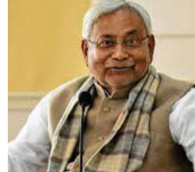
લેવામાં આવ્યો છે. આ ઉપરાંત, બિહારમાં યુવા આયોગની રચનાને પણ કેબિનેટ બેઠકમાં મંજૂરી આપવામાં આવી છે. યુવા આયોગની રચના અંગે,

મહિલાઓને ઉપ ટકા અનામત અને યુવા આયોગની રચના અંગે કરવામાં આવી છે. મુખ્યમંત્રી નીતિશ કુમારના નેતૃત્વ હેઠળની સરકારે બિહારમાં સરકારી પદો પર સીધી ભરતીમાં આદિવાસી મહિલાઓને ઉપ ટકા અનામત આપવાનો નિર્ણય લીધો છે. બિહારમાં મહિલાઓને પહેલાથી જ અનામત છે પરંતુ આજે આદિવાસી મહિલાઓને અનામત આપવાનો નિર્ણય