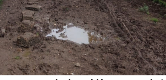
અવારનવાર પડતા હોય તેવા દ્રશ્યો પણ જોવા મળે છે. પાલિકા લોકોને રસ્તા બનાવવા માટે તુરંત કાર્યવાહી હાથ ધરે તેવી માંગ ઉઠી છે. આ વિસ્તારમાં ભૂગર્ભ તથા પાણીની નવી પાઈપલાઈન નાખવામાં આવેલ છે. જેમાં પાણીની પાઈપલાઈન તૂટી જતા રસ્તાઓ ઉપર ભરાયેલું ગંદું પાણી પણ પાઈપલાઈનમાં ભળી લોકોના પીવાના પાણીમાં પણ ભળી રહ્યું છે. જેથી અગામી દિવસોમાં આ વિસ્તારોમાં

ચોમાસા દરમિયાન માતૃશક્તિ સોસાયટી, મારુતિ નંદન, મારુતિ ધામ, ખોડીયાર નગર વગેરે વિસ્તારોમાં લોકોને અવરજવર કરવા માટે કિચડ ભરેલા રસ્તાઓ પરથી પસાર થવું પડે છે. જેમાં નાના બાળકો અને વૃદ્ધો સૌથી વધારે મુશ્કેલી ભોગવી રહ્યા છે. તેમજ વાહન ચાલકો