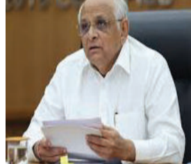
રૂ. ૭,૮૬૪ કરોડ કરતાં વધુની સહાય આપી વડાપ્રધાન નરેન્દ્રભાઈ મોદીના વિકસિત ભારત@૨૦૨૪ના સ્વપ્નને સાકાર કરવામાં સિંહકાળો આપી

ગાંધીનગર, તા. ૧૬ રાજ્ય સરકારની ઉદાર ઉદ્યોગ નીતિના અસરકારક અમલીકરણના પરિણામે ગુજરાત ઔદ્યોગિક વિકાસમાં અગ્રેસર રાજ્ય તરીકે પ્રસ્થાપિત થયું છે. ગુજરાત સરકાર સૂક્ષ્મ, લઘુ અને મધ્યમ ઉદ્યોગો - MSME માટે સહાય યોજનાઓ અંતર્ગત વર્ષ ૨૦૨૦-૨૧થી વર્ષ ૨૦૨૪-૨૫ સુધીમાં કુલ ૧.૩૦ લાખ કરતાં વધુ એકમોને