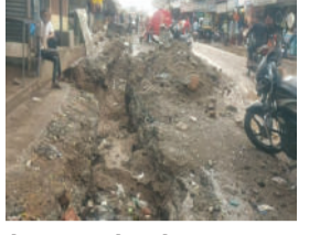
છે ત્યાં હાલ મોટા મોટા ખાડા ખુલ્યા છે. કમોસમી વરસાદને કારણે ખાડાઓમાં ધોવાણ પણ થઈ રહ્યું છે તેમ આસપાસના વેપારીઓનું કહેવું

સાવરકુંડલા શહેરના મધ્યમાંથી પસાર થતો નાવલી નદી પાસેનો માર્ગ કે જે આઈકોનીક માર્ગ તરીકે ઓળખાવાનો છે તેમાં હાલ રિધિ સિધિનાથ મહાદેવ મંદિરથી અમરેલી રોડ, ભુવા રોડ તરફ જતાં રસ્તા સુધી હાલ કરોડો રૂપિયાના ખર્ચે ભૂગર્ભ ગટર યોજનાનું કામ ચાલુ છે. છેલ્લા બે મહિનાથી આ કામ સાઈડમાં ઠેર ઠેર ખોદકામ થઈ રહ્યું છે. ઊંડા ખોદકામ કરેલાં ખાડામાં ગટરના ભૂંગળા ફિટ કરવામાં આવી રહ્યા છે. જો કે આ સંદર્ભે રસ્તાની સાઈડમાં ઊંડું ખોદકામ કરતાં આ કમોસમી વરસાદને કારણે રસ્તા પર ખાડાઓમાં પાણી ભરાયા છે અને લગભગ દોઢ માથોડા ઊંડા આ ખાડા કે જ્યાં ગટરની કુંડીઓ બનાવવાની