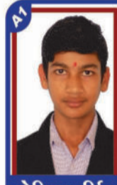
ઓપિયા દર્શિત P.R. 99.73 C6000371