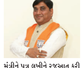
મંત્રીને પત્ર લખીને રજૂઆત કરી હતી. આ માંગણીને ગંભીરતાથી ધ્યાને લઈ સરકારે તાત્કાલિક મંજૂરી આપી છે. આ અંગે એક વિદ્યાર્થીએ જણાવ્યું હતું કે, હવે અમારે MA અને M.Com ના

બાબરાની સરકારી કોલેજમાં MA અને M.Comના નવા કેન્દ્રોની ફાળવણી થતાં વિદ્યાર્થીઓમાં ખુશી વ્યાપી છે. આ કેન્દ્રોની ફાળવણી માટે લાઠી-બાબરાના ધારાસભ્ય જનકભાઈ તળવીયાએ અથાગ પ્રયાસો કર્યો હતો. ધારાસભ્ય જનકભાઈ તળવીયાએ બાબરાની કોલેજમાં ઉચ્ચ શિક્ષણના આ કેન્દ્રો શરૂ કરવા માટે રાજ્યના શિક્ષણ