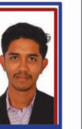
સરધારા વજ P.R. 97.76 C6000334