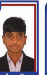
વસોયા પ્રિત P.R. 98.81 C6000277