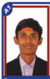
હિરપરા જયજ્ઞાણ P.R. 99.84 C6000404