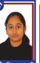
સોરઠિયા યુક્તી P.R. 99.48 C6000276