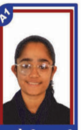
મડકોતેચા ભુમી P.R. 99.77 C6000343