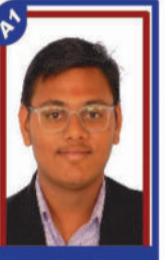
વાળા પરમ P.R. 99.69 C6000402