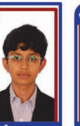
ચત્રોલા ઝતમ P.R. 96.76 C6000224