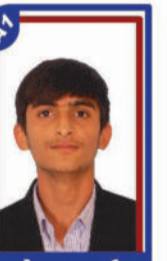
ગજેરા આર્યન P.R. 98.42 C6000301