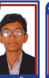
ડરડર પ્રતિલ P.R. 98.71 C6000282