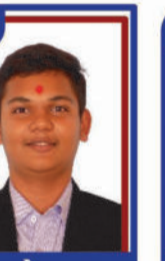
ગજેરા યુગ P.R. 98.31 C6000426