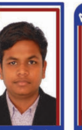
મઢવાણા દેવાંગ P.R. 96.50 C6000292