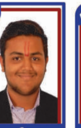
સુવાગીયા ઝહ P.R. 96.89 C6000333