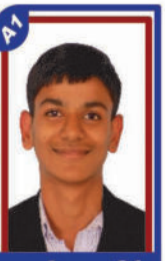
ડાબરીયા ધાર્મિડ P.R. 97.64 C6000370