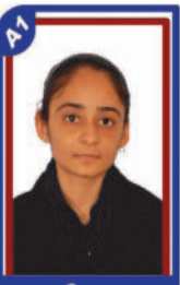
જાની ડાવ્યા P.R. 97.64 C6000239