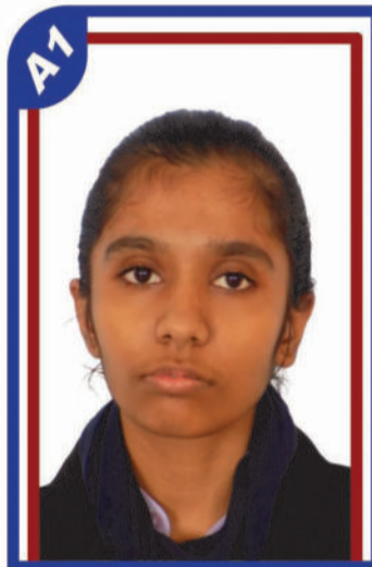
ઠાકર અનામીકા P.R. 99.93 C6000329