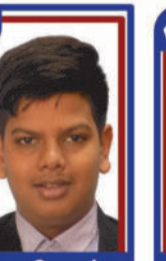
વઘાસીયા પંશ P.R. 98.31 C6000396