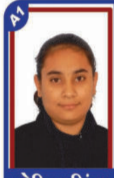
ડોઠિયા બિંદા P.R. 99.73 C6000339