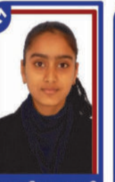
પરવાડીયા ઝહાની P.R. 98.90 C6000293