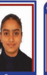
પરવાડિયા ડિવ્યા P.R. 98.71 C6000232