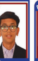
ડોરાટ ભવ્ય P.R. 99.22 C6000317