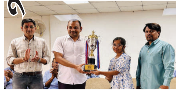
૯૦ થી વધુ P.R. મેળવ્યા વિદ્યાર્થીઓની મહેનતને છે, જે સંસ્થાની મહેનત અને આભારી છે. ખાસ કરીને