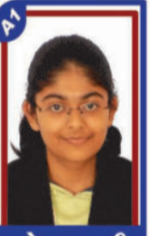
મહેતા રાજવી P.R. 99.60 C6000412