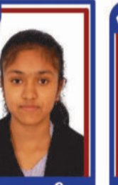
પઘડાળ નીવા P.R. 99.28 C6000331