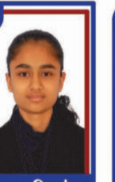
ઘાઘલ મિમાંશા P.R. 98.81 C6000393