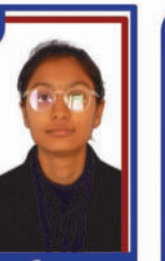
તાલાવીયા શ્વેતા P.R. 97.14 C6000241