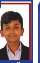
રાજપરા જૈનમ P.R. 99.35 C6000235