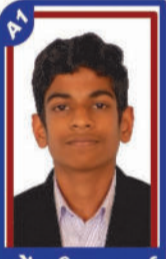
ગોંડલીયા સમર્થ P.R. 99.64 C6000349