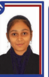
ભાલાના મનસ્વી P.R. 98.31 C6001651