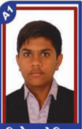
પિરોચા ઝેનિલ P.R. 99.14 C6000285