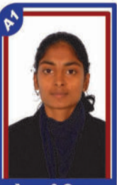
દેસાઈ દિશા P.R. 98.52 C6002142