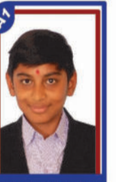
ભાલાના દક્ષ P.R. 98.90 C6000350