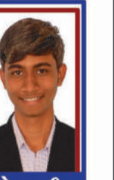
ચત્રોલા સ્મીત P.R. 99.14 C6000275