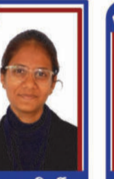
સોંધરવા હિમીશા P.R. 99.28 C6000260