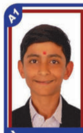
ગોડાસરા આરુસ P.R. 99.84 C6000421