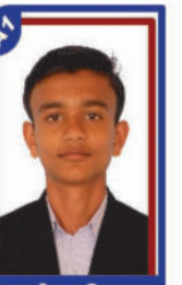
પટેલ વિર P.R. 97.14 C6000251