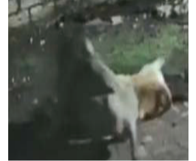
ગાય લપસી પડી હતી. લપસી હોવા છતાં ગાય મોતથી બચવા

હતા. સિંહોની ડણક સાંભળીને ગામના કૂતરાઓ જીવ બચાવવા ભાગી ગયા હતા. જોકે, એક ગાય સિંહોની નજરે પડતાં સિંહોએ તેનો શિકાર કરવાનો પ્રયાસ કરતા ગાય ભાગી ગઈ હતી. જે દરમિયાન વરસાદને કારણે રસ્તા પર પાણી અને ચીકણા હોવાથી