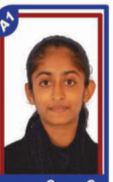
રામાણી હરતી P.R. 99.77 C6000210