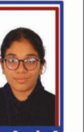
મેવાસાણીયા હેપ્પી P.R. 98.62 C6000322