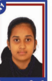
પિરમગામા સિદ્ધી P.R. 99.55 C6000411