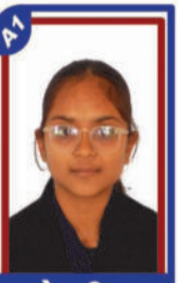
ગોલ રિયા P.R. 98.52 C6001454