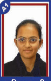
ગઢિયા ધ્વની P.R. 99.69 C6000297