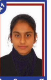
શેખલીયા ધાર્મી P.R. 99.55 C6001147