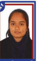
બાજરીયા પૂઠી P.R. 98.42 C6000422