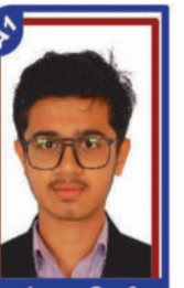
પંડ્યા તિર્થ P.R. 97.64 C6000397