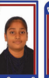
સતાસીયા ભુમી P.R. 98.71 C6000254