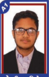
સોળીયા વિપેન્ડ P.R. 99.64 C6001082