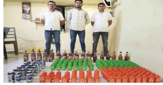
વિદેશી દારૂ અને બિયરની કુલ ૨૧૭ બોટલ જપ્ત કરી છે. આ જથ્થાની કિંમત રૂ.૩૩,૭૩૦

અમરેલી એલસીબી પોલીસે સાવરકુંડલા શહેરમાં દારૂબંધી કાયદા વિરુદ્ધ મોટી કાર્યવાહી કરી છે. પોલીસને મળેલી બાતમીના આધારે એક રહેણાંક મકાનમાં દરોડો પાડવામાં આવ્યો હતો. દરોડા દરમિયાન પોલીસે