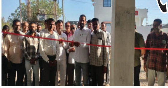
જનભાગીદારી દ્વારા કાર્યરત છે. જેનું દેવરાજીયા ગામ ઉદાહરણરૂપ છે. ચાંદગઢ ખાતે નવનિર્મિત ગ્રામપંચાયત